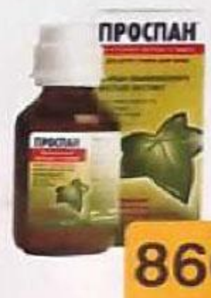
ТАБЛ. 200 МГ, №60 ЛП-007433