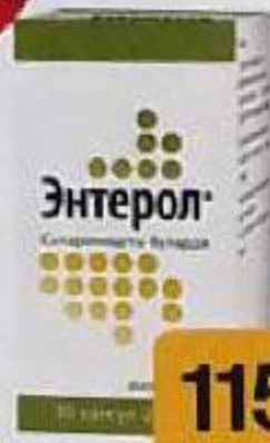
ТАБЛ. П. О. №90 ЛСР-008492/08