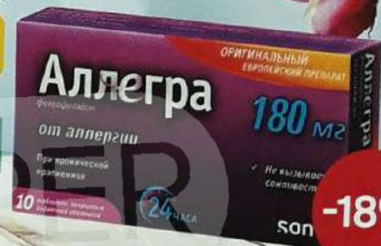
ТАБЛ. П. О. 180 МГ, №10 ЛП-№(002678)-(РГ-РУ)