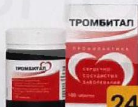
ТАБЛ. 200 МГ, №30 ЛП-№(000425)-(РГ-РУ)