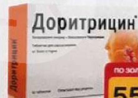
ТАБЛ. П. О. 75 МГ, №100 ЛП-004177