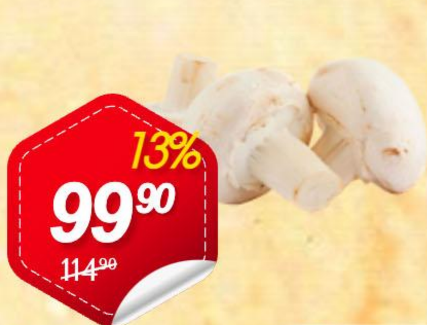
Грибы шампиньоны 250гр 250г