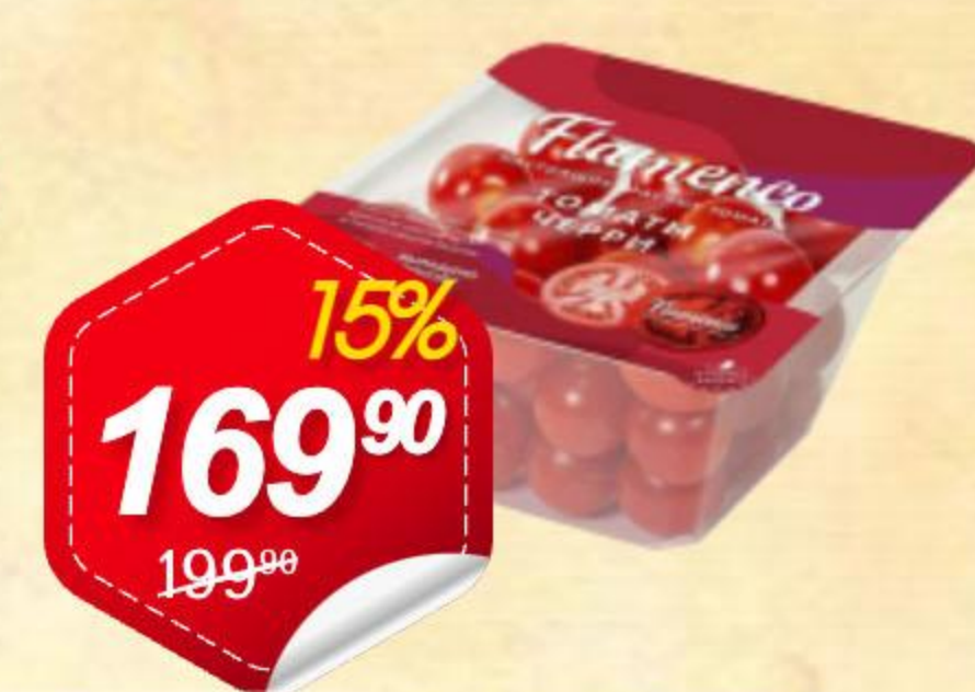
Томаты Черри ФЛАМЕНКО красные, круглые, 250г