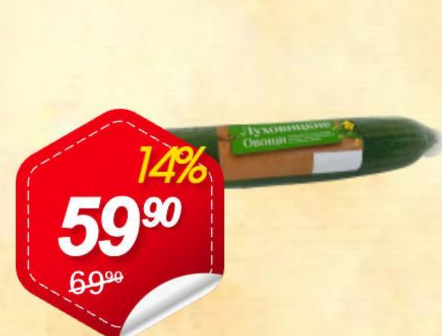
Огурцы свежие ЛУХОВИЦКИЕ ОВОЩИ среднеплодные, 1шт