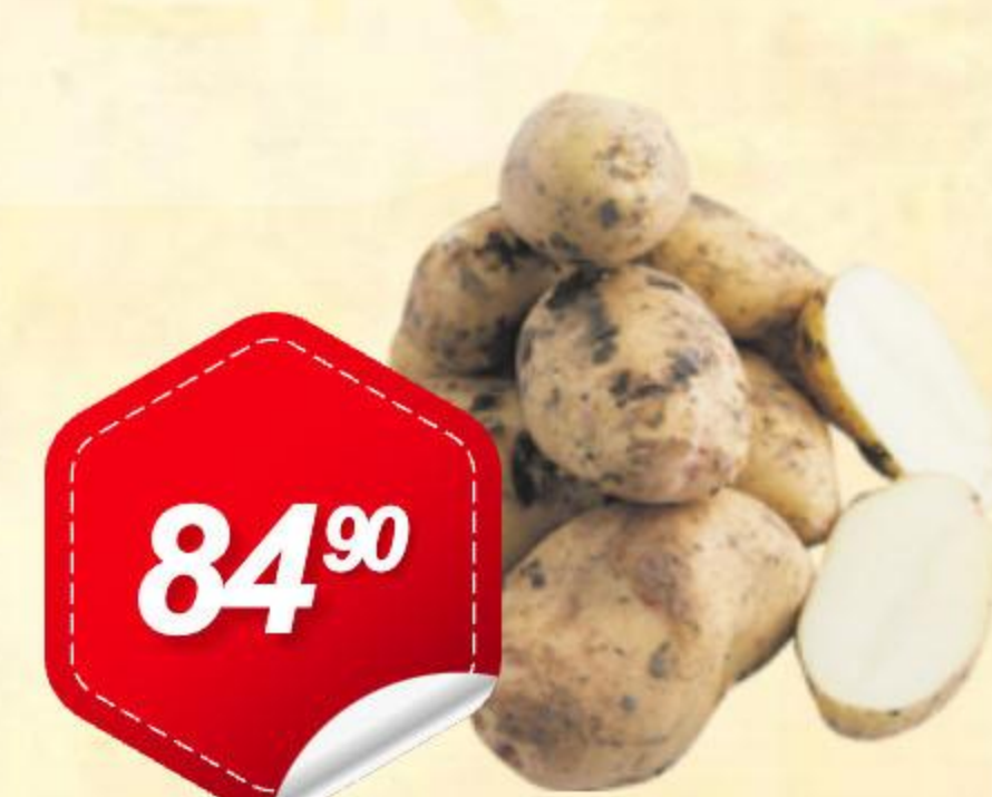
Картофель импортный молодой 1кг