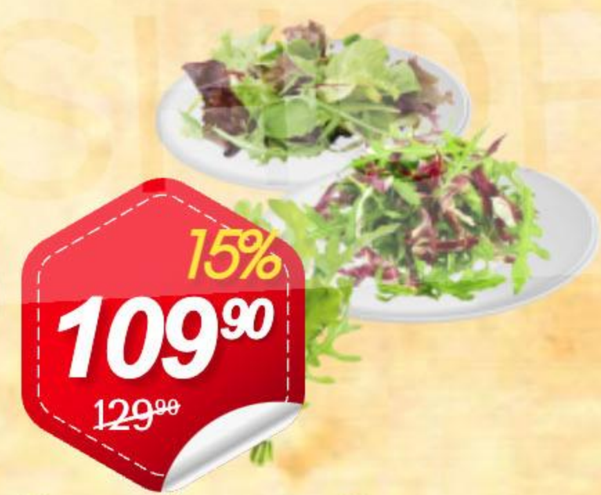
Салат Месклам, Салат Руккола, Салатная смесь Руккола Радиччо руккола, мангольд, шпинат, 75г