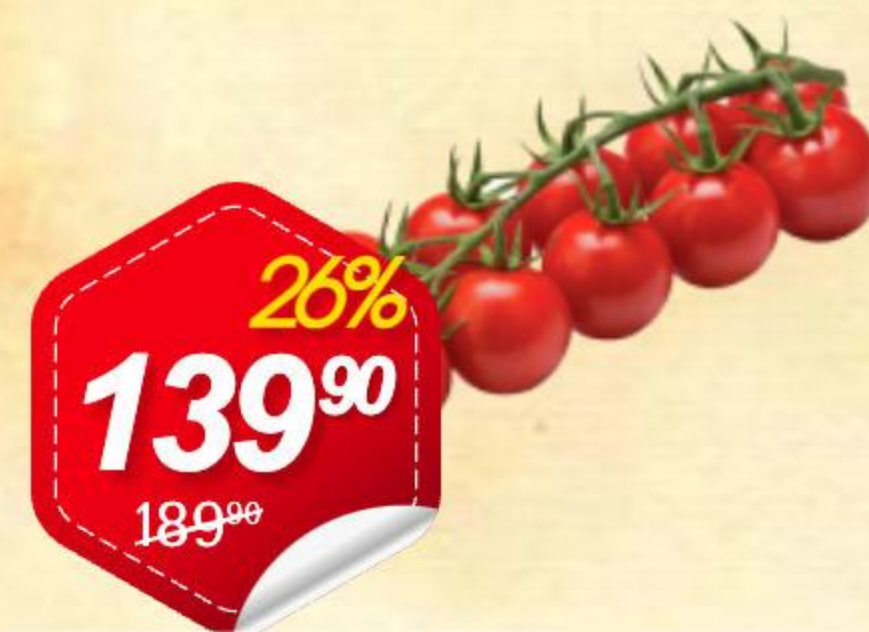
Томаты Коктейльные 250г