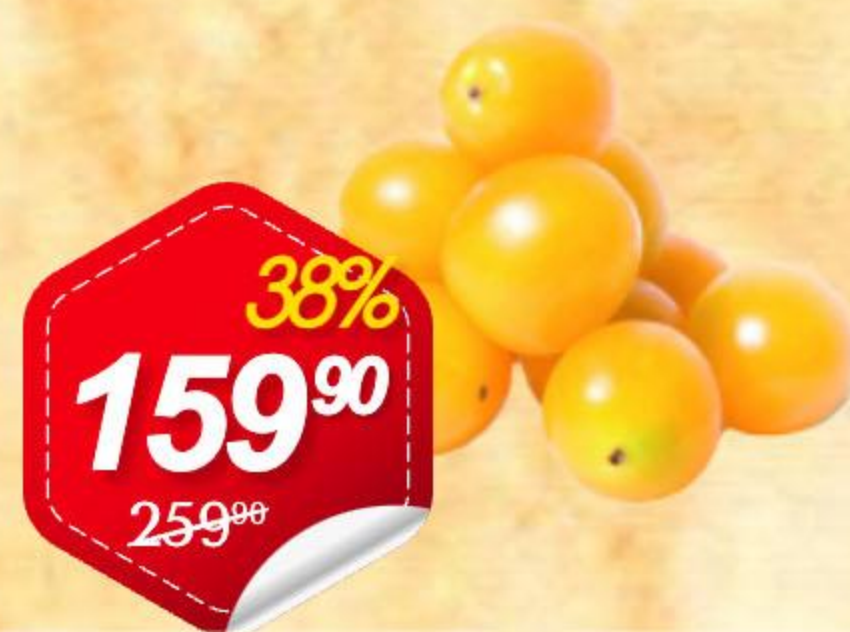
Томаты черри желтые 250г