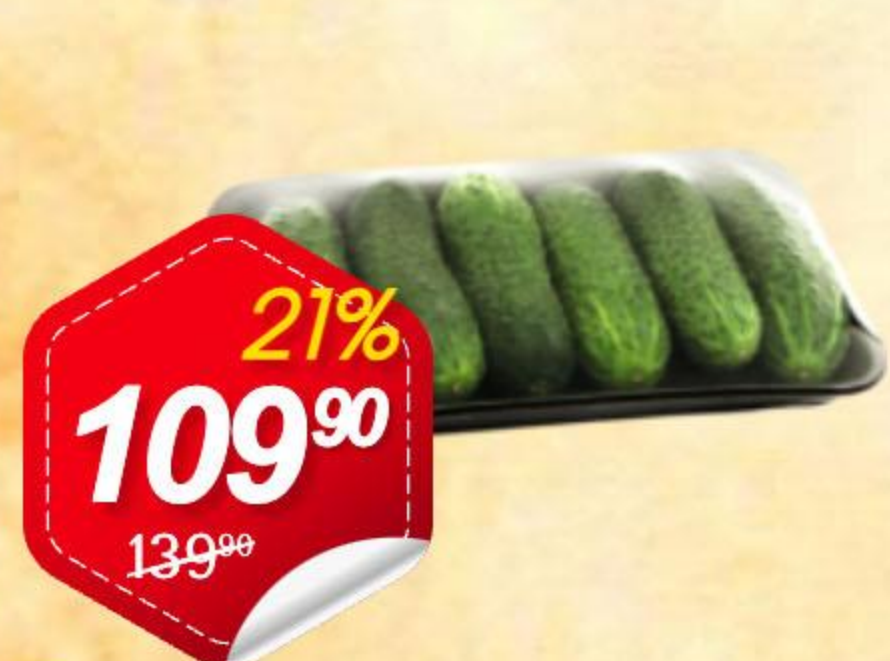
Огурцы люкс упаковка, 450г