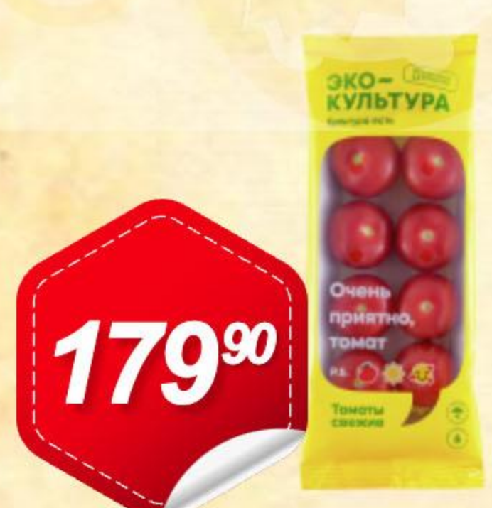
Томат Коктейльный розовый 350г