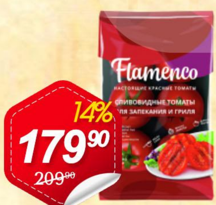
Томаты ФЛАМЕНКО сливовидные, красные, 450г