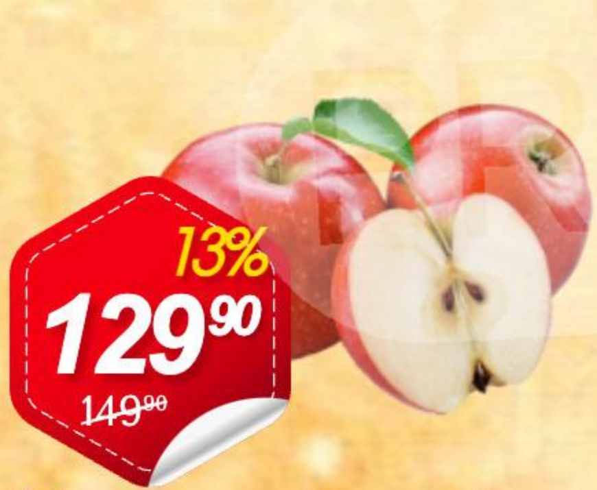
Яблоки свежие (красные) 1кг