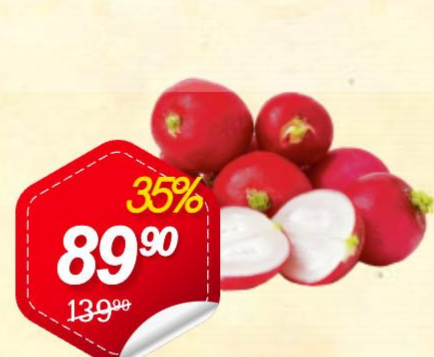
Редис упаковка, 500г