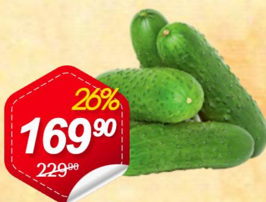
Огурцы короткоплодные 1кг