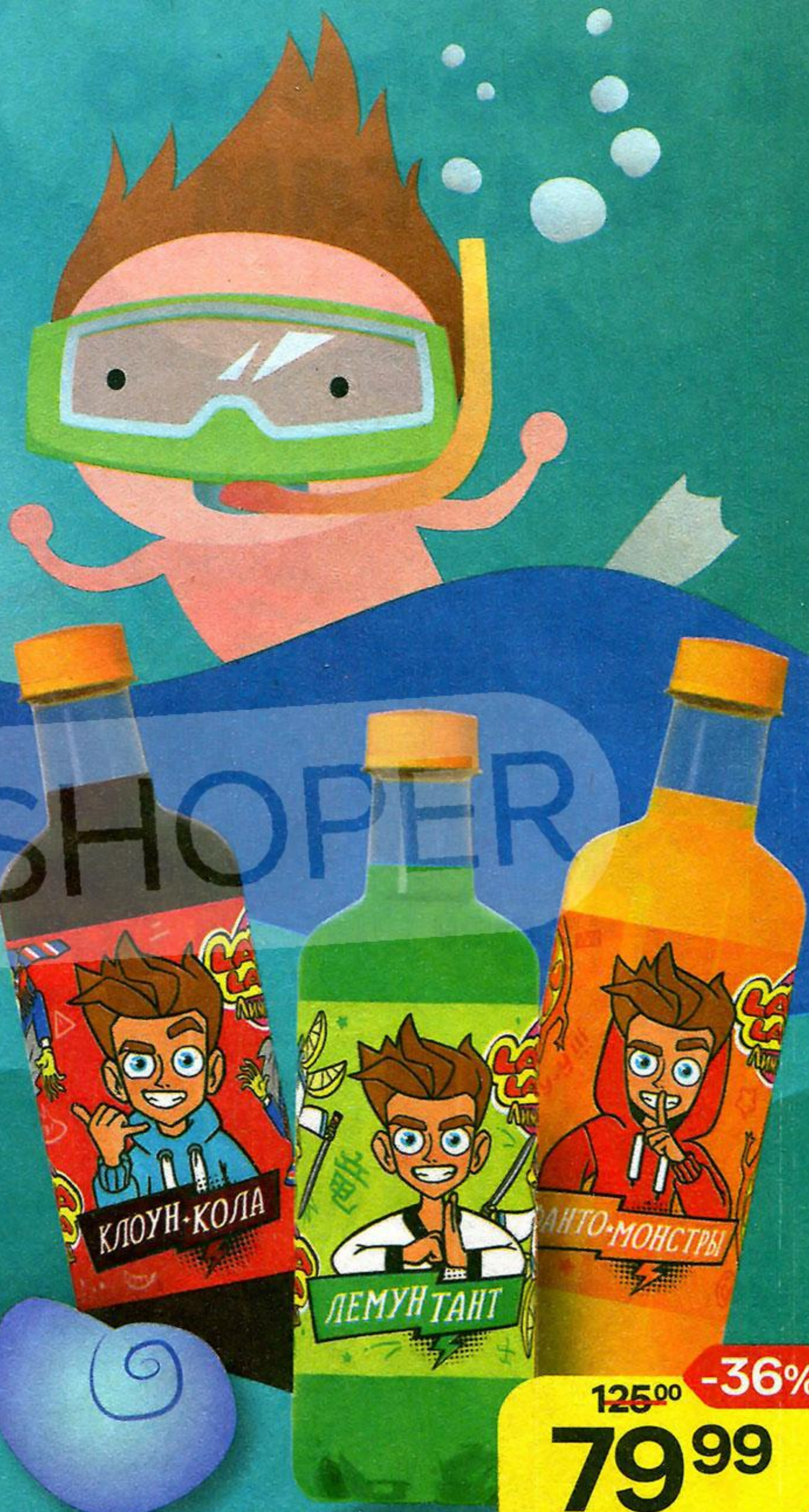
Напиток сильногазированный LAVA LAVA в ассортименте*, 500 мл