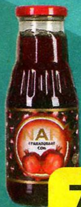
Сок гранатовый NAR , 310 мл