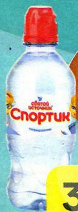
Вода питьевая СВЯТОЙ ИСТОЧНИК Спорт, негазированная, 330 мл