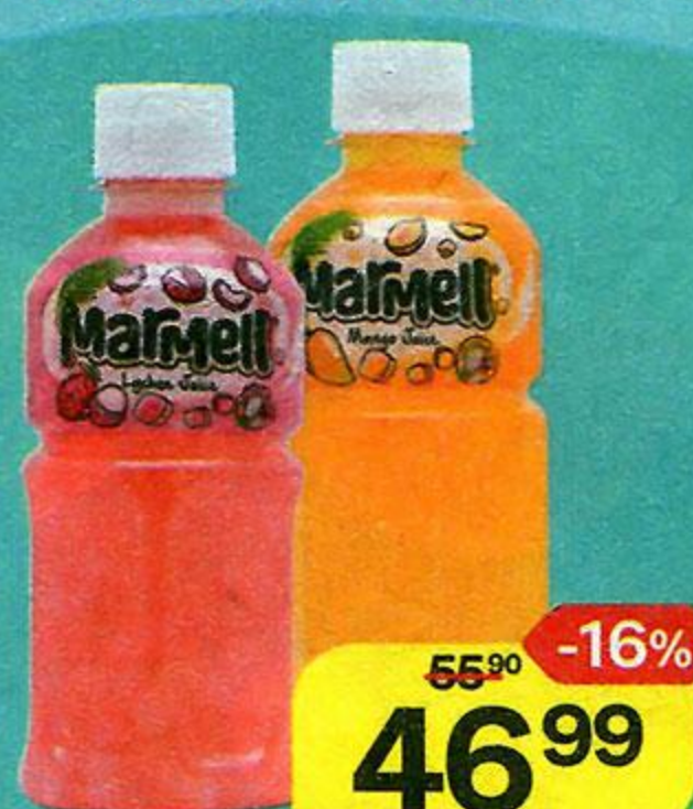
Напиток MARMELL С кусочками кокосового желе: Манго / Дыня / Личи, 320 мл