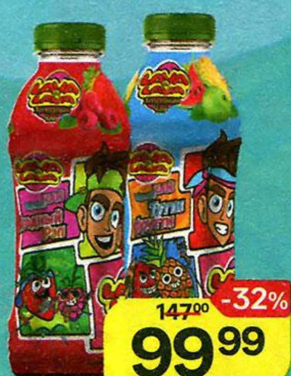
Холодный чай LAVA LAVA в ассортименте*, 500 мл