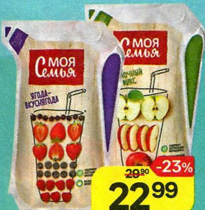
Напиток МОЯ СЕМЬЯ Яблочный микс / Фруктово-ягодный / Мультифрукт, 175 мл