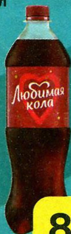
Напиток сильногазированный ЛЮБИМАЯ КОЛА , 1 л