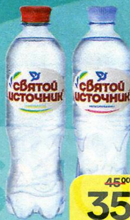
Вода питьевая СВЯТОЙ ИСТОЧНИК Газированная / Негазированная, 500 мл