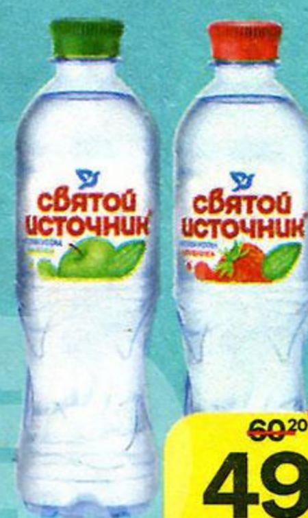
Вода питьевая СВЯТОЙ ИСТОЧНИК негазированная: Яблоко / Клубника / Персик, 500 мл