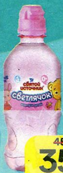
Вода СВЯТОЙ ИСТОЧНИК , Светлячок, 330 мл