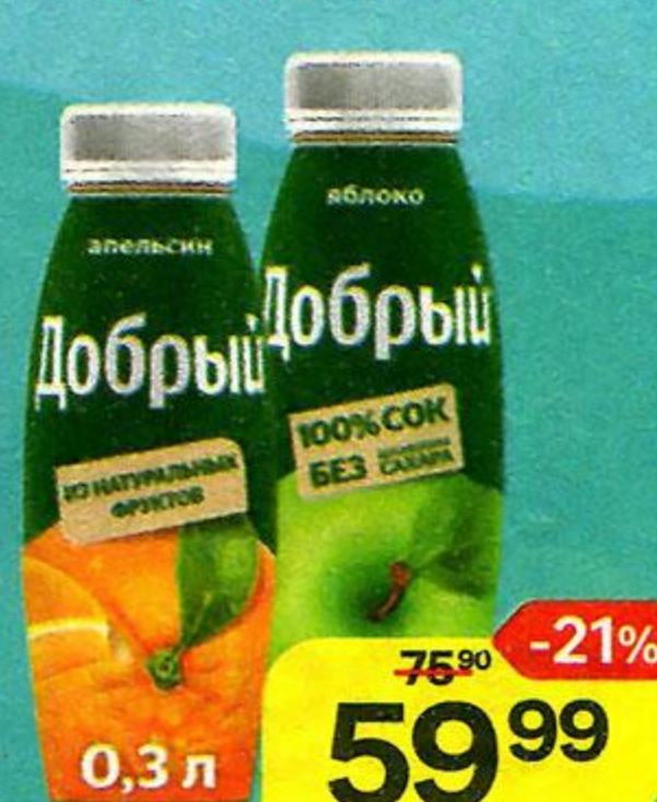
ДОБРЫЙ Сок, Яблочный; Нектар: Апельсин / Мультифрукт, 300 мл