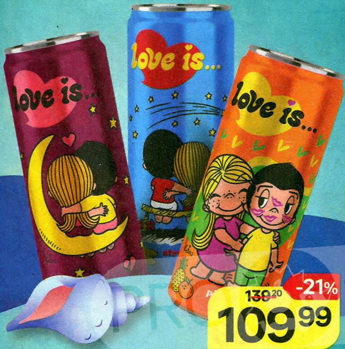
Напиток газированный LOVE IS Клубника-банан/ Вишня-лимон/ Ананас-апельсин, 330 мл