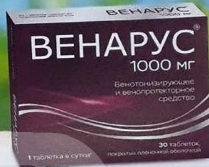
ТАБЛ. П. О. 1000 МГ, №30 ЛП-003561