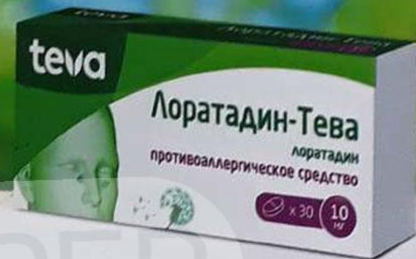
ТАБЛ. 10 МГ, №30 ЛП-№(005013)-(РГ-РУ)