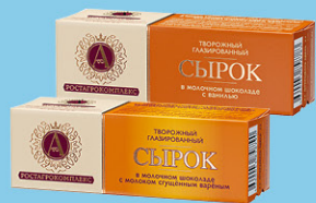
СЫРОК ТВОРОЖНЫЙ РОСТАГРОЭКСПОРТ, глазированный, 20/26%, 50 г, в ассортименте