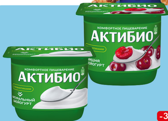
БИОЙОГУРТ АКТИБИО, 2-3,5%, 130 г, в ассортименте