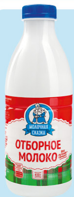
МОЛОКО МОЛОЧНАЯ СКАЗКА, пастеризованное 3,5-4,5%, 850 г