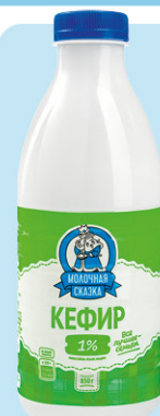
КЕФИР МОЛОЧНАЯ СКАЗКА, ГОСТ, 1%, 850 г