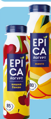
ЙОГУРТ ПИТЬЕВОЙ ЕРИСА, 2,5%, 260 г, в ассортименте