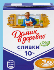
СЛИВКИ ДОМИК В ДЕРЕВНЕ, стерилизованные, 10%, 200 г