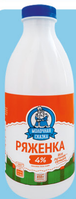
РЯЖЕНКА МОЛОЧНАЯ СКАЗКА, 4%, 850 г