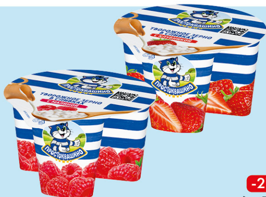
ТВОРОЖНОЕ ЗЕРНО ПРОСТОКВАШИНО, клубника/малина, 5%, 130 г