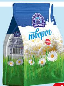
ТВОРОГ ТОМСКОЕ МОЛОКО, 9%, 500 г