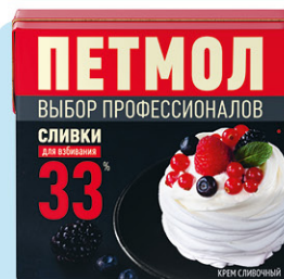
СЛИВКИ ПЕТМОЛ, для взбивания, ультрапастеризованные, 33%, 500 г