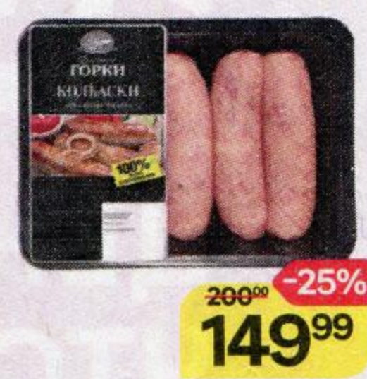
Колбаски БЛИЖНИЕ ГОРКИ Шашлычные, охлажденные, 400 г