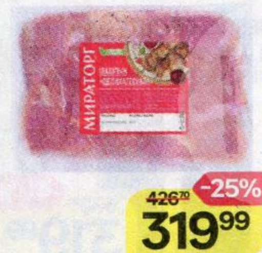
Шашлык МИРАТОРГ , Деликатесный, свиной, охлажденный, 1 кг