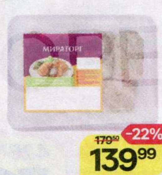
Мини-котлетки МИРАТОРГ с творожным сыром, охлажденные, 380 г