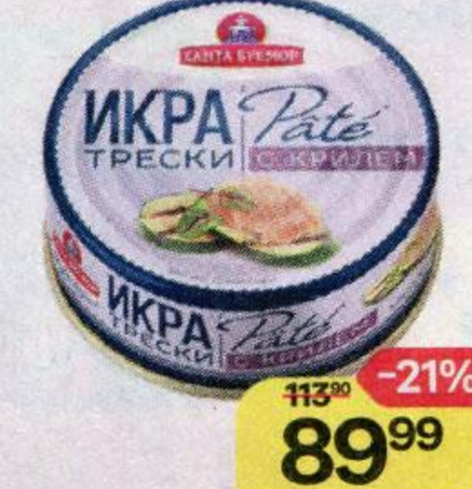
Икра трески САНТА БРЕМОР Патэ, с крилем, 90 г