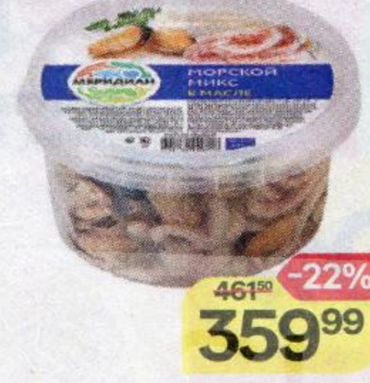
Микс морской МЕРИДИАН , в масле, 430 г