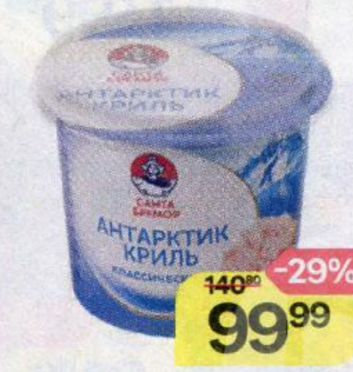
Паста из морепродуктов САНТА БРЕМОР , Антарктик криль, Классическая, 150 г