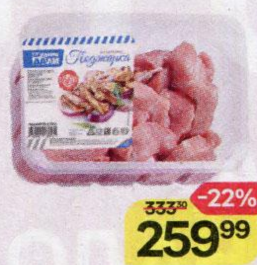
Поджарка ДАЛЬНИЕ ДАЛИ , из свинины, 700 г