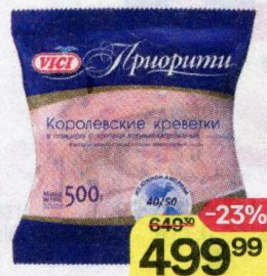
Креветки VICI Приорити, королевские, в панцире, с головой, варено-мороженые, 40/50, 500 г