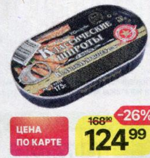
Шпроты ВКУСНЫЕ КОНСЕРВЫ , Классические, в масле, 175 г