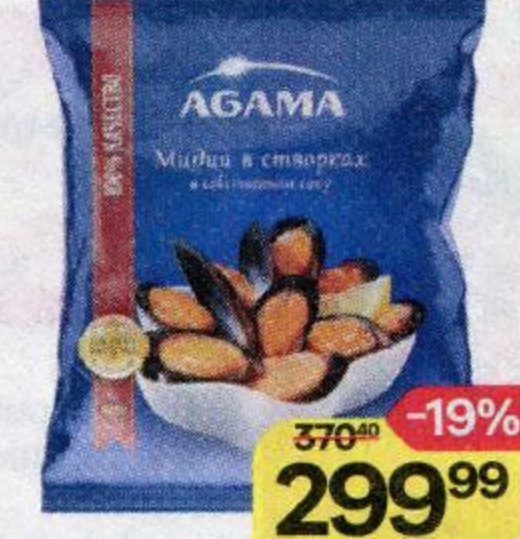
Мидии АГАМА , в створках в собственном соку, варено-мороженые, 450 г