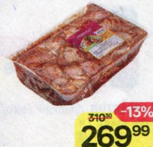
Шашлык МИРАТОРГ , из цыпленка-бройлера, в маринаде, охлажденный, 1 кг