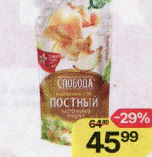
Соус майонезный СЛОБОДА , Постный, 56%, 200 мл