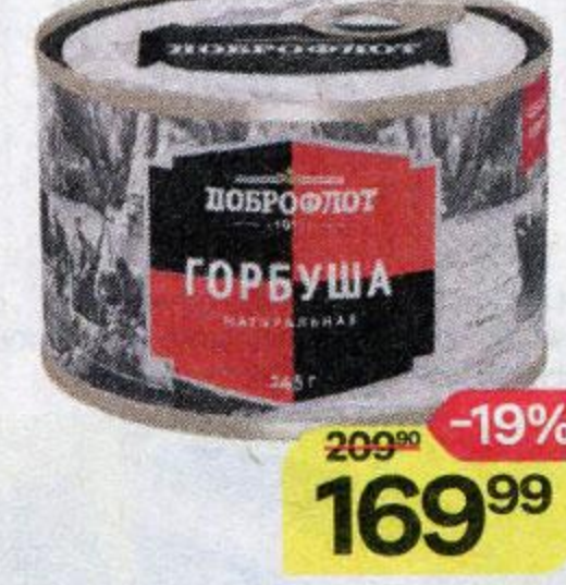
Горбуша ДОБРОФЛОТ , натуральная, 245 г