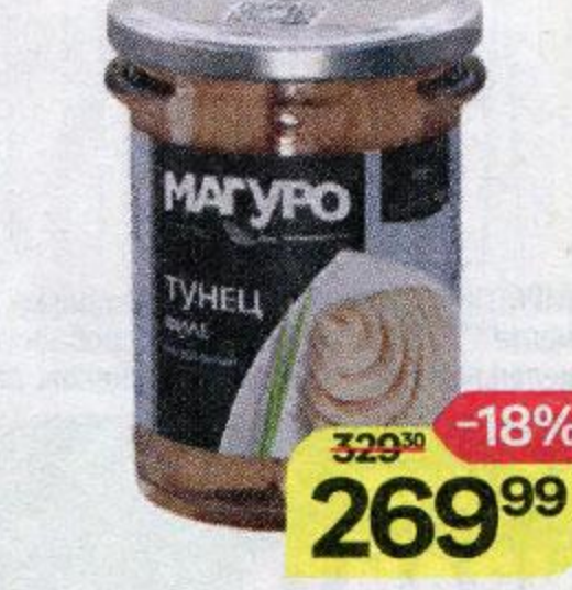
Тунец МАГУРО , Натуральный, филе, 200 г