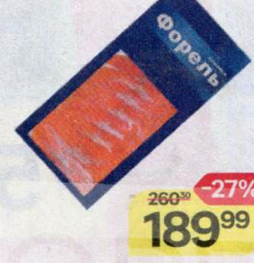
ФОРЕЛЬ , слабосоленая, филе ломтики, нарезка, 100 г