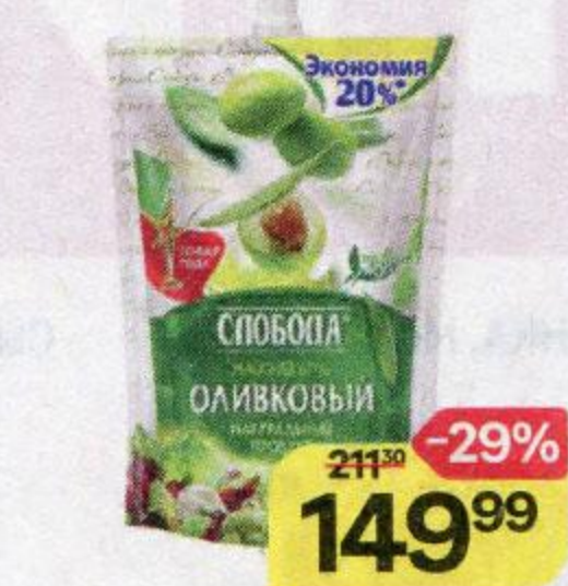
Майонез СЛОБОДА , Оливковый, 67%, 750 г