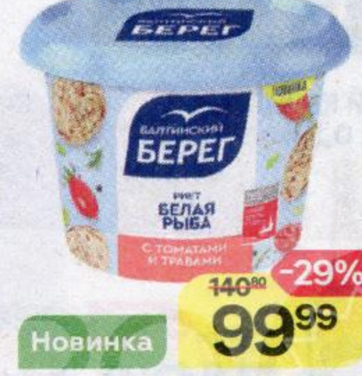
Риет БАЛТИЙСКИЙ БЕРЕГ минтай-белая рыба с томатами и травами, 140 г