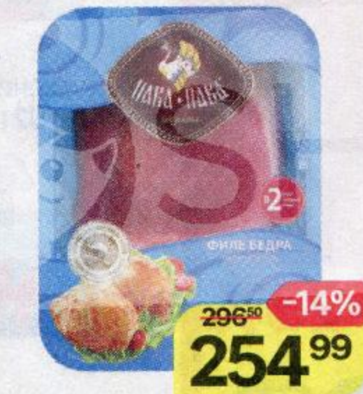
Филе бедра индейки ПАВА-ПАВА охлажденное, 450 г