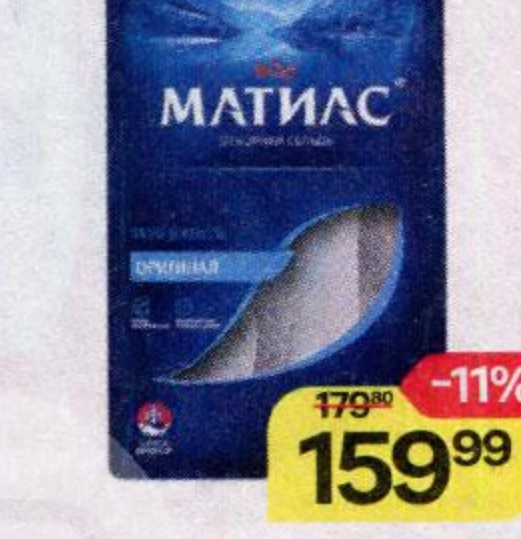
Филе сельди МАТИАС , в масле, Оригинал (Санта Бремор), 250 г