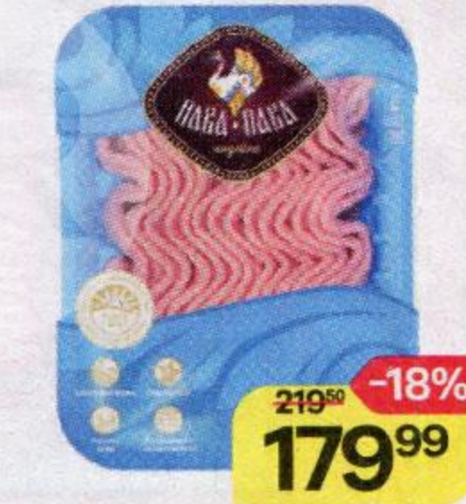
Фарш ПАВА-ПАВА , из индейки, нежный, охлажденный, 450 г