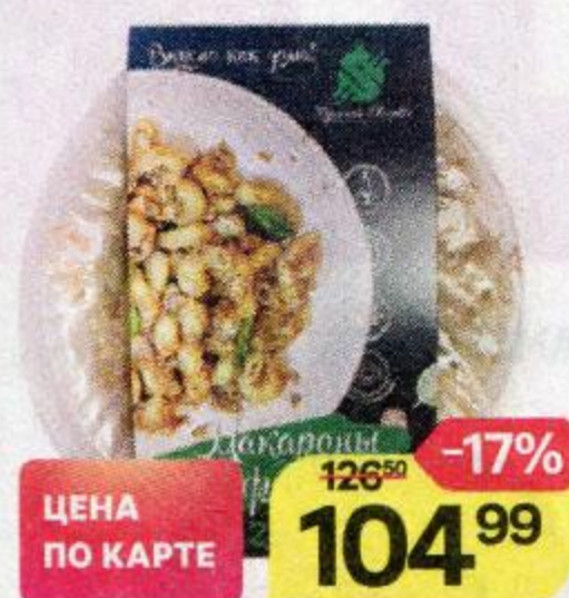
Макароны ТУЛЬСКИЙ ДВОРИК по-флотски, 250 г