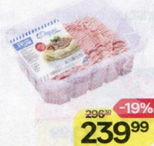
Фарш ДАЛЬНИЕ ДАЛИ , Из свинины, охлажденный, 700 г