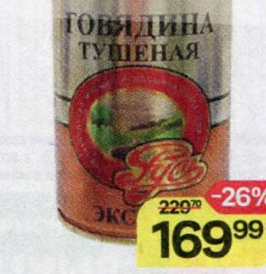
Говядина РУСЬ тушеная, экстра, ГОСТ, 338 г