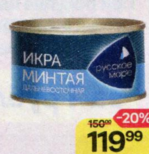
Икра минтая РУССКОЕ МОРЕ , Дальневосточная, Пробойная соленая, 130 г