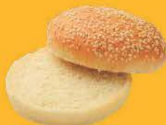
Булочка для бургера