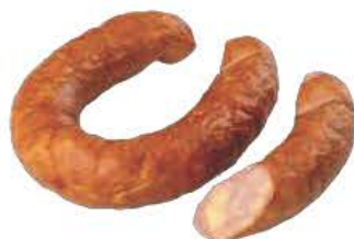
Кабаносси с сыром