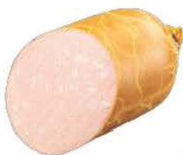
Русская вареная колбаса