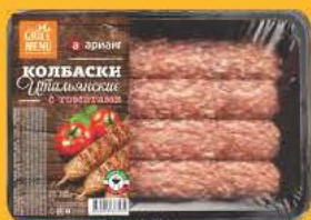
Итальянские колбаски с томатами

Выбирай из широкого ассортимента свежих и качественных товаров в наших магазинах