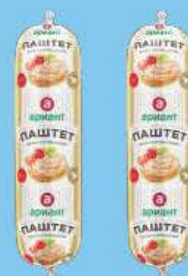
Паштет Мясная Коллекция 200 г