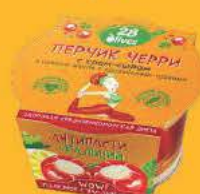
Перчик черри с крем сыром