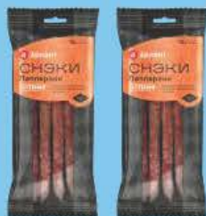
Колбаски Снаки пепперони 100 г