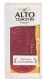
Нарезка Alto concetto