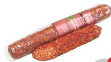
Il gusto perfetto колбаса