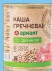
Каша гречневая со свиной ГОСТ 340 г