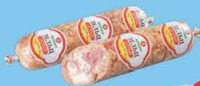
Зельц острый 300 г