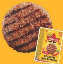
Котлета для Бургера Ола, Амигос!