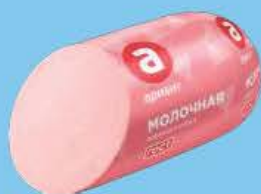
Молочная вареная колбаса ГОСТ, 400 г

Собрать чемодан в отпуск и собрать походный рюкзак — не одно и то же. В походах бывает привал, костер и еда с дымком. В наших магазинах есть все, что для этого нужно!