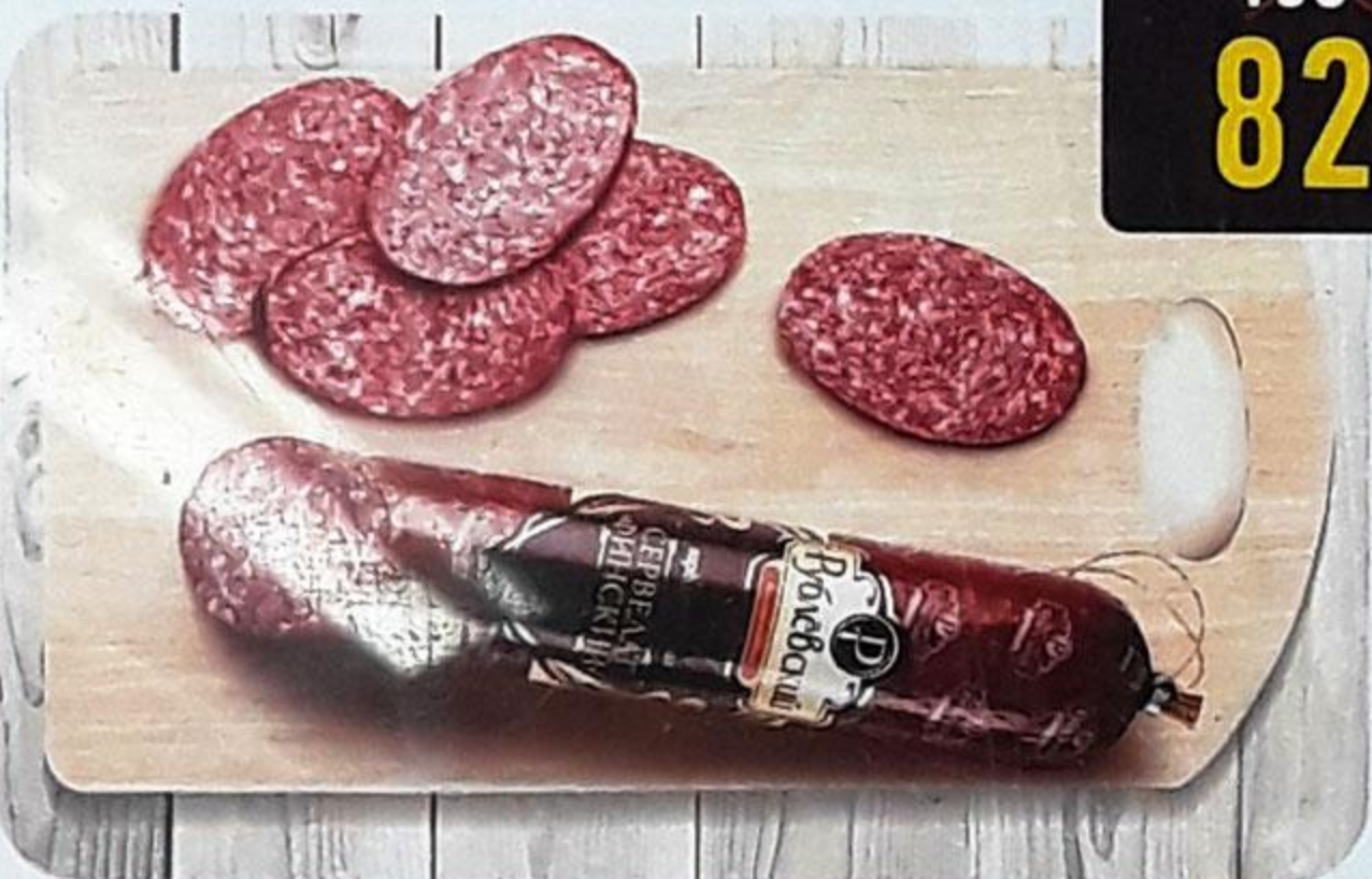
КОЛБАСА «СЕРВЕЛАТ ФИНСКИЙ» варёно-копчёная