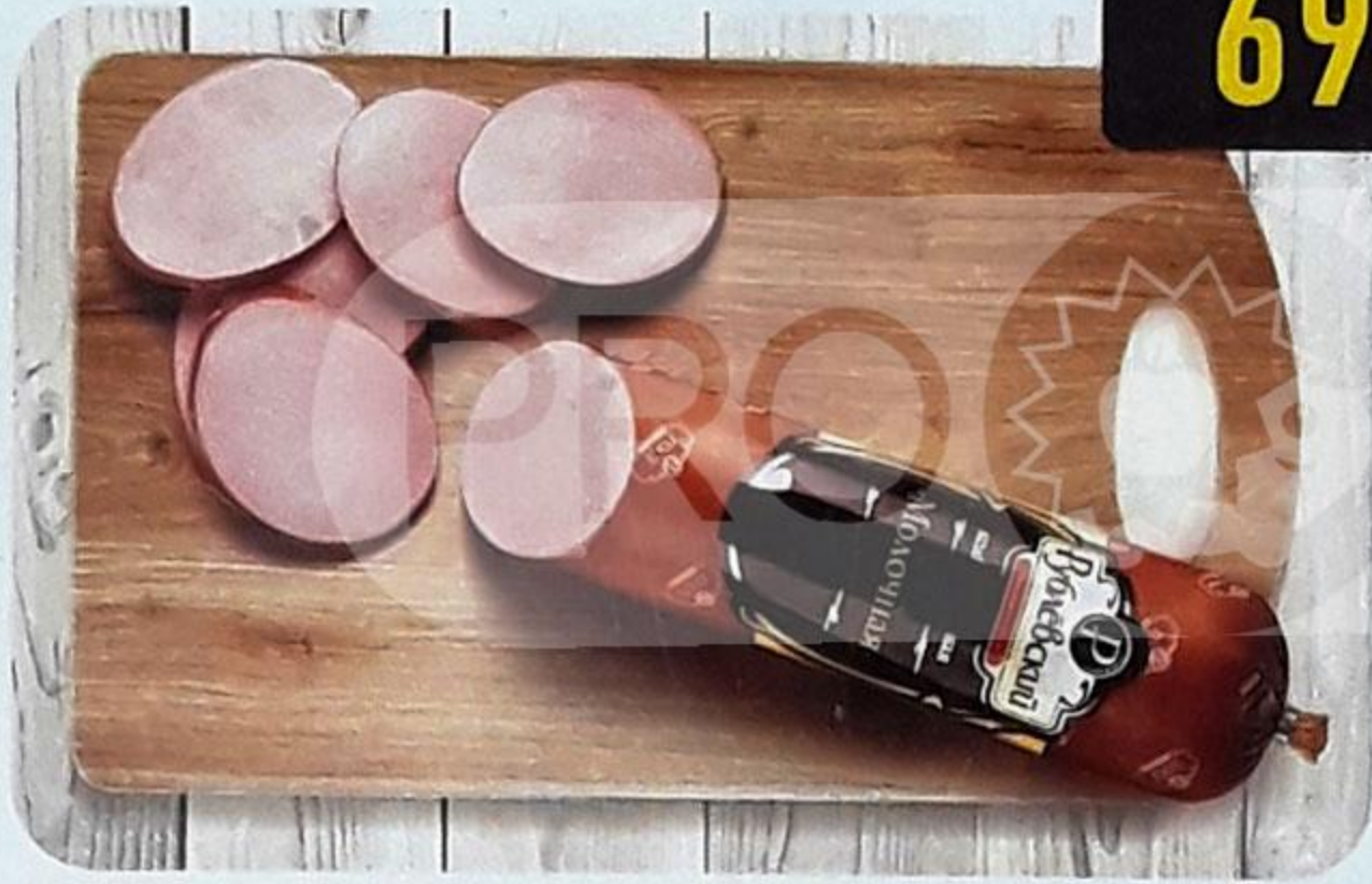
КОЛБАСА «МОЛОЧНАЯ» варёная, в белкозине