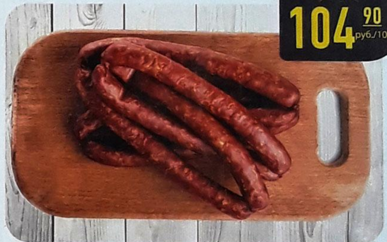
КОЛБАСКИ «ЕГЕРСКИЕ С СЫРОМ»