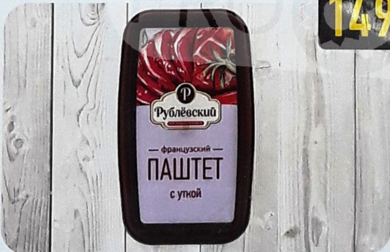
ПАШТЕТ «ФРАНЦУЗСКИЙ» с уткой