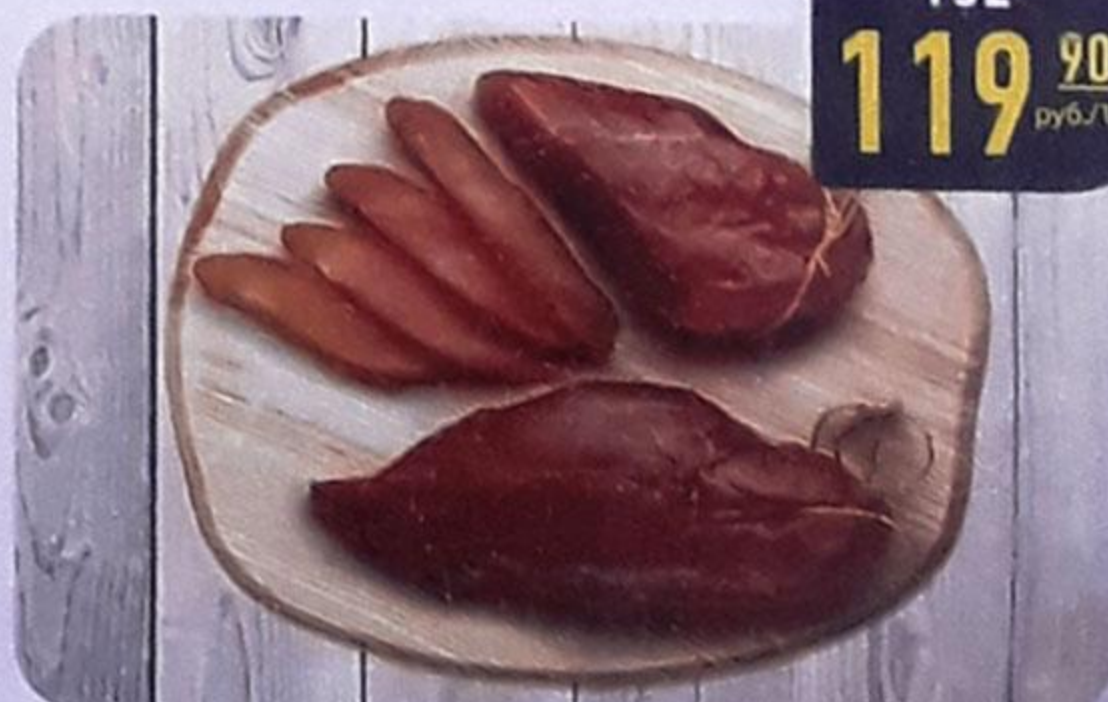
КАРПАЧО ИЗ МЯСА ПТИЦЫ сырокопчёное