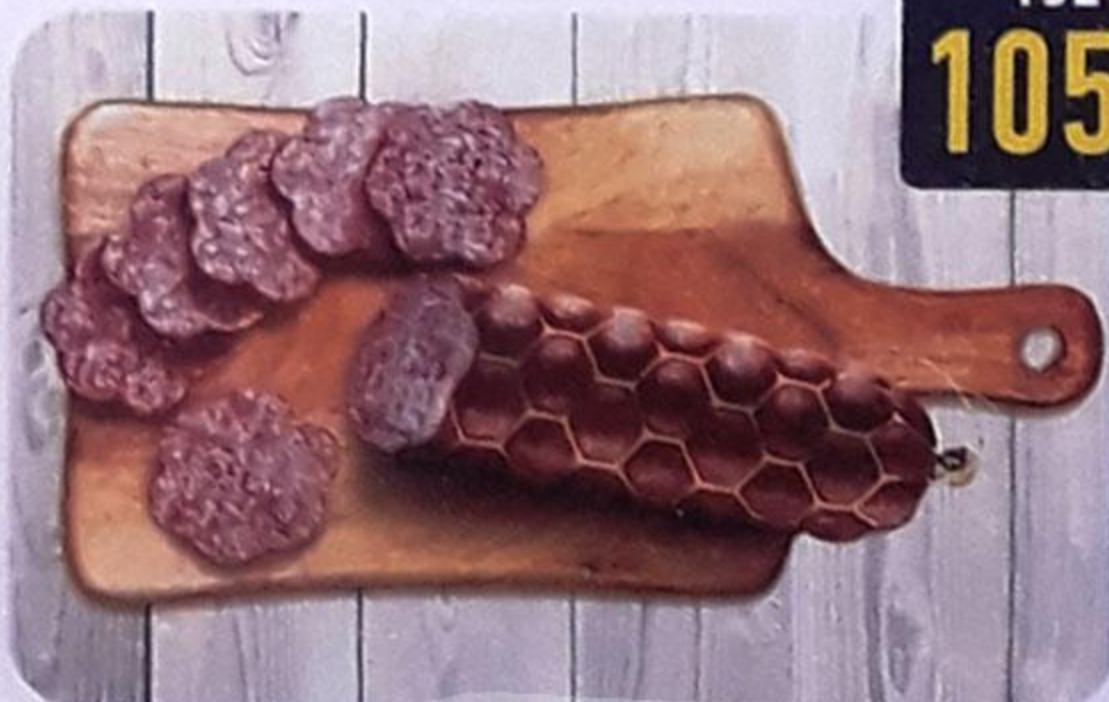
КОЛБАСА «СЕРВЕЛАТ ОРЕХОВЫЙ» варёно-копчёная