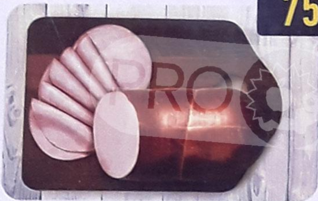
КОЛБАСА «ДОКТОРСКАЯ» варёная, в синюге