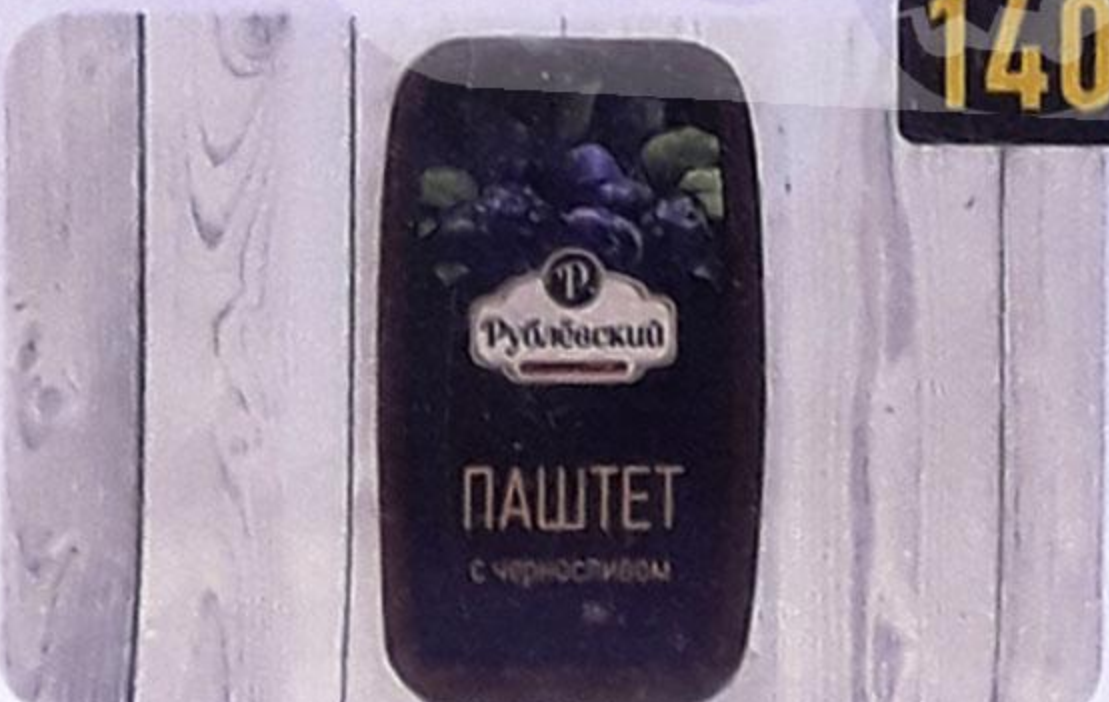
ПАШТЕТ С ЧЕРНОСЛИВОМ