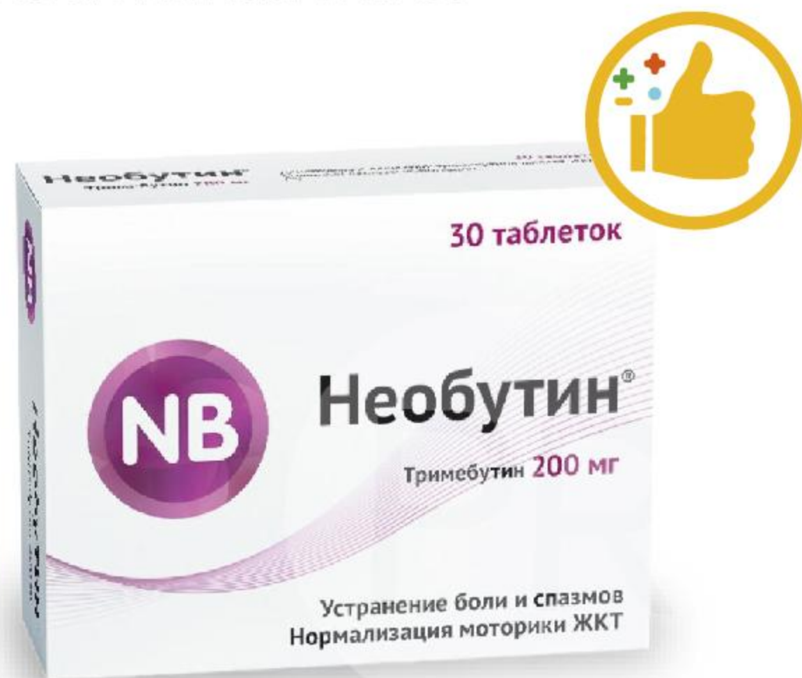
НЕОБУТИН 200МГ №30