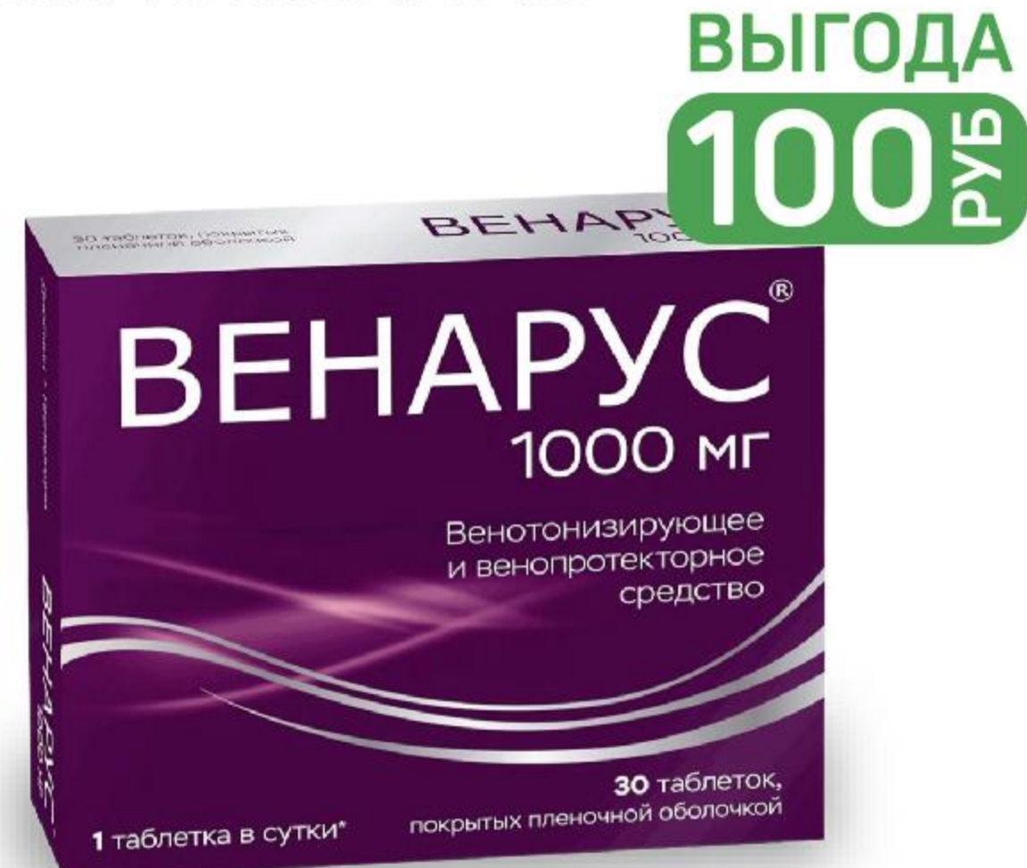
ВЕНАРУС 1000МГ №30