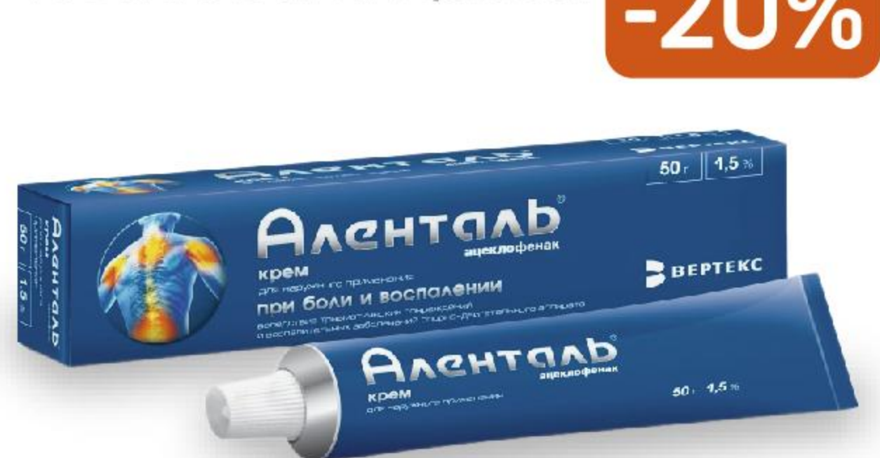
АЛЕНТАЛЬ КРЕМ 1,5% 50Г