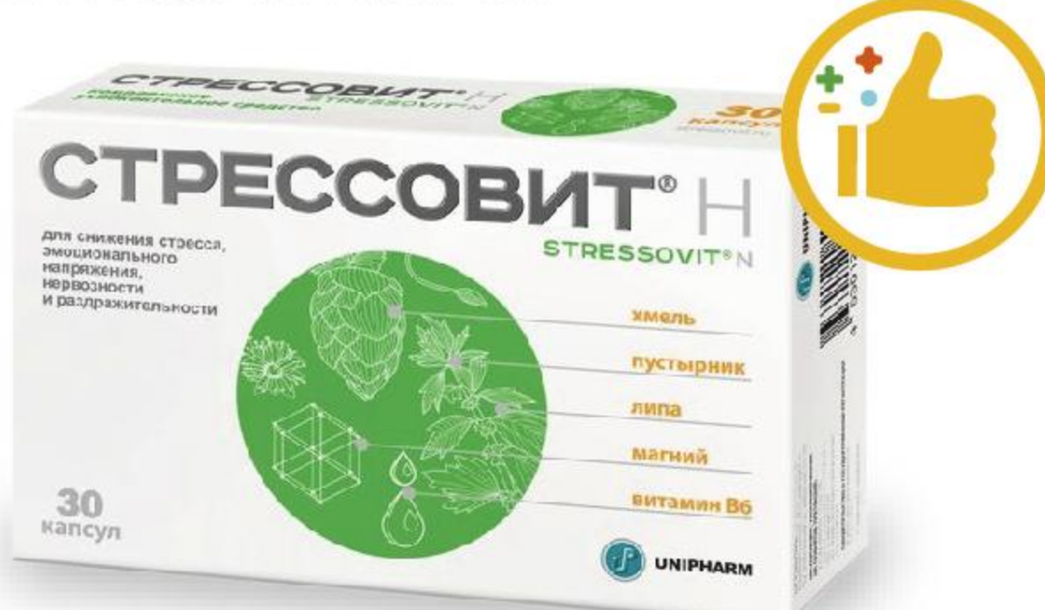
СТРЕССОВИТ Н №30