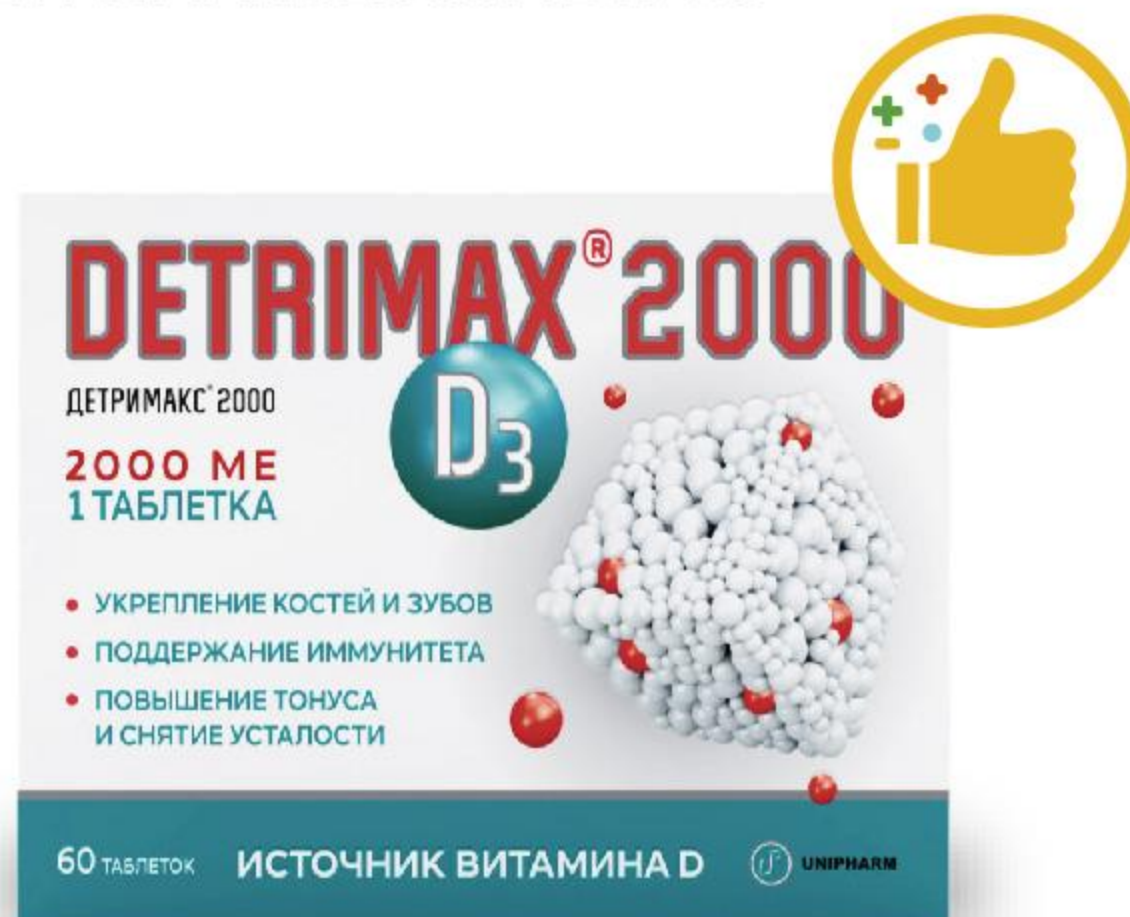
ДЕТРИМАКС 2000МЕ №60