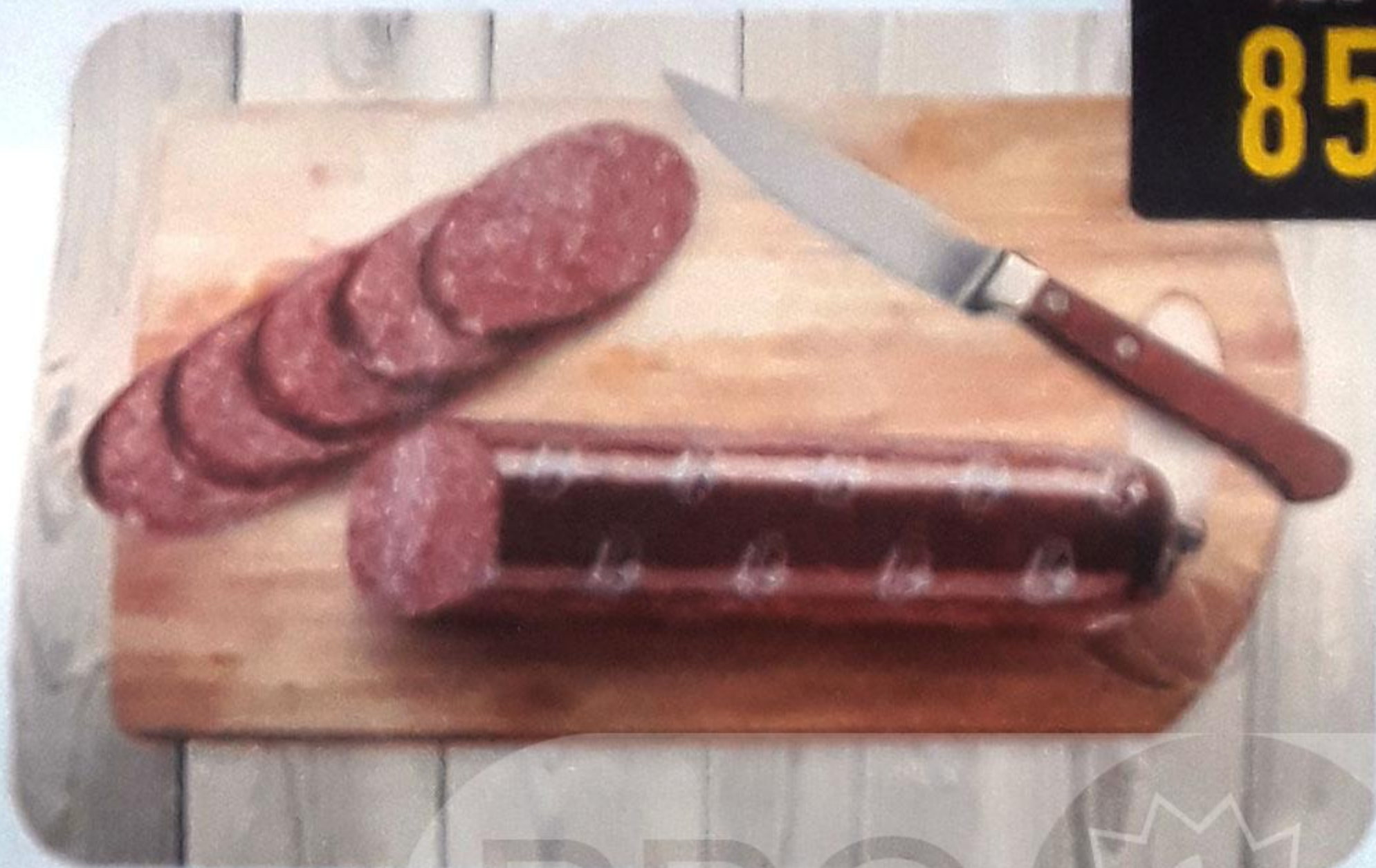
КОЛБАСА «СЕРВЕЛАТ» варёно-копчёная