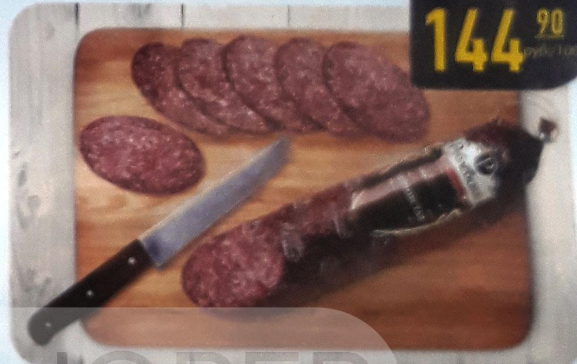
КОЛБАСА «ЗЕРНИСТАЯ» сырокопчёная