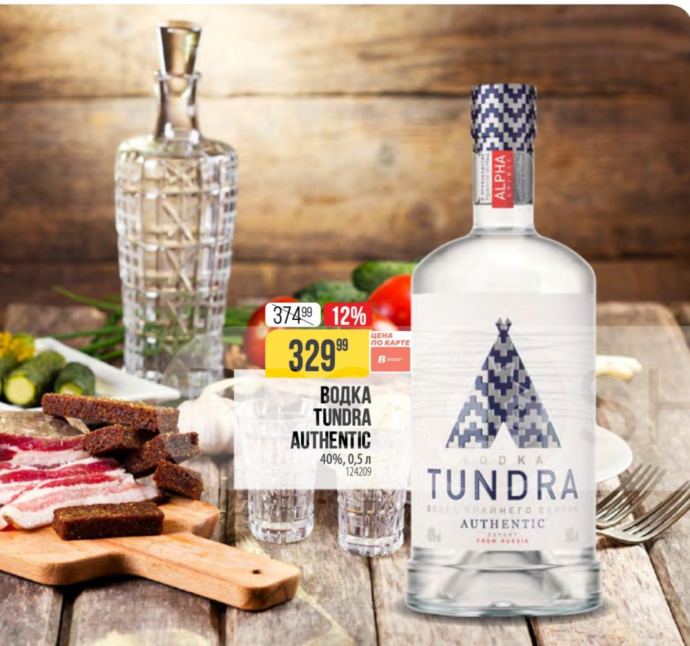
ВОДКА TUNDRA AUTHENTIC 40%, 0,5 л 124209