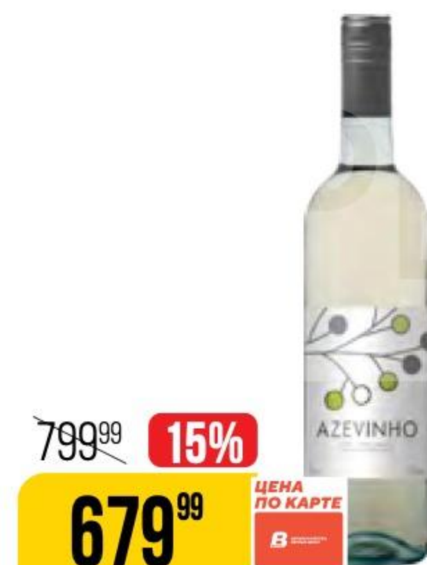
ВИНО AZEVINHO vinho verde branco, белое, полусухое, 10%, 0,75 л 160994