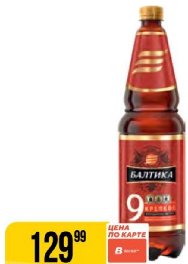
ПИВО БАЛТИКА №9 легендарное, крепкое, светлое, 8%, 1,3 л 173671