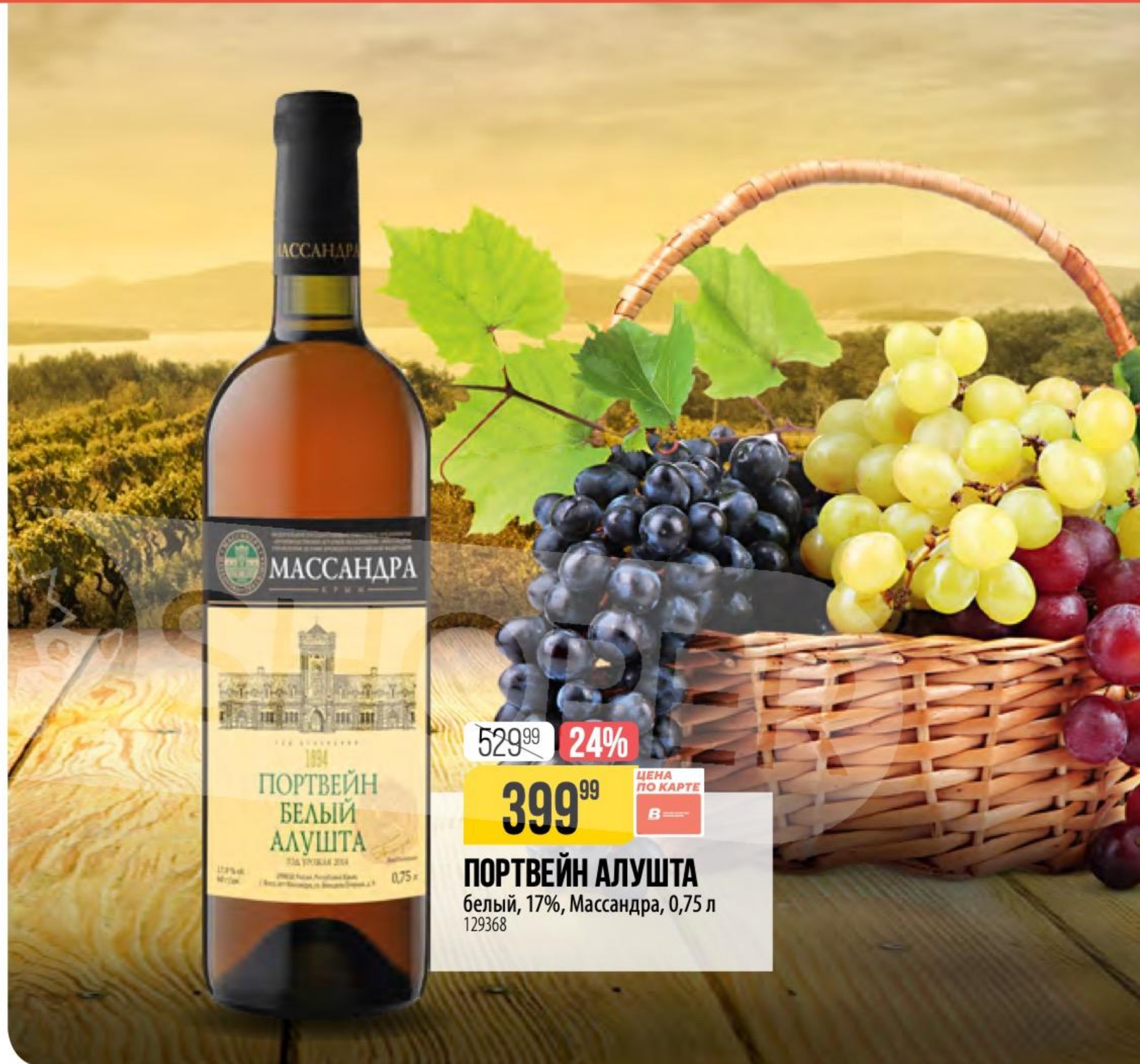
ПОРТВЕЙН АЛУШТА белый, 17%, Массандра, 0,75 л 129368