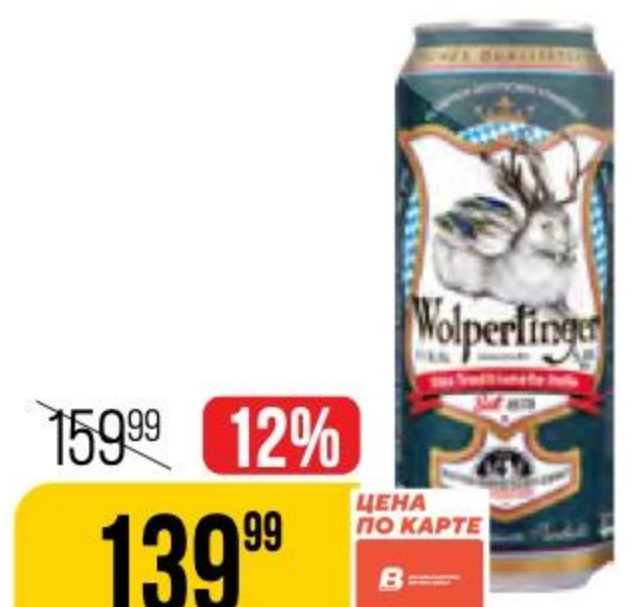
ПИВО WOLPERTINGER традиционное, светлое, 5%, 0,5 л 170288