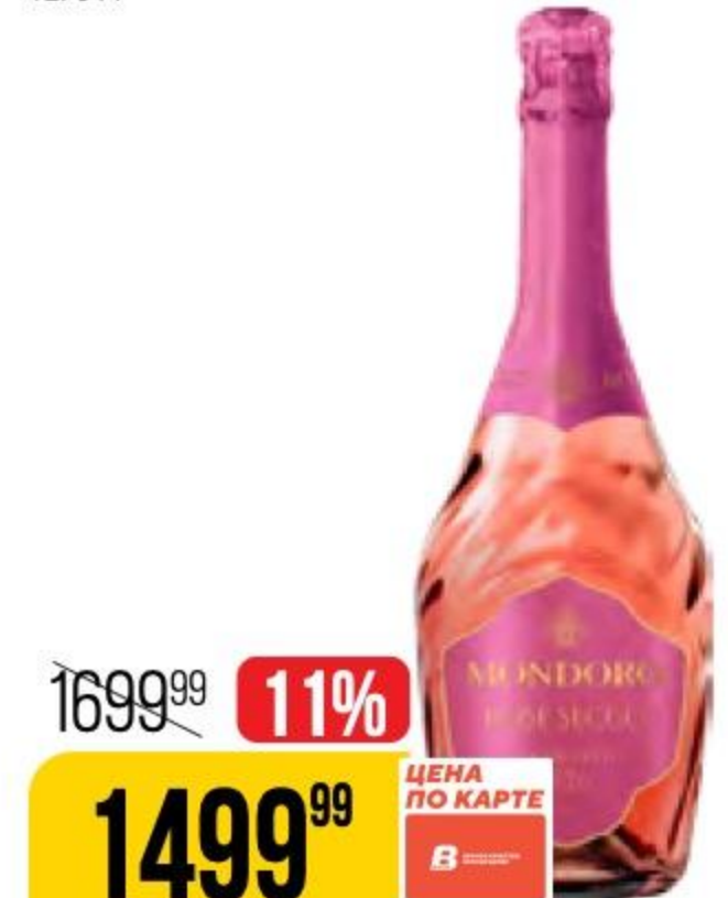
ВИНО ИГРИСТОЕ MONDORO rose secco, розовое, сухое, 11,5%, 0,75 л 187925

ЧРЕЗМЕРНОЕ УПОТРЕБЛЕНИЕ АЛКОГОЛЯ ВРЕДИТ ВАШЕМУ ЗДОРОВЬЮ