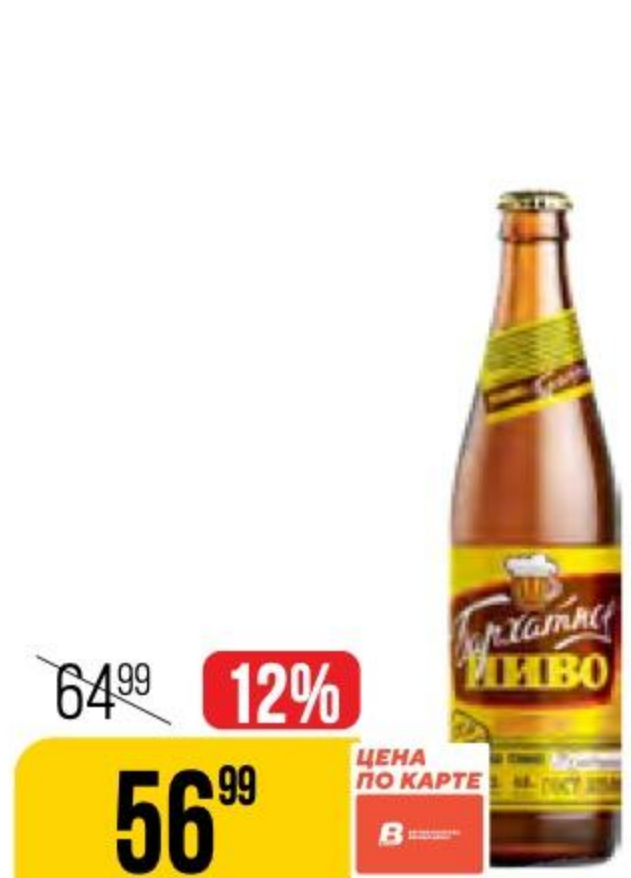
ПИВО ТРЕХОСЕНСКОЕ бархатное, темное, 4,6%, 0,45 л 171904