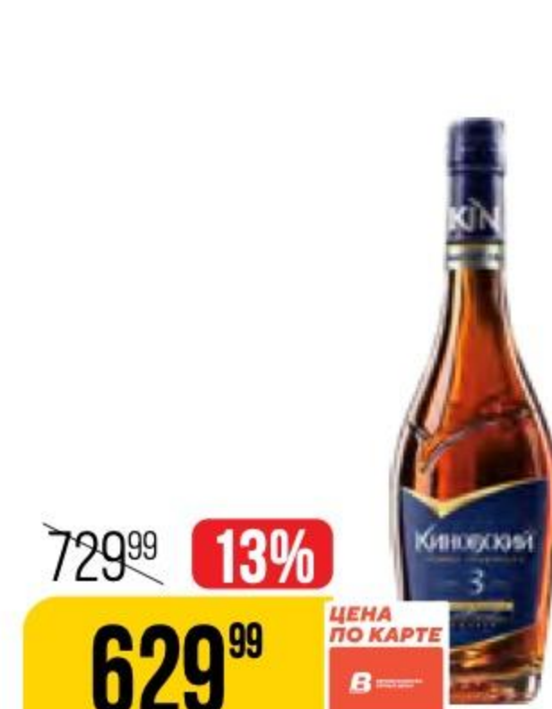
КОНЬЯК КИНОВСКИЙ 3 года, 40%, 0,5 л 123149