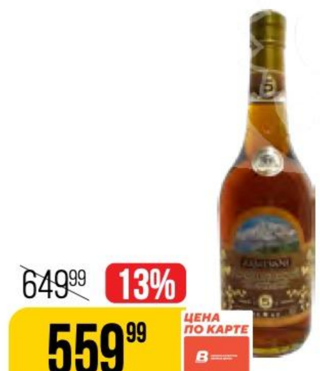
КОНЬЯК ARMEVANI армянский, ординарный, 5 лет, 40%, 0,5 л 186412