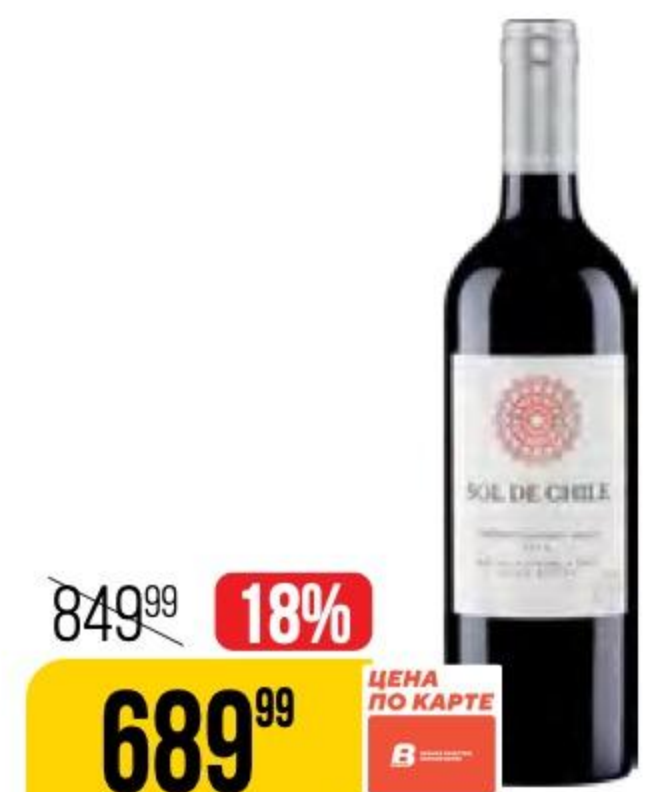
ВИНО SOL DE CHILE cabernet sauvignon merlot, красное, сухое, 8-13%, 0,75 л 127644