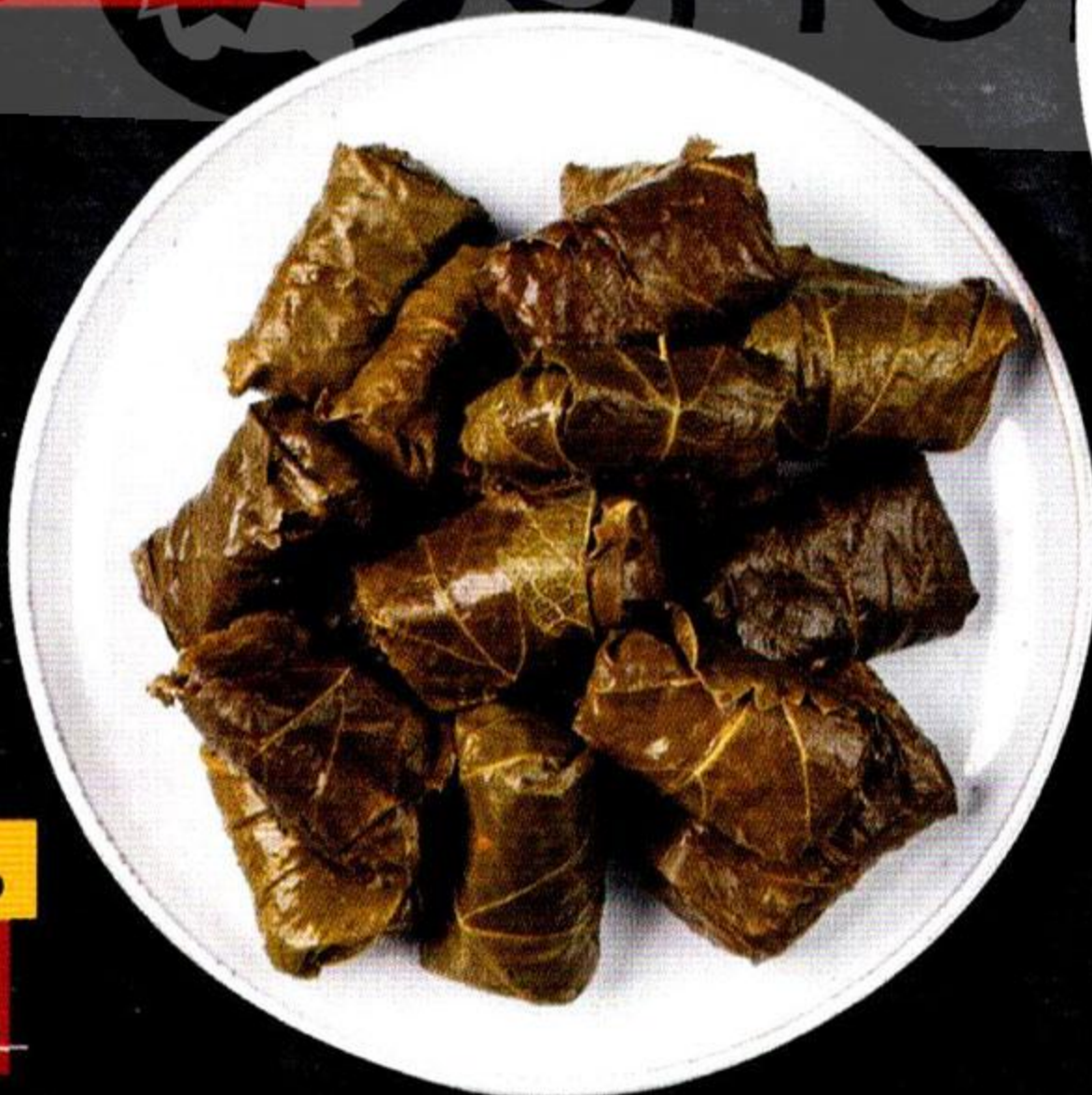
Долма говяжья, охлажденная, весовая, 1 кг