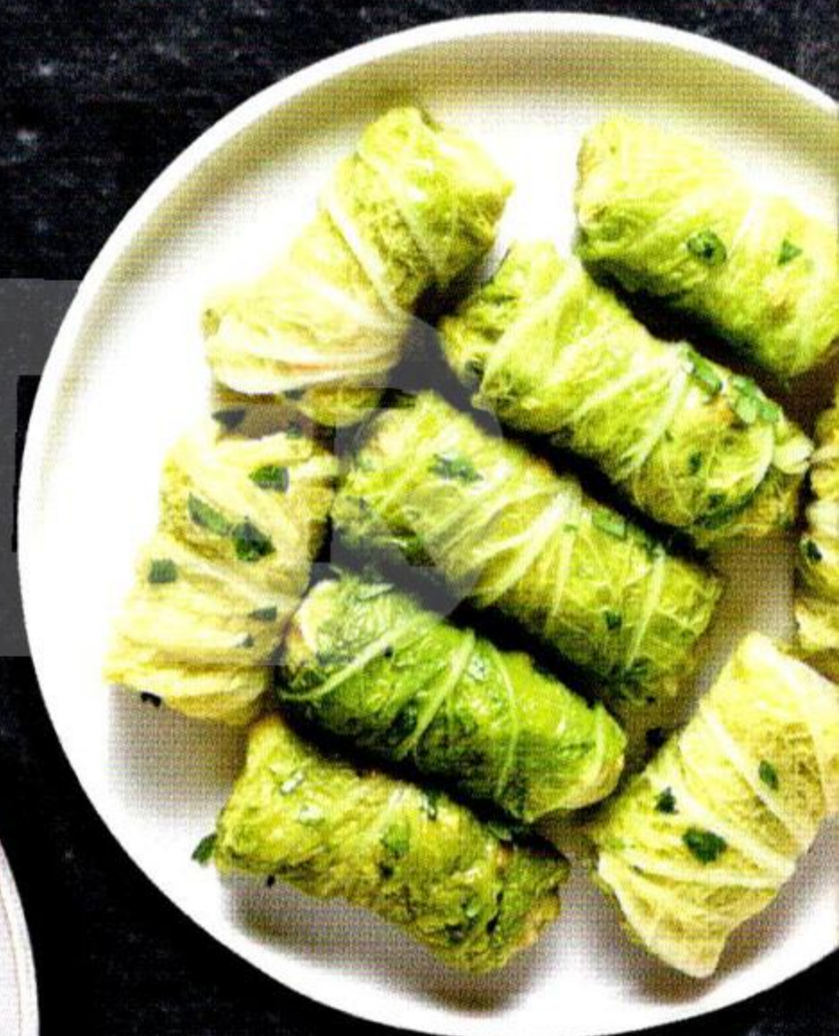
Голубцы фаршированные, из мяса говядины, охлажденные, весовые, 1 кг