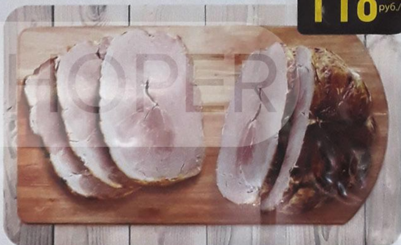
БУЖЕНИНА «РУБЛЁВСКАЯ» запечённая