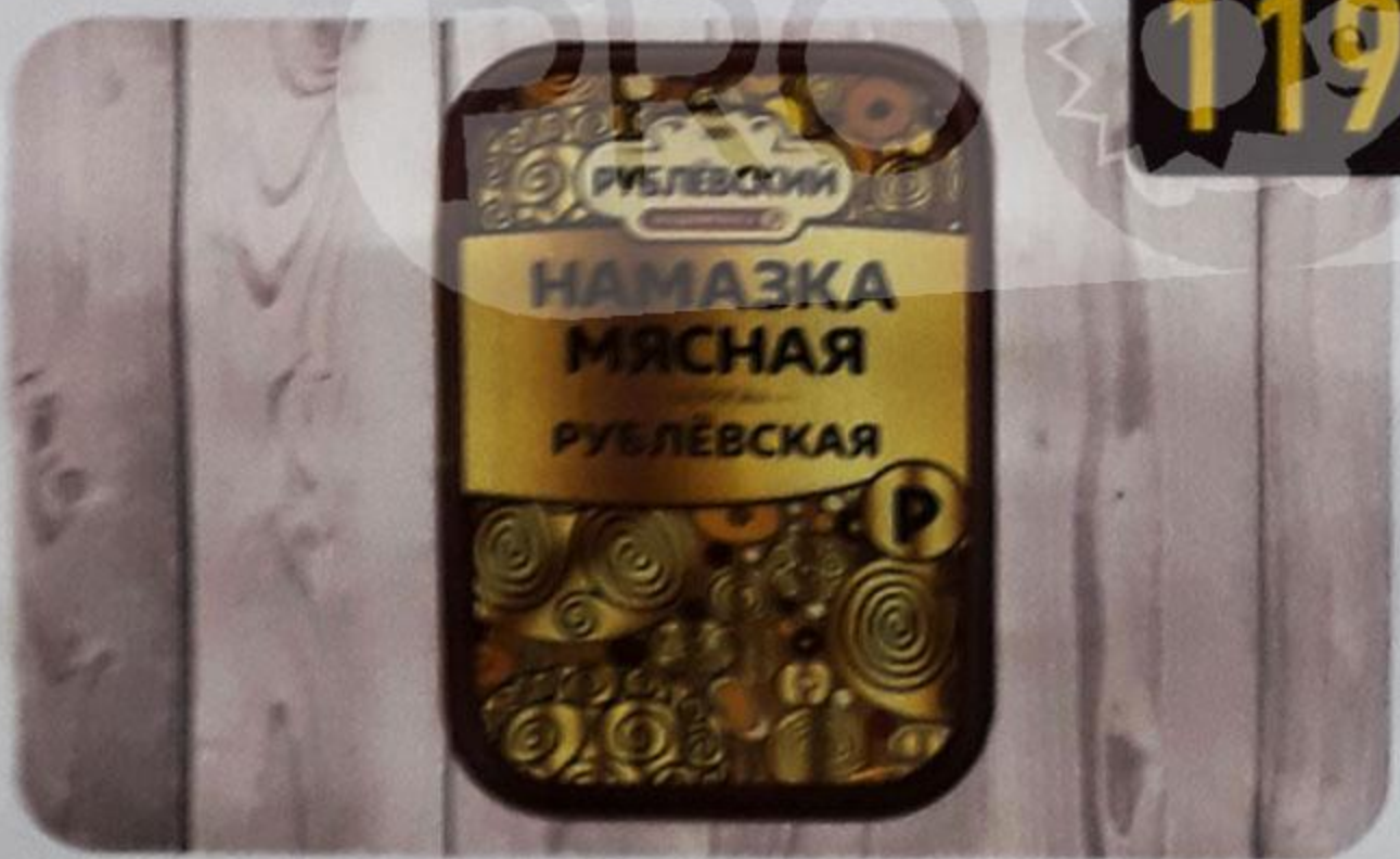
НАМАЗКА «РУБЛЁВСКАЯ» мясная