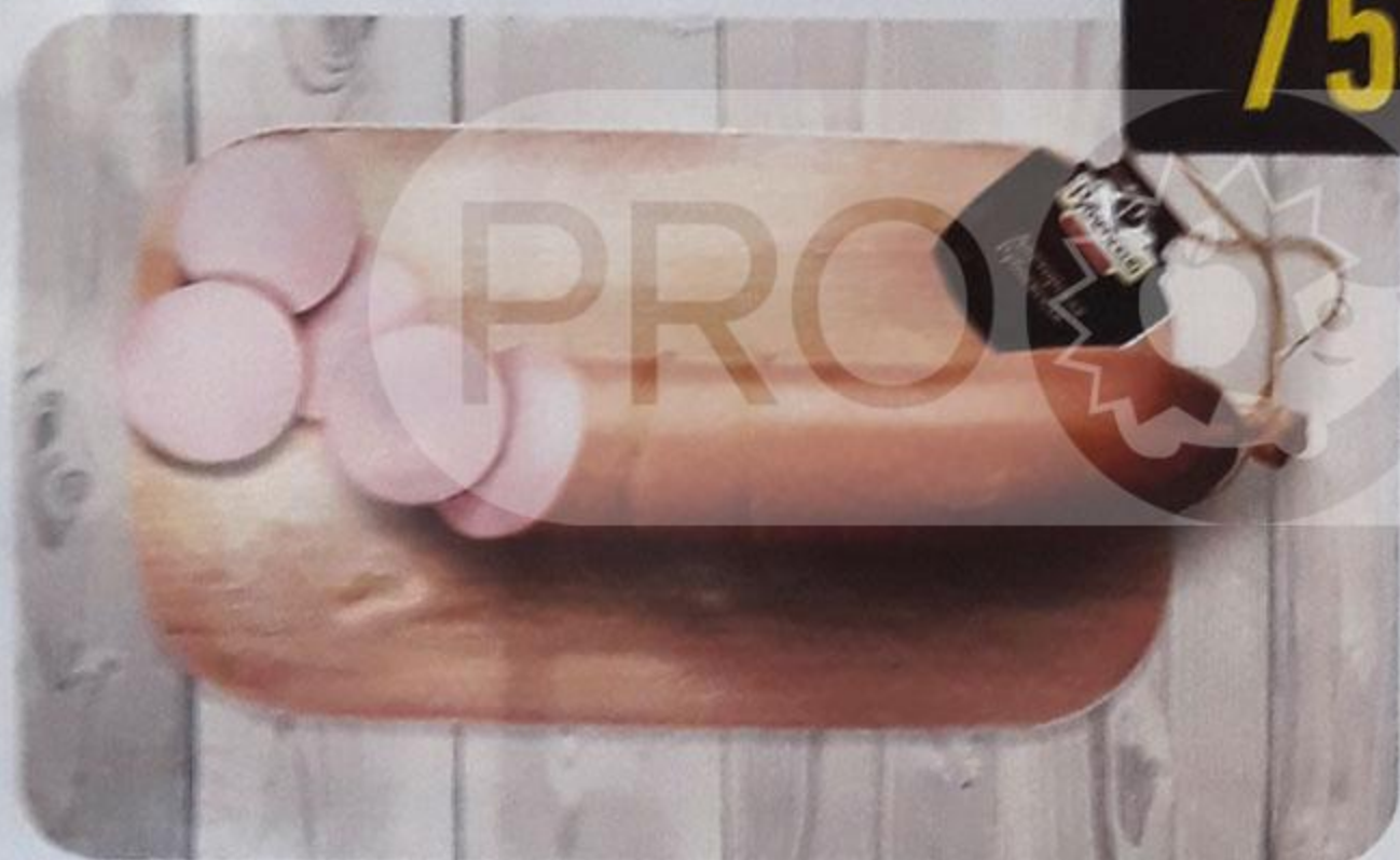
КОЛБАСА «ДОКТОРСКАЯ РУБЛЁВСКАЯ» варёная, в н/о