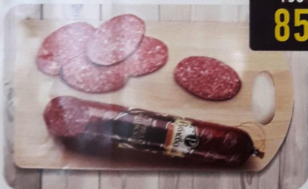
КОЛБАСА «СЕРВЕЛАТ ФИНСКИЙ» варёно-копчёная