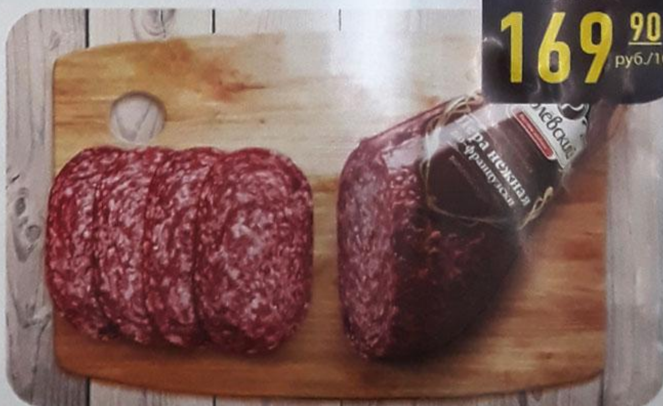
«ПЕРА НЕЖНАЯ ПО-ФРАНЦУЗСКИ» сырокопчёная