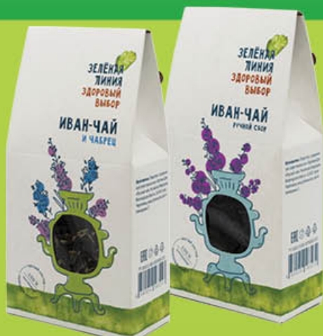
Напиток чайный ЗЕЛЕНАЯ ЛИНИЯ Иван-чай ферментированный; Иван-чай и чабрец, 60 г