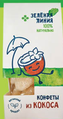
Конфеты ЗЕЛЕНАЯ ЛИНИЯ из кокоса, 90 г