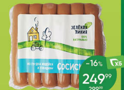
Сосиски ЗЕЛЕНАЯ ЛИНИЯ из грудки индейки и говядины, 240 г