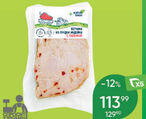
Ветчина ЗЕЛЕНАЯ ЛИНИЯ из грудки индейки с паприкой варёная, 100 г