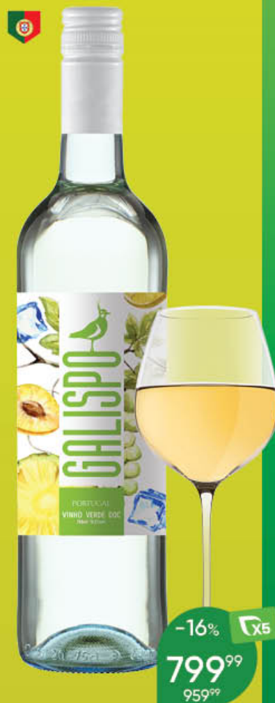
Вино GALISPO ординарное белое полусухое 10,5%, 0,75 л (Португалия)

Классическое португальское Вино Верде с лёгкой сладостью во вкусе для тех, кто хочет лёгкой трапезы с вином и ягодами.