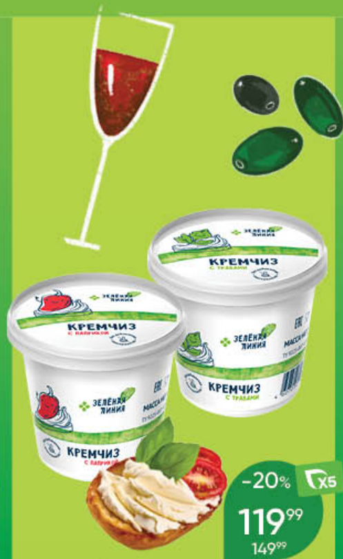
Кремчиз ЗЕЛЕНАЯ ЛИНИЯ мягкий сливочный с травами; сливочный с паприкой, 70%; 140 г