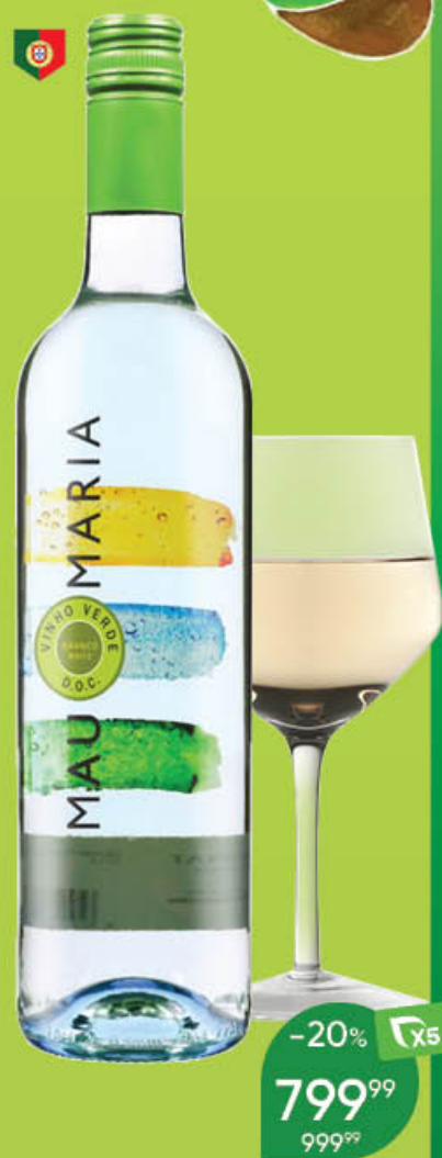
Вино MAU MARIA DOC Vinho Verde белое полусухое 10,5%, 0,75 л (Португалия)

Лёгкое вино на каждый день. В аромате присутствуют нотки тропических фруктов, белых цветов и цитрусовых.