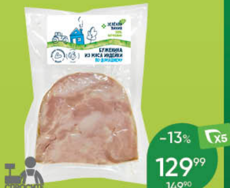
Буженина ЗЕЛЕНАЯ ЛИНИЯ По-домашнему из мяса индейки варёно-копчёная, 100 г