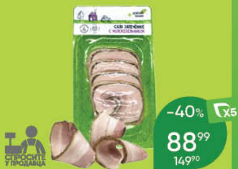
Сало ЗЕЛЕНАЯ ЛИНИЯ запечённое, с можжевельником, 100 г