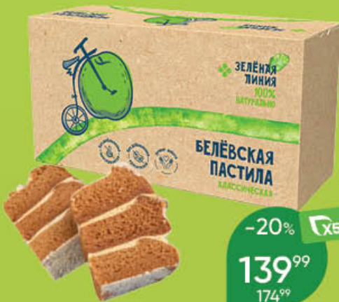
Пастила ЗЕЛЕНАЯ ЛИНИЯ Белёвская классическая, 180 г