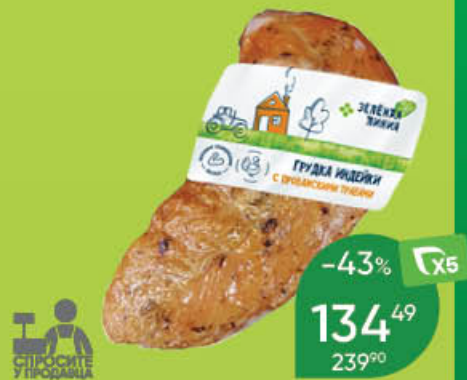
Грудка индейки ЗЕЛЕНАЯ ЛИНИЯ с прованскими травами, варёно-копчёная, 100 г