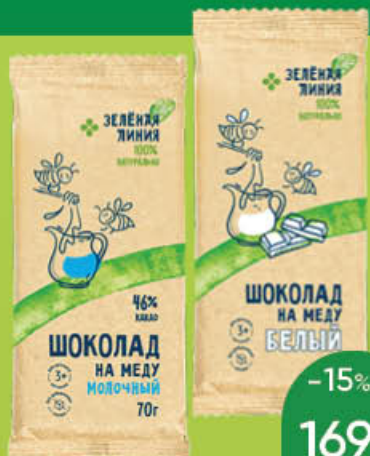
Шоколад ЗЕЛЕНАЯ ЛИНИЯ молочный; белый, на меду, 70 г