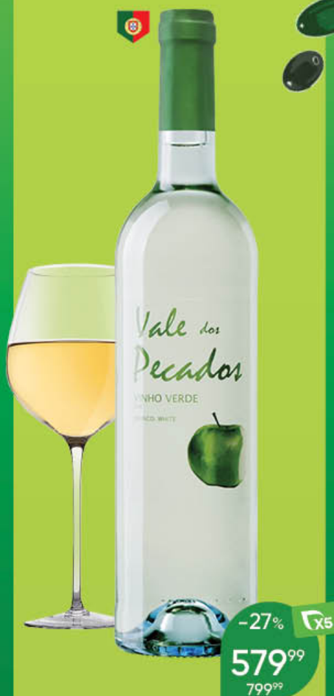
Вино VALE DOS PECADOS Vinho Verde белое полусухое 10,5%, 0,75 л (Португалия)

Освежающее вино светлого лимонного цвета со слегка покалывающими пузырьками. В нежном аромате раскрываются оттенки цедры лимона, папайи и барбариса. Лёгкое, живое и гармоничное, с чуть сладковатыми нотками в послевкусии.