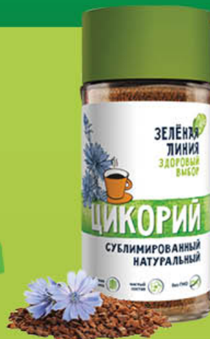
Цикорий ЗЕЛЕНАЯ ЛИНИЯ натуральный растворимый сублимированный, 85 г