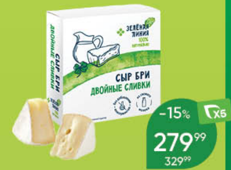
Сыр ЗЕЛЕНАЯ ЛИНИЯ Бри мягкий, с двойными сливками, 65%, 150 г