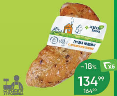
Грудка индейки ЗЕЛЕНАЯ ЛИНИЯ с прованскими травами, варёно-копчёная, 100 г