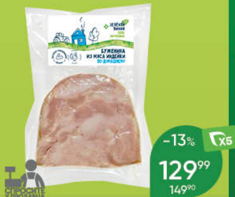
Буженина ЗЕЛЕНАЯ ЛИНИЯ По-домашнему из мяса индейки варёно-копчёная, 100 г