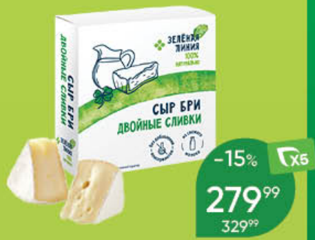
Сыр ЗЕЛЕНАЯ ЛИНИЯ Бри мягкий, с двойными сливками, 65%, 150 г