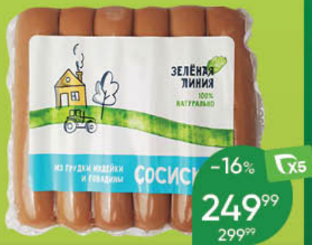
Сосиски ЗЕЛЕНАЯ ЛИНИЯ из грудки индейки и говядины, 240 г