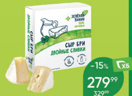
Сыр ЗЕЛЕНАЯ ЛИНИЯ Бри мягкий, с двойными сливками, 65%, 150 г