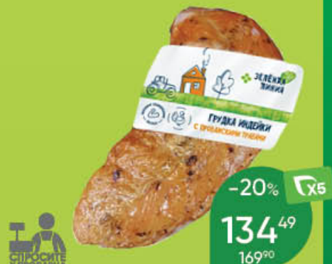
Грудка индейки ЗЕЛЕНАЯ ЛИНИЯ с прованскими травами, варёно-копчёная, 100 г