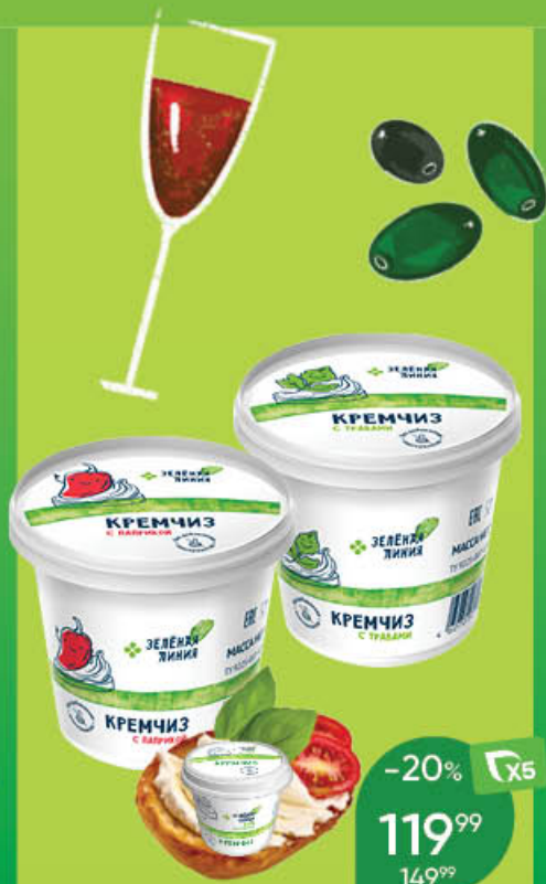
Кремчиз ЗЕЛЕНАЯ ЛИНИЯ мягкий сливочный; сливочный с травами; сливочный с паприкой, 70%; 140 г