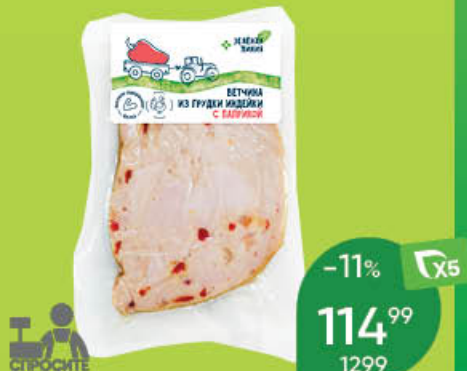
Ветчина ЗЕЛЕНАЯ ЛИНИЯ из грудки индейки с паприкой варёная, 100 г