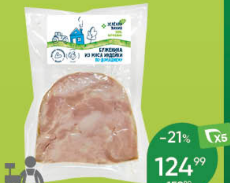
Буженина ЗЕЛЕНАЯ ЛИНИЯ По-домашнему из мяса индейки варёно-копчёная, 100 г