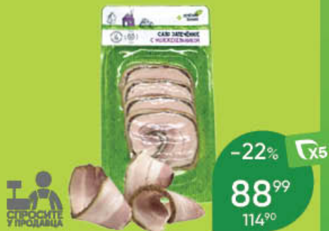
Сало ЗЕЛЕНАЯ ЛИНИЯ запечённое, с можжевельником, 100 г