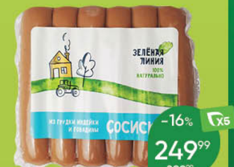
Сосиски ЗЕЛЕНАЯ ЛИНИЯ из грудки индейки и говядины, 240 г