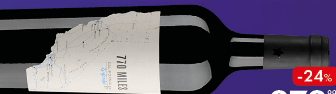
ВИНО 770 MILES ЗИНФАНДЕЛЯ, красное сухое, 0,75 л, Франция