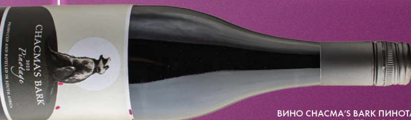
ВИНО СНАСМА'S BARK ПИНОТАЖ, красное сухое, 0,75 л, ЮАР