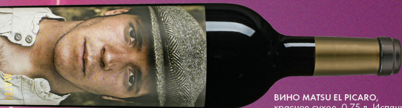
ВИНО MATSU EL PICARO, красное сухое, 0,75 л, Испания