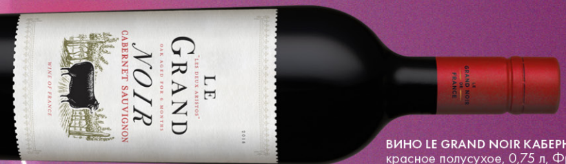
ВИНО LE GRAND NOIR КАБЕРНЕ СОВИЬОН, красное полусухое, 0,75 л, Франция