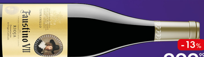
ВИНО FAUSTINO VII ТЕМПРАНИЛЬО, выдержанное, красное сухое, 0,75 л, Испания