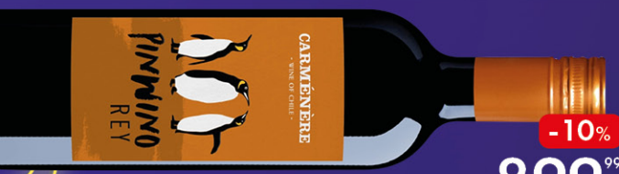
ВИНО PINWINO REY КАРМЕНЕРА, красное сухое, 0,75 л, Чили