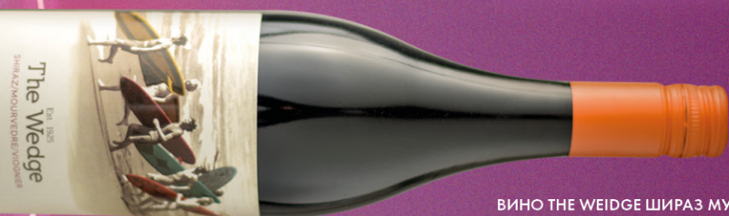
ВИНО THE WEIDGE ШИРАЗ МУРВЕДР ВИОНЬЕ, красное сухое, 0,75 л, ЮАР