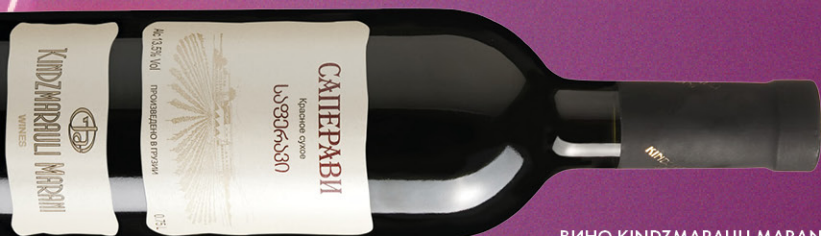
ВИНО KINDZMARAU LI MARANI САПЕРАВИ, красное сухое, 0,75 л, Грузия