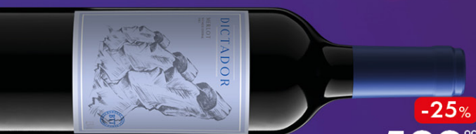
ВИНО DICTATOR МЕРЛО, красное сухое, 0,75 л, Чили