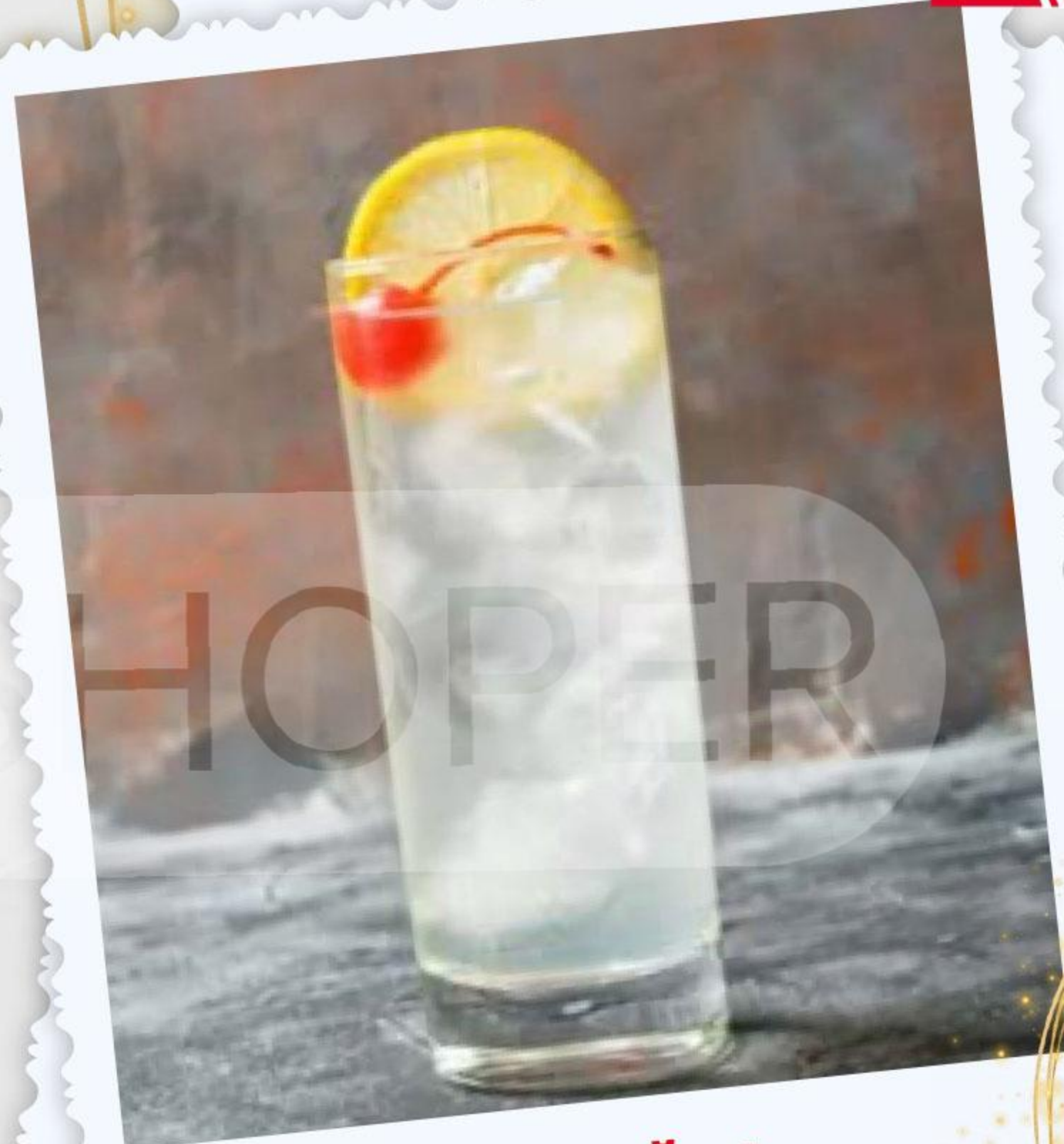
КОКТЕЙЛЬ «ДЖОН КОЛЛИНС»