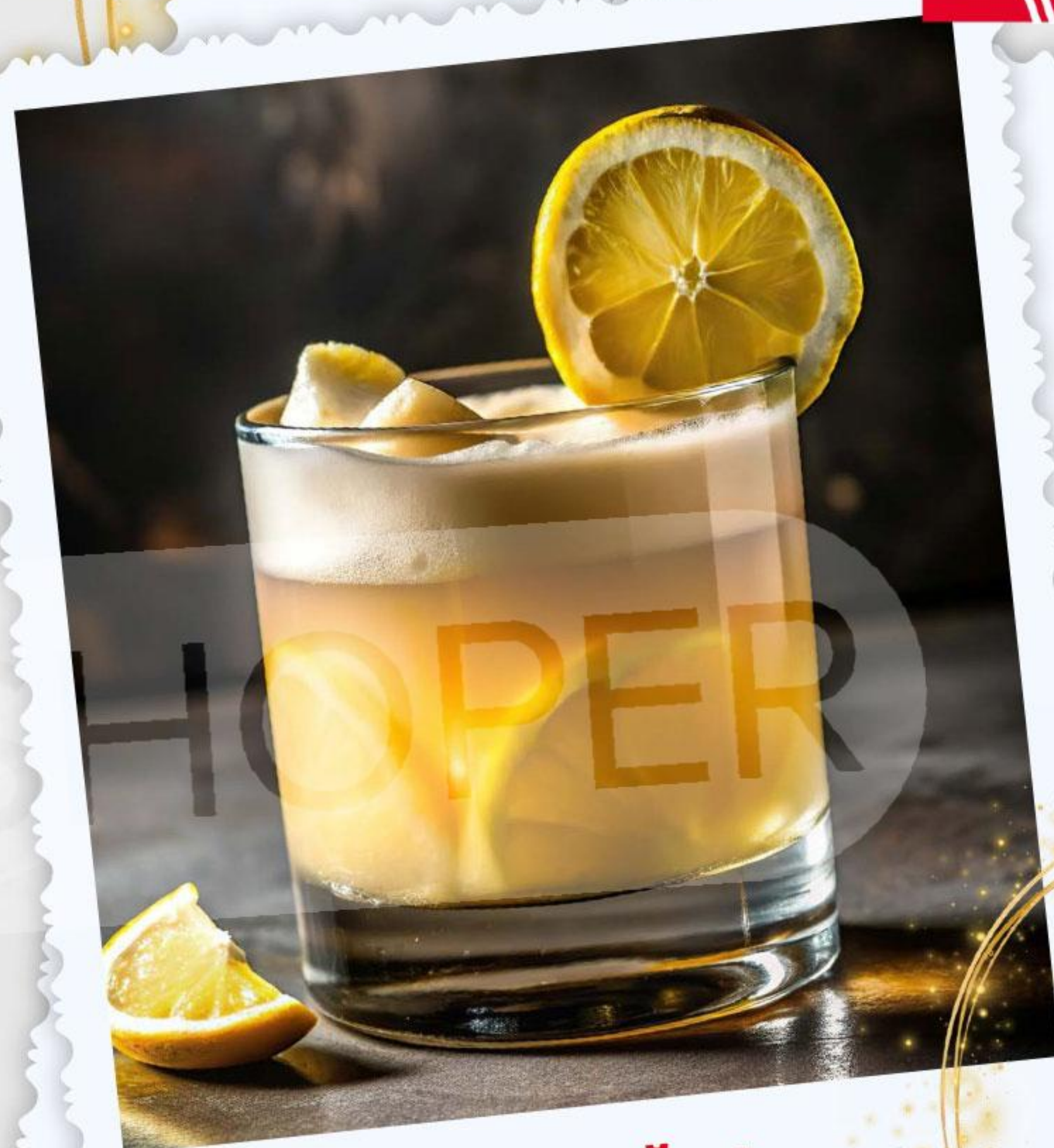
КОКТЕЙЛЬ «ВИСКИ САУЭР»