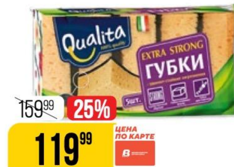
ГУБКИ КУХОННЫЕ EXTRA STRONG Qualita, 5 шт. 142625