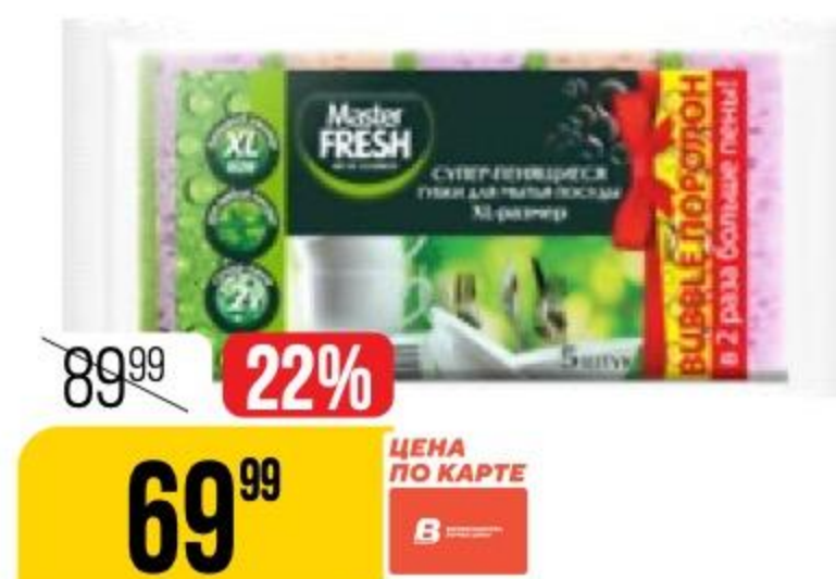
ГУБКИ ДЛЯ МЫТЬЯ ПОСУДЫ MASTER FRESH XL, 5 шт. 167270