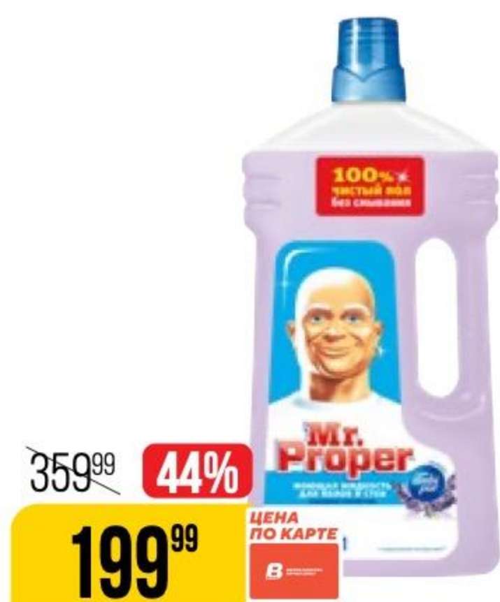
СРЕДСТВО ДЛЯ УБОРКИ MR. PROPER лавандовое спокойствие, 1 л 131232