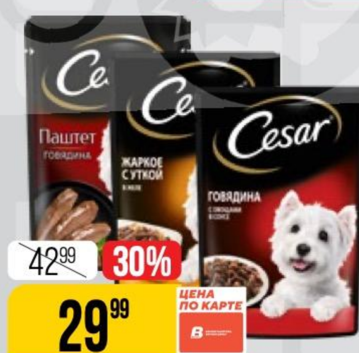
КОРМ ДЛЯ СОБАК CESAR в ассортименте, 80-85 г 177219/146066/177221/188491/146068