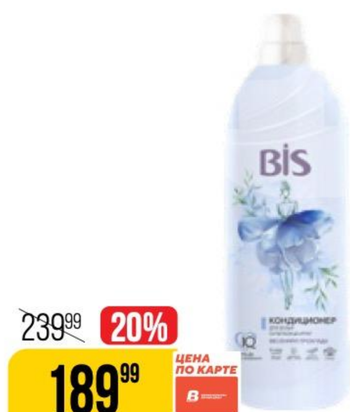
КОНДИЦИОНЕР ДЛЯ БЕЛЬЯ BIS весенняя прохлада, концентрат, 900 мл 173841