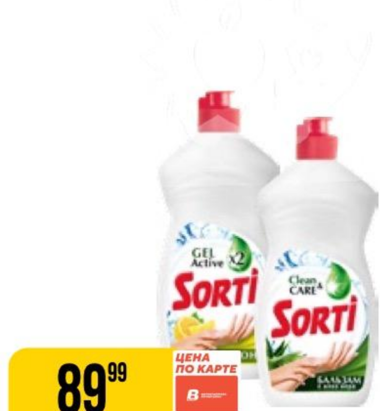
СРЕДСТВО ДЛЯ МЫТЬЯ ПОСУДЫ SORTI в ассортименте, 450 г 132413/132415