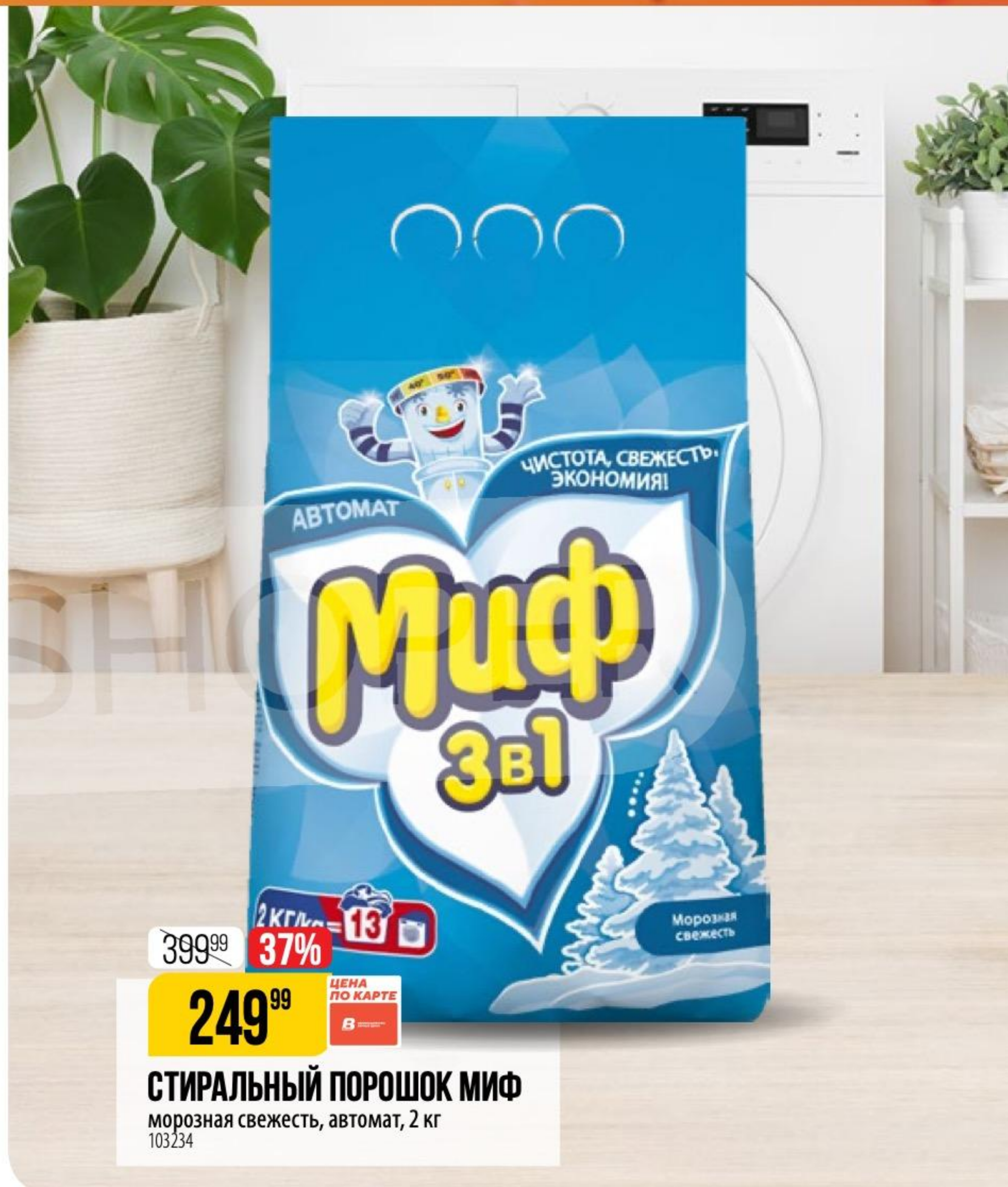
СТИРАЛЬНЫЙ ПОРОШОК МИФ морозная свежесть, автомат, 2 кг 103234