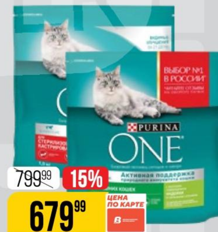
КОРМ ДЛЯ КОШЕК PURINA ONE в ассортименте, 1,5 кг 147478/164419

3 РЕГИСТРИРУЙ НОМЕР КАРТЫ НА САЙТЕ WWW.VERNOPROMO.RU