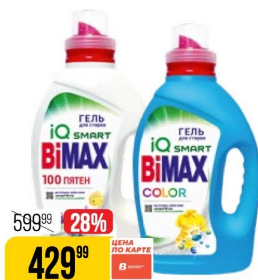
СРЕДСТВО ДЛЯ СТИРКИ ВІМАХ в ассортименте, 1,3 л 153631/153637