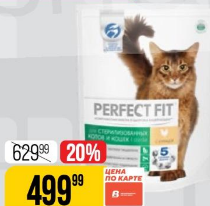
КОРМ ДЛЯ КОШЕК PERFECT FIT для стерилизованных кошек и кошек, курица, 1,2 кг 132662