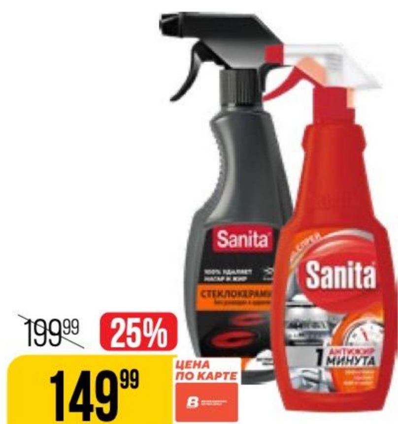
ЧИСТЯЩЕЕ СРЕДСТВО SANITA в ассортименте, 500 мл 184138/143491