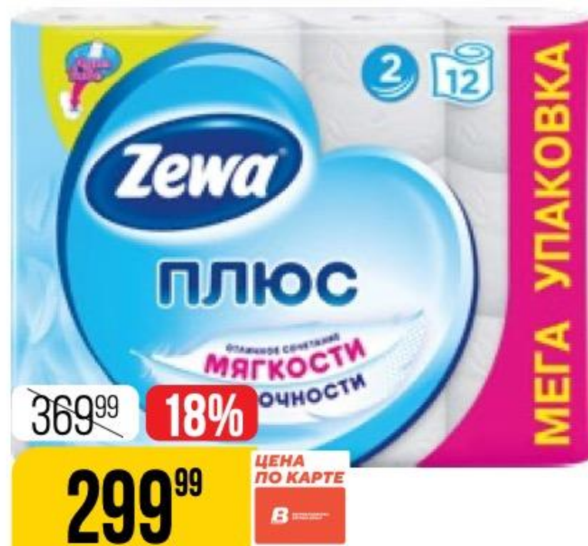
ТУАЛЕТНАЯ БУМАГА ZEWA ПЛЮС белая, 2 слоя, 12 рул. 121716