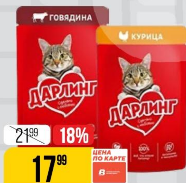
КОРМ ДЛЯ КОШЕК ДАРЛИНГ в ассортименте, 75 г 178323/178325