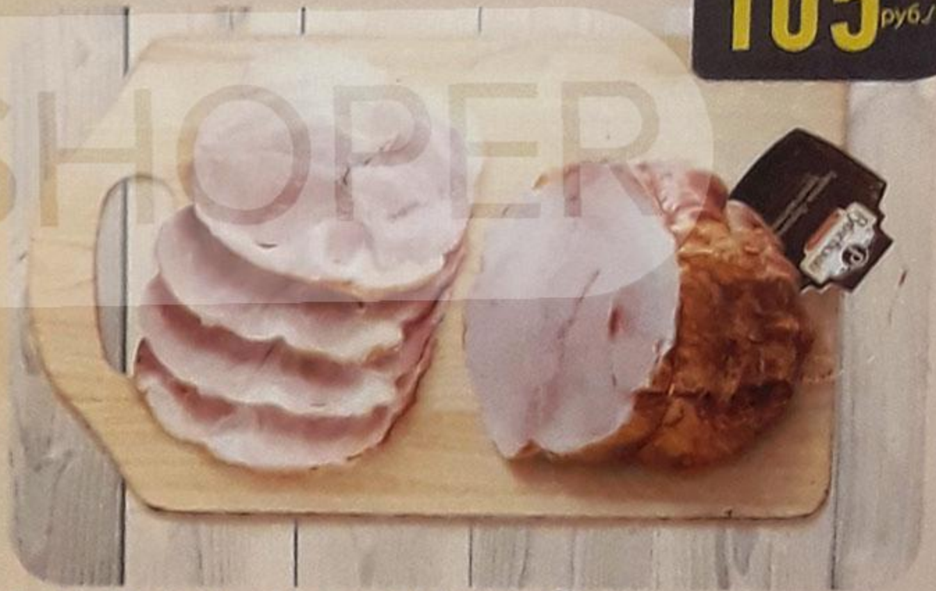
БАРИНОК «БОРОВИЦКИЙ» варёно-копчёный