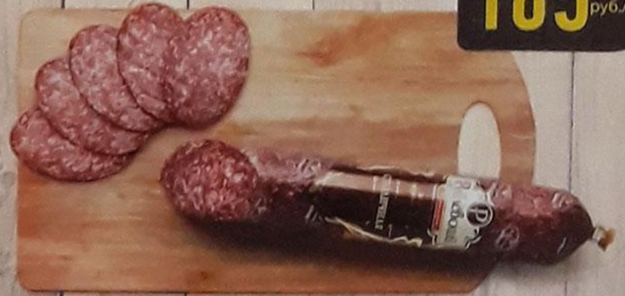
КОЛБАСА «СТОЛИЧНАЯ» сырокопчёная