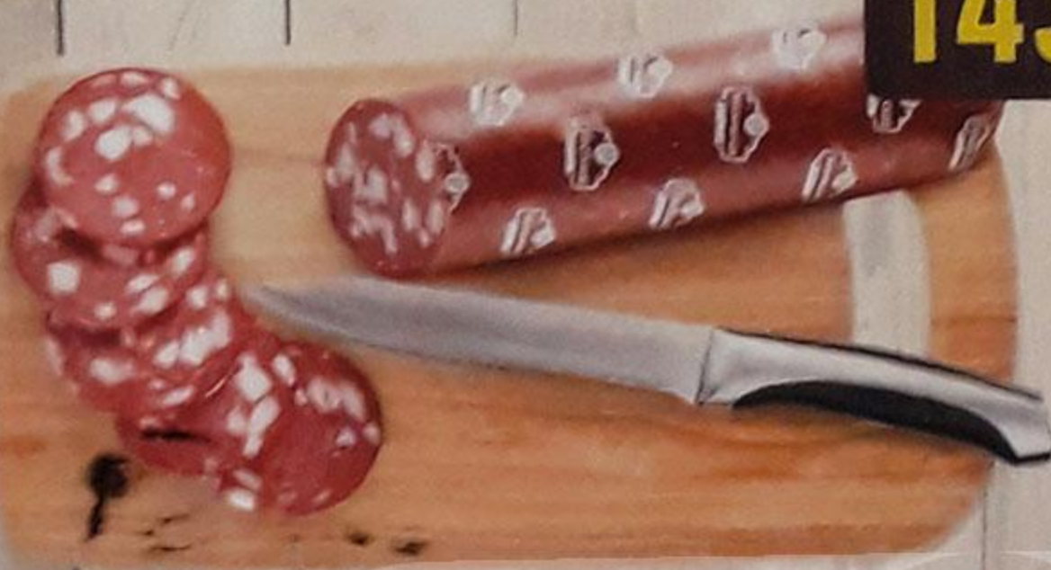
КОЛБАСА «МОСКОВСКАЯ» варёно-копчёная