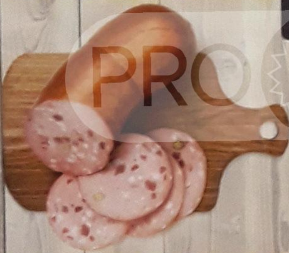
КОЛБАСА «ТЕЛЯЧЬЯ» варёная, в синюге