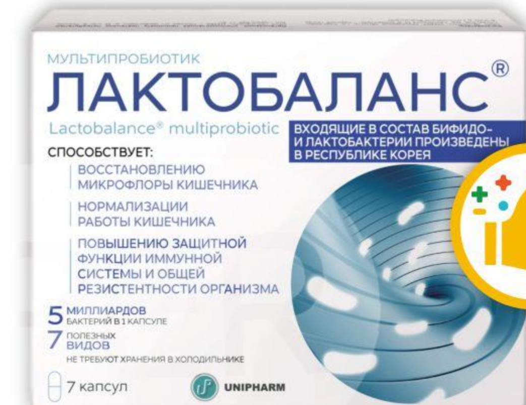
ЛАКТОБАЛАНС МУЛЬТИПРОБИОТИК 378МГ №7