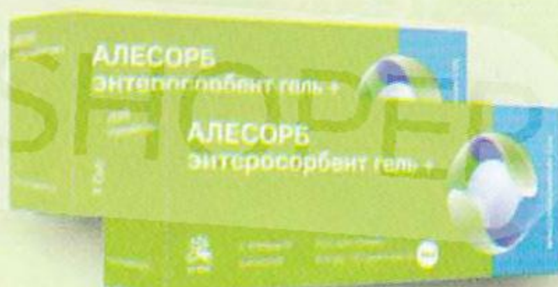
Алесорб энтеросорбент гель для приема внутри б/аромата 10г, 18 шт