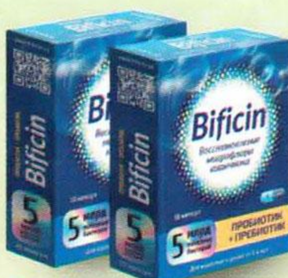
Бифицин 5 млрд. бактерий, 10 шт