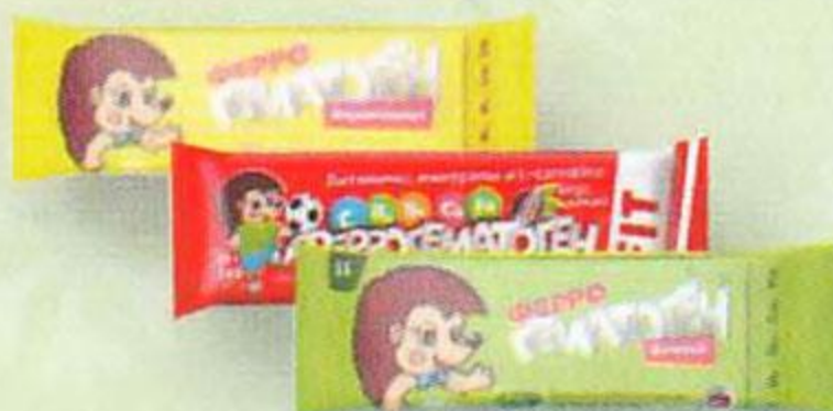
Феррогематоген, 50 г (в ассортименте)