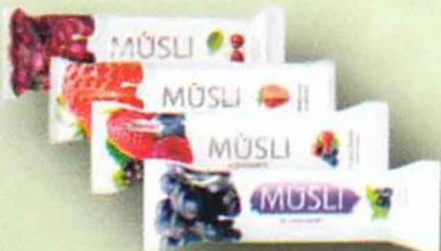
Батончик мюсли, 30 г (в ассортименте)