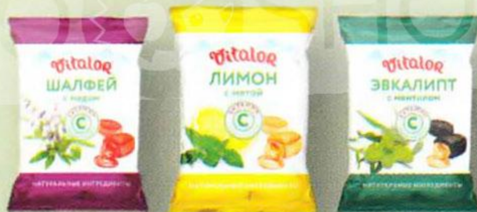
Виталор карамель леденцовая, 60 г (в ассортименте)