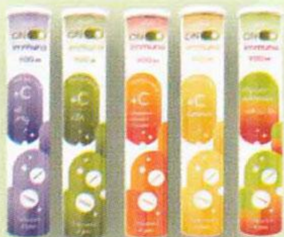
Аскорбинка 900мг (в ассортименте)