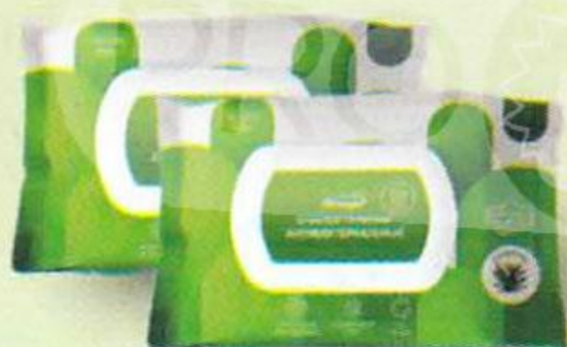
Салфетки влажные антибактериальные, 100 шт