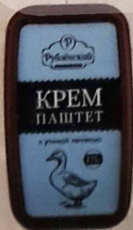
КРЕМ-ПАШТЕТ с утиной печенью