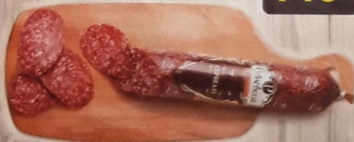
КОЛБАСА «СЕРВЕЛАТ» сырокопчёная