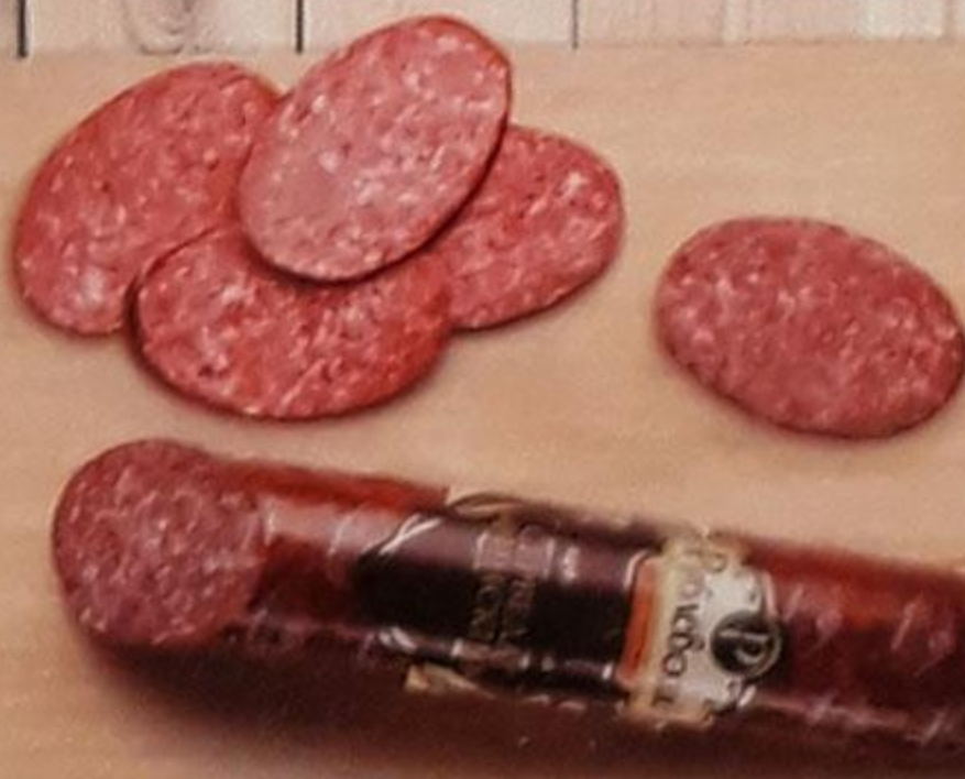
КОЛБАСА «СЕРВЕЛАТ ФИНСКИЙ» варёно-копчёная