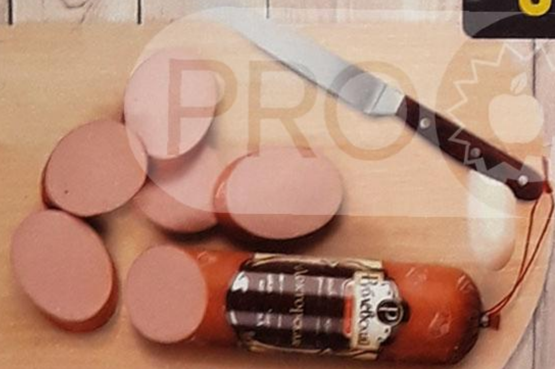
КОЛБАСА «ДОКТОРСКАЯ» варёная, в белкозине