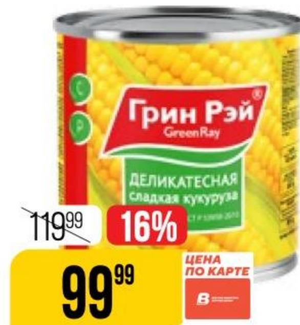
КУКУРУЗА ДЕЛИКАТЕСНАЯ Green Ray, 425 мл 137684