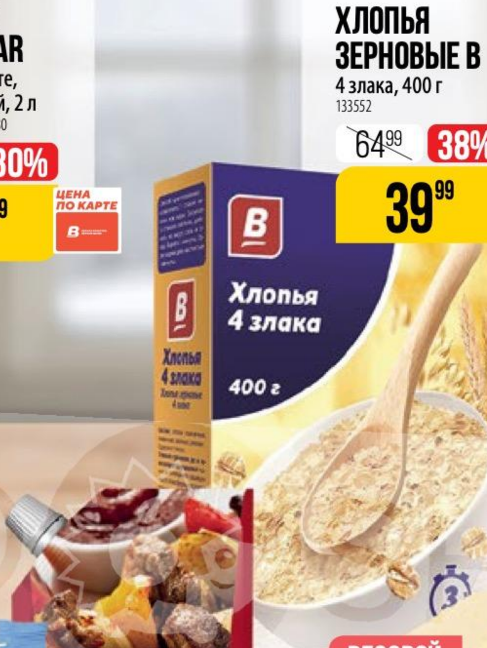
ХЛОПЬЯ ЗЕРНОВЫЕ В 4 злака, 400 г 133552