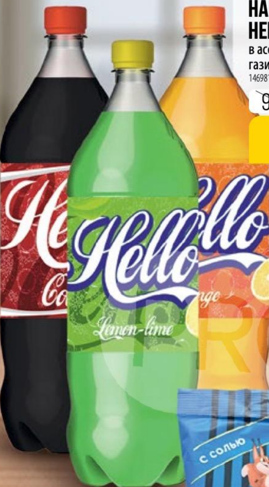
НАПИТОК HELLO STAR в ассортименте, газированный, 2 л 146981/146982/146980