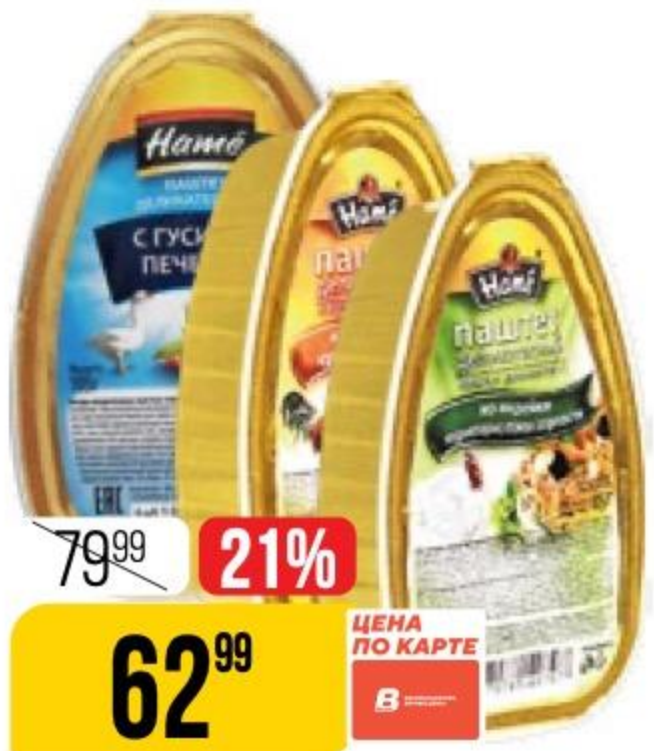
ПАШТЕТ НАМЕ в ассортименте, 105 г 161301/107673/107675