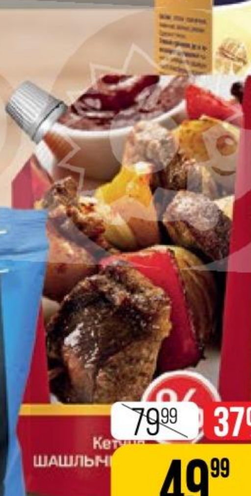
49 99 37% ЦЕНА ПО КАРТЕ