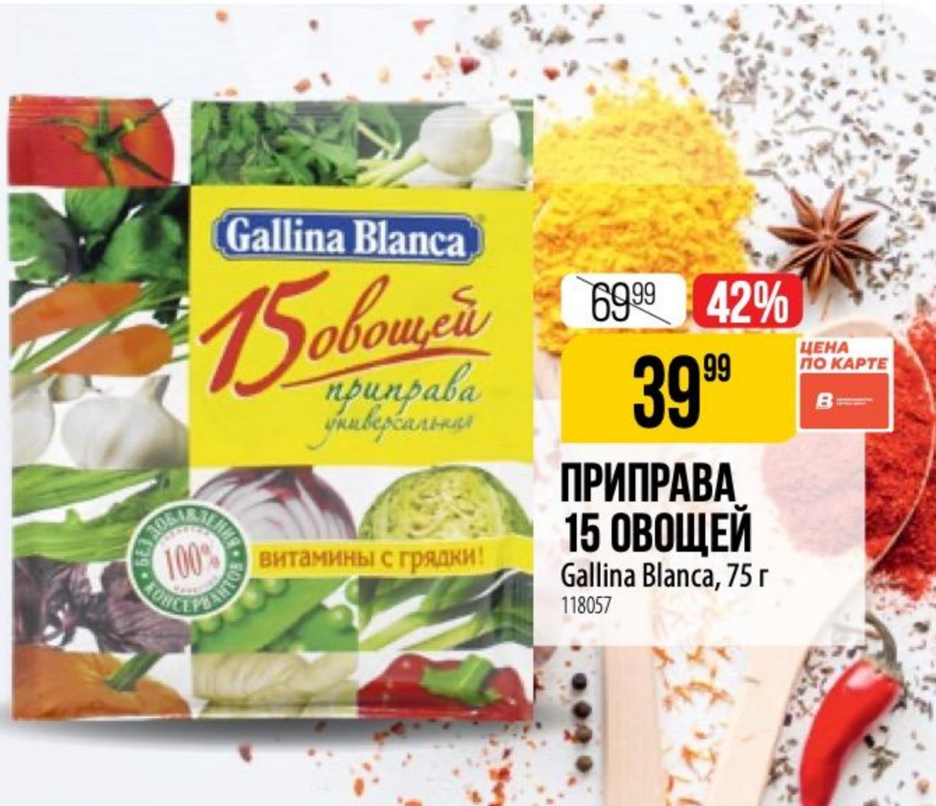
ПРИПРАВА 15 ОВОЩЕЙ Gallina Blanca, 75 г 118057