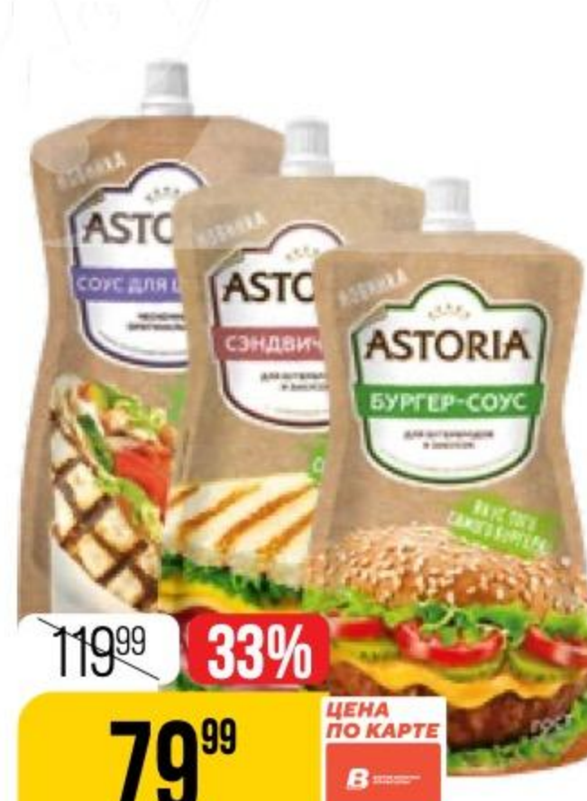
СОУС ASTORIA в ассортименте, 200 г 149517/179226/149519/173548