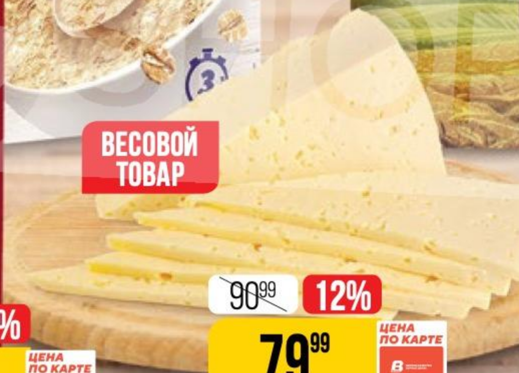
СЫР ТИЛЬЗИТЕР 45%, 100 г 2120