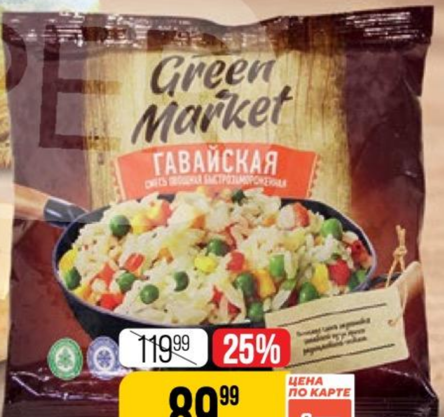
СМЕСЬ ГАВАЙСКАЯ замороженная, Green Market, 400 г 141745