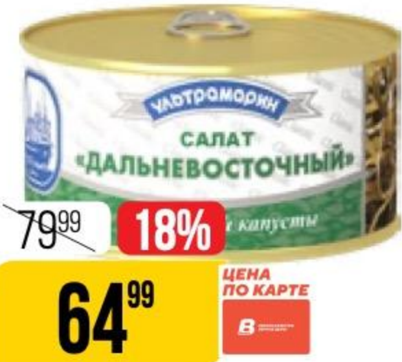
САЛАТ ДАЛЬНЕВОСТОЧНЫЙ из морской капусты, Ультрамарин, 220 г 184571