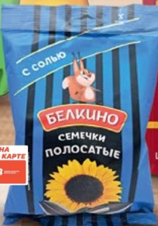
СЕМЕЧКИ ПОЛОСАТЫЕ с солью, Белкино, 100 г 188553