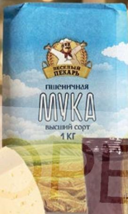
МУКА пшеничная, Веселый Пекарь, 1 кг 167797