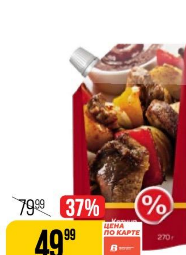
КЕТЧУП % шашлычный, 270 г 131616