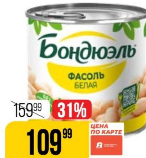
ФАСОЛЬ белая, Bonduelle, 400 г 104580