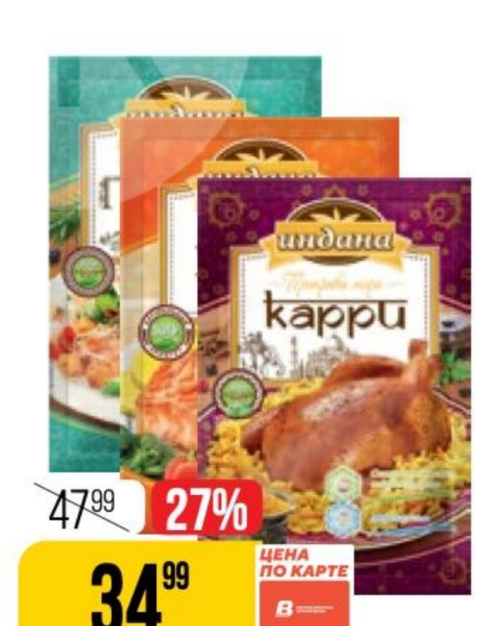
ПРИПРАВА ИНДАНА в ассортименте, 15 г 184950/184952/184956/184945/184909