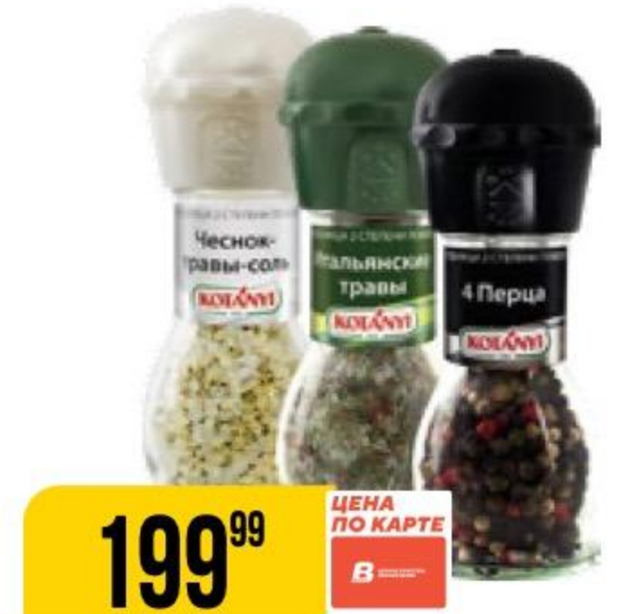
ПРИПРАВА КОТАНУ мельница, в ассортименте, 35-50 г 108342/108340/108339/142584