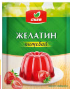
Желатин О'КЕЙ, 10 г