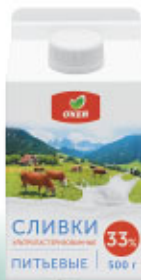
Сливки ультрапастеризованные О'КЕЙ, 33%, 500 г