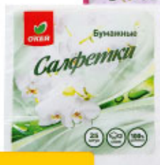
Салфетки бумажные О'КЕЙ, 33х33 см, 25 шт.**