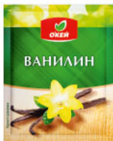
Ванилин О'КЕЙ, 3 г

6 Полученную смесь выложите сверху уже застывшего десерта