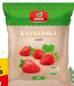
Клубника О'КЕЙ, замороженная, 300 г