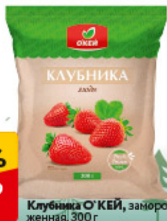
Клубника О'КЕЙ, замороженная, 300 г