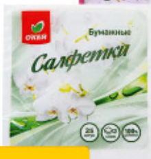
Салфетки бумажные О'КЕЙ, 33х33 см, 25 шт.**