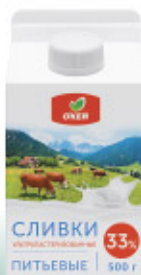
Сливки ультрапастеризованные О'КЕЙ, 33%, 500 г