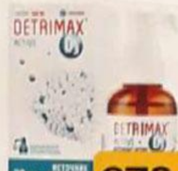
ТАБЛ. 700 МГ, №30 RU.77.99.11.003.E.003863.09.18