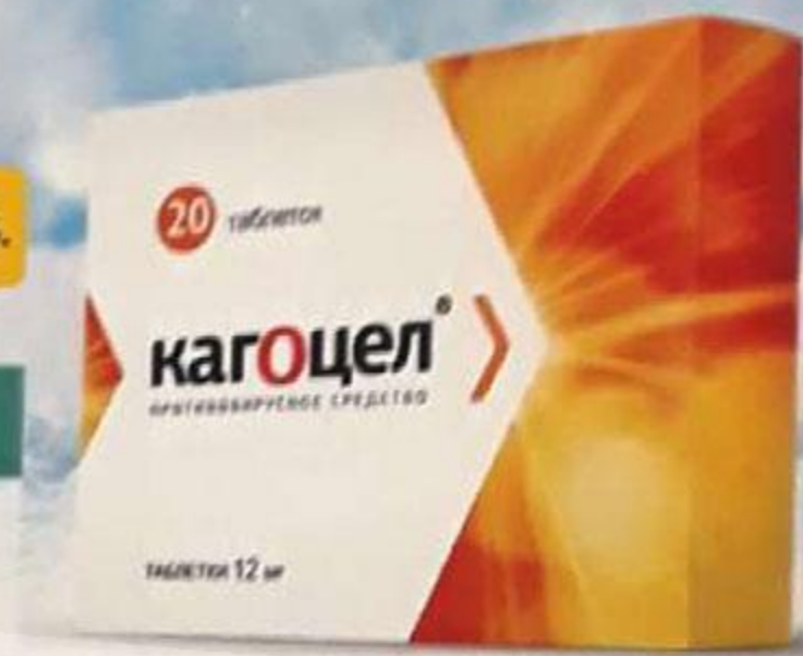
ТАБЛ. 12 МГ, №20 P N002027/01