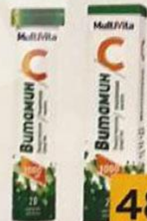
ТАБЛ. №20 ЛП-№(005116)-(PG-RU)