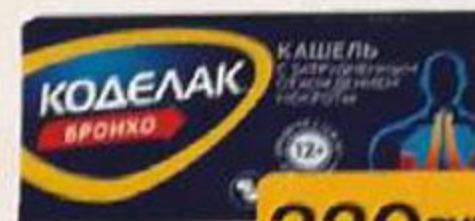
ТАБЛ. ЖЕВАТ./МЯТА №60 RU.77.99.11.003.R.002310.08.23