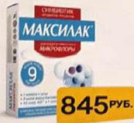
ТАБЛ. Д/Р-РА Д/МЕСТ. ПРИМ. 2% №2 ЛП-005018