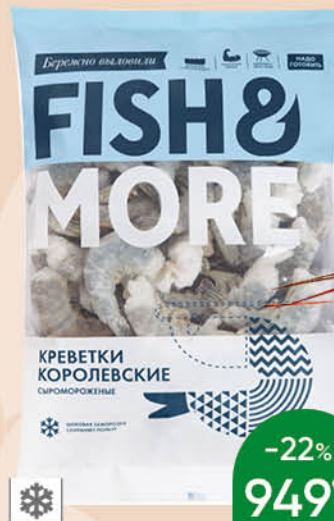
Креветки FISH & MORE Королевские сыромороженные, без головы, в панцире, 16/20, 500 г