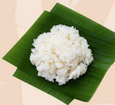
Рис MARKET COLLECTION Для японской кухни шлифованный, 500 г