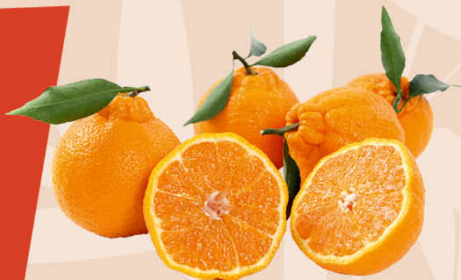
Мандарины Халлабон, 1 кг

Они часто используются в традиционных китайских праздниках, таких как Новый год, где их дарят как символ благополучия. Китай является одним из крупнейших производителей мандаринов в мире, и значительная часть урожая экспортируется в другие страны. Китайские мандарины популярны на международных рынках благодаря своему качеству и вкусу. Фрукты являются отличным источником витамина С, антиоксидантов и клетчатки. Они полезны для иммунной системы, улучшают пищеварение и могут способствовать улучшению состояния кожи. Китайские мандарины – это не только вкусный и полезный фрукт, но и важная часть культурного наследия страны, символизирующая удачу и процветание.