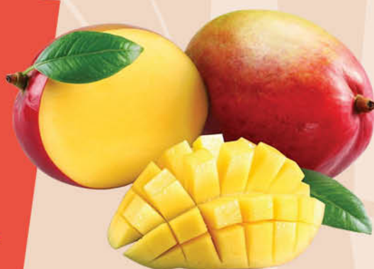
Манго MARKET спелый плод, 100 г

с интенсивным ароматом и выраженным сладким вкусом. Оно универсально в использовании: его можно подавать в нарезанном виде как десерт, добавлять в десерты, выпечку и фруктовые салаты, а также использовать для приготовления сливочных кремов и гурманских соусов к рыбе и мясу. Манго обладает сладким вкусом с легкой кислинкой, напоминающим смесь персика и ананаса. Мякоть сочная, волокнистая и душистая. Аромат манго свежий, фруктовый и немного хвойный, а также в нём можно уловить нюансы абрикоса, дыни, розы или лимона. Манго богато витаминами группы В, а также витаминами С, А, Е, магнием, кальцием, железом и цинком. РЕГУЛЯРНОЕ УПОТРЕБЛЕНИЕ ЭТОГО ФРУКТА СПОСОБСТВУЕТ УКРЕПЛЕНИЮ ЗДОРОВЬЯ СЕРДЦА, УЛУЧШЕНИЮ СОСТОЯНИЯ ГЛАЗ И ВОЛОС, А ТАКЖЕ ПОДДЕРЖАНИЮ ИММУНИТЕТА.