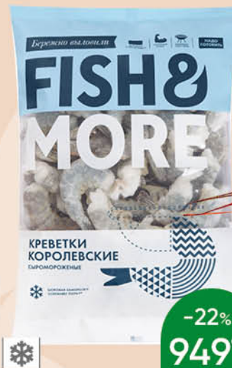
Креветки FISH & MORE Королевские сыромороженные, без головы, в панцире, 16/20, 500 г