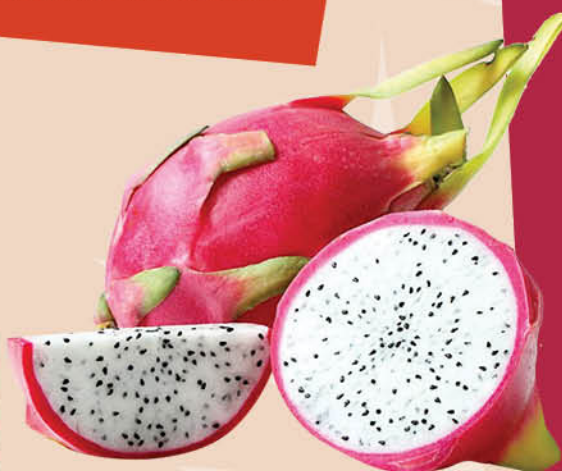
Питахайя крупная 1 кг

Питахайя, иначе известная как драконий фрукт, представляет собой красивый и сладкий фрукт, текстура которого напоминает инжир.