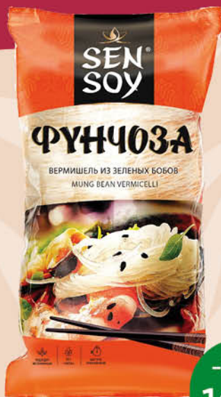
Фунчоза SEN SOY Premium, 200 г