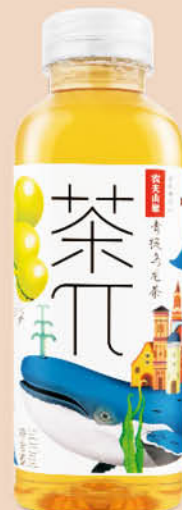
Холодный чай NONGFU SPRING со вкусом зелёного винограда, 0,5 л