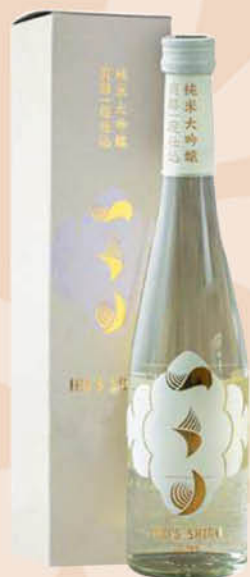
Sake JOSEN KINKAN в подарочной упаковке 15,4%, 0,72 л (Япония)