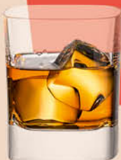
Виски Goalong Riverside односолодовый 40%, 700 мл