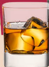
Виски Onikishi Cherry Blossom японский купажированный 40%, 700 мл