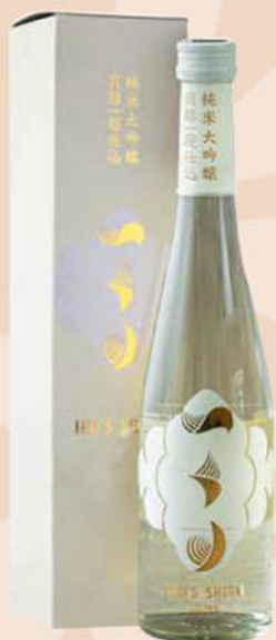
Sake JOSEN KINKAN в подарочной упаковке 15,4%, 0,72 л (Япония)