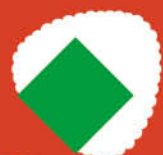
Виски FOWLER'S Strong Asia Style купажированный 43%, 0,7 л (Россия)