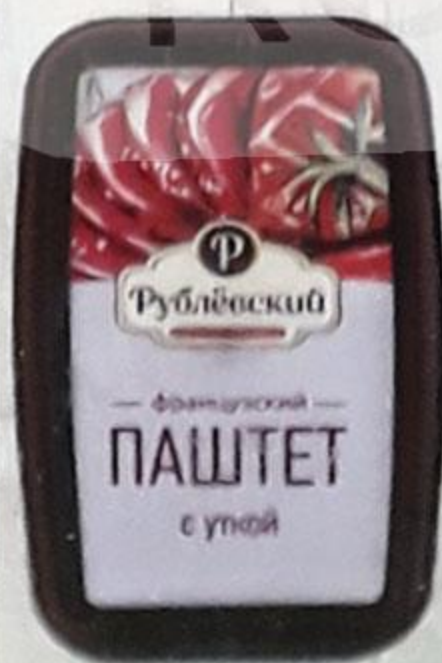
ПАШТЕТ «ФРАНЦУЗСКИЙ» с уткой