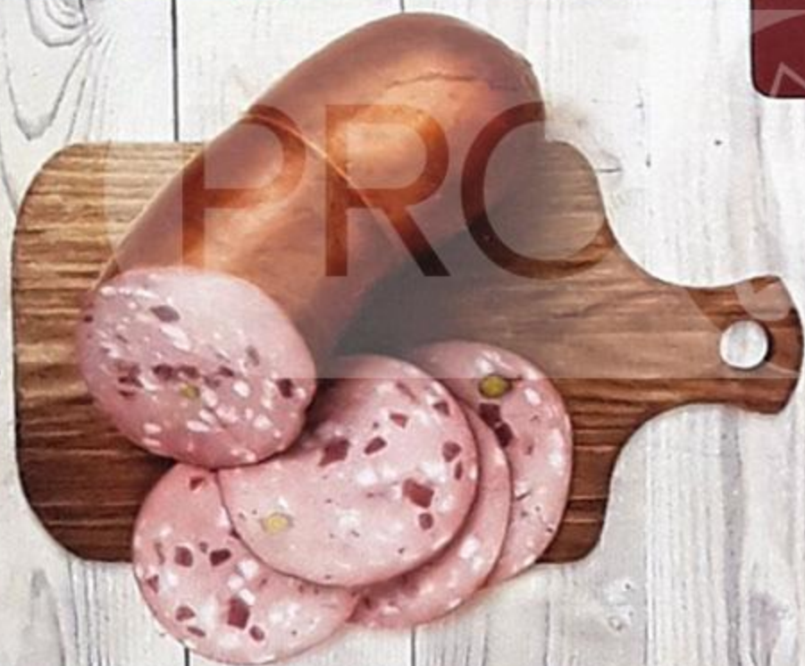
КОЛБАСА «ТЕЛЯЧЬЯ» варёная, в синюге