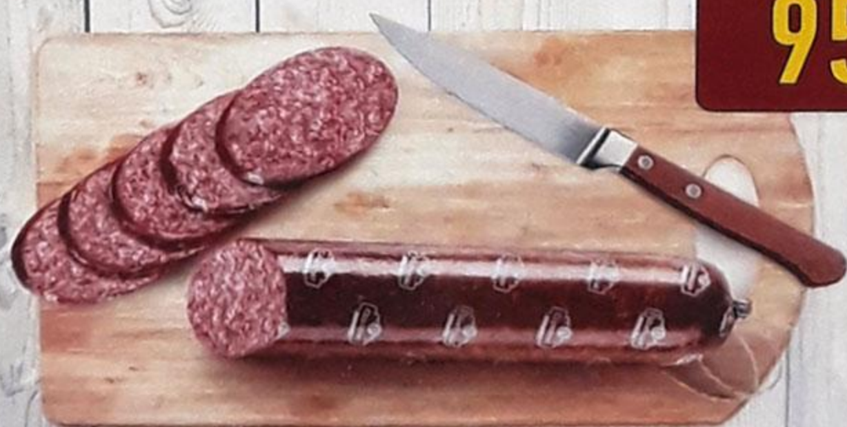
КОЛБАСА «СЕРВЕЛАТ» варёно-копчёная