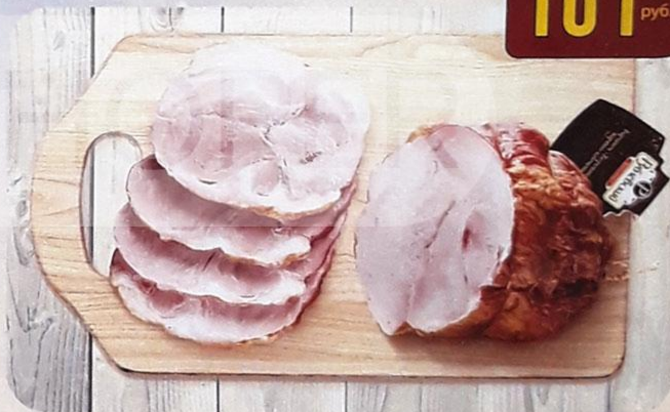
БАРИНОК «БОРОВИЦКИЙ» варёно-копчёный