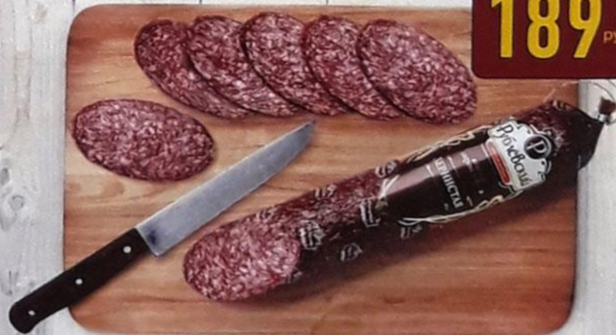
КОЛБАСА «ЗЕРНИСТАЯ» сырокопчёная