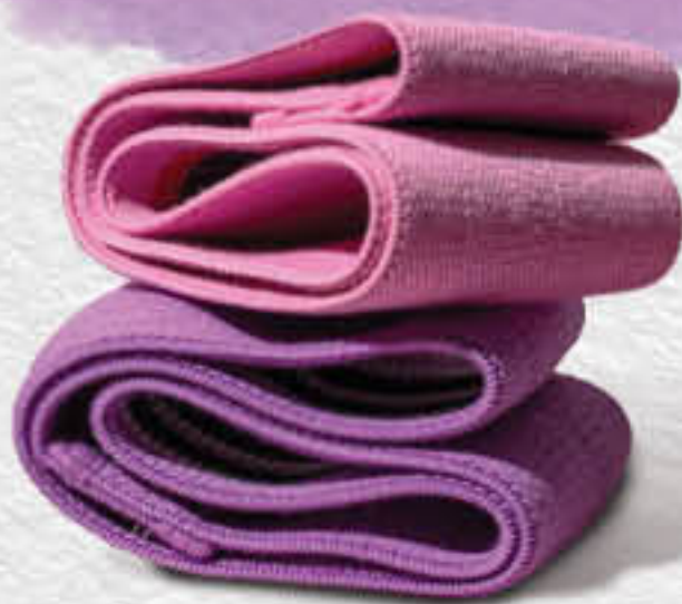
Фитнес-резинки RVIG-UH24102-B, 1 шт.