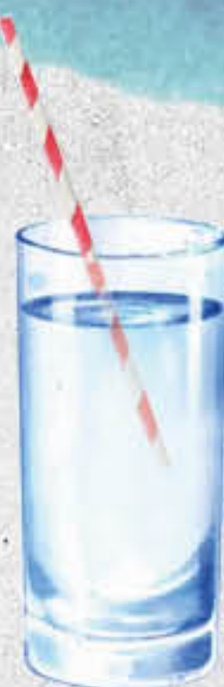
Вода RARE питьевая природная родниковая негазированная, 0,5 л

Негазированные витаминизированные напитки без сахара, которые помогают повысить иммунитет и улучшить физиологические процессы в организме, чтобы сохранять активный образ жизни.