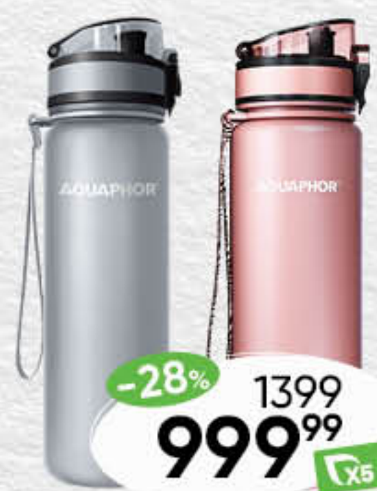
Бутылка для напитков АРХИМЕД, 0,6 л