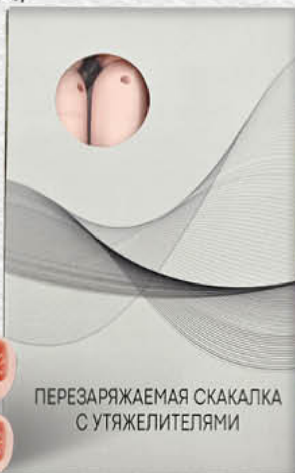
ПЕРЕЗАРЯЖАЕМАЯ СКАКАЛКА С УТЯЖЕЛИТЕЛЯМИ

Эффективный тренажер для снижения веса. Перезаряжаемая электронная скакалка с утяжелителем имеет датчик с точным подсчетом прыжков. Благодаря компактным размерам, вы сможете положить тренажер в любую сумку и размяться в свободную минуту с пользой для своего здоровья.