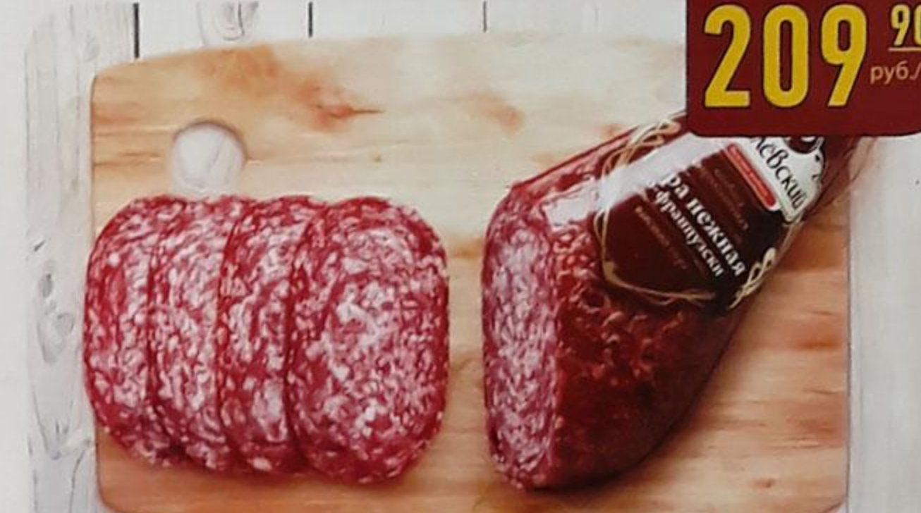
КОЛБАСА «ПЕРА ИСПАНСКАЯ С ВИНОМ» сырокопчёная