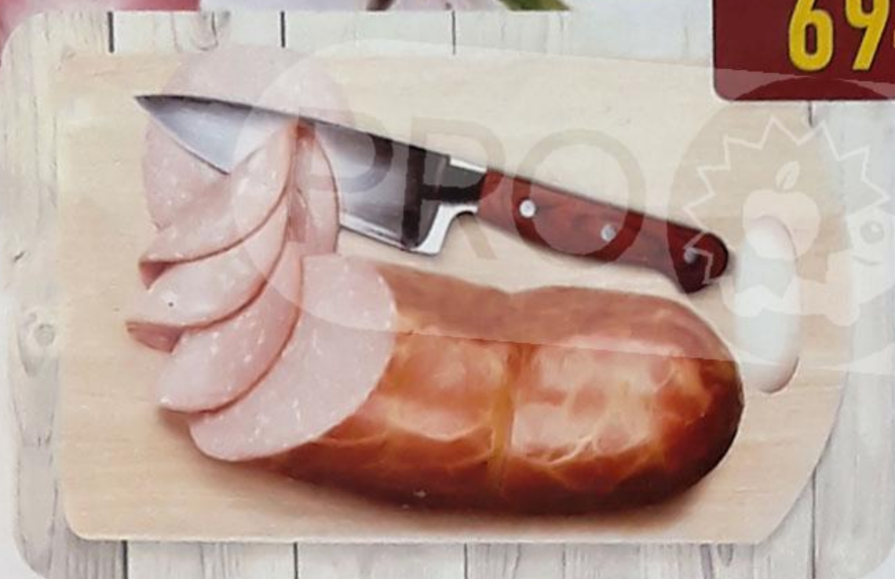
КОЛБАСА «РУССКАЯ» варёная, в синюге