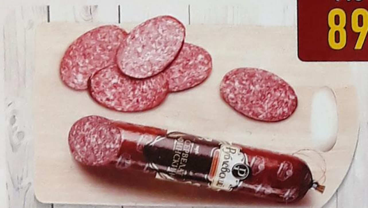
КОЛБАСА «СЕРВЕЛАТ ФИНСКИЙ» варёно-копчёная