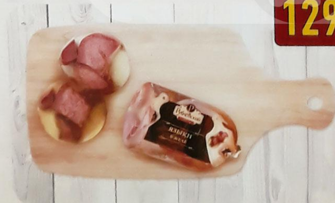
ЯЗЫКИ СВИНЫЕ В ЖЕЛЕ