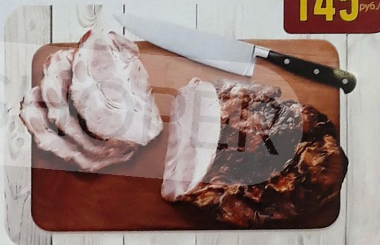
ШЕЙКА «МОСКОВИЯ» запечённая