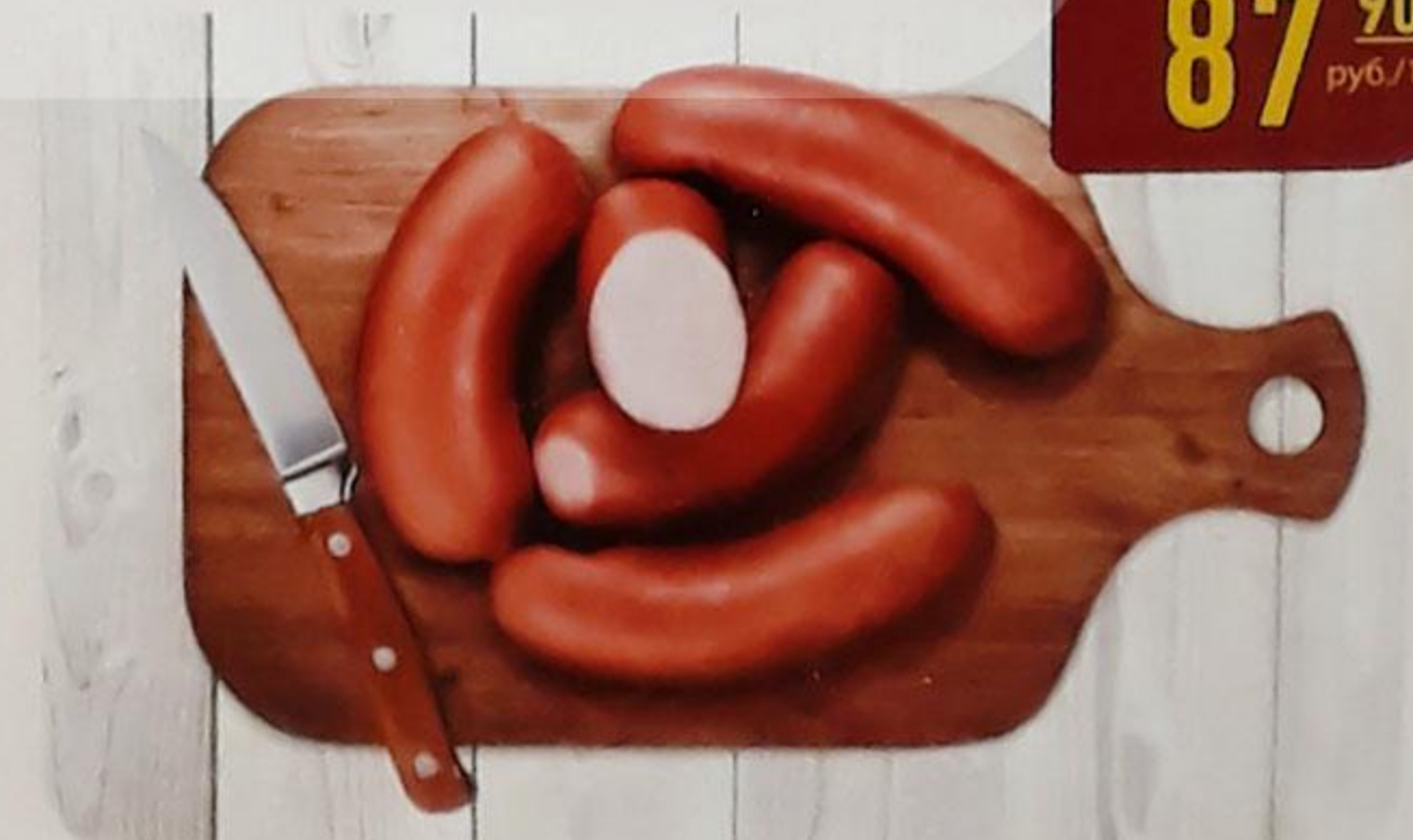
САРДЕЛЬКИ «РУБЛЁВСКИЕ» ГОВЯЖЬИ-ЛЮКС