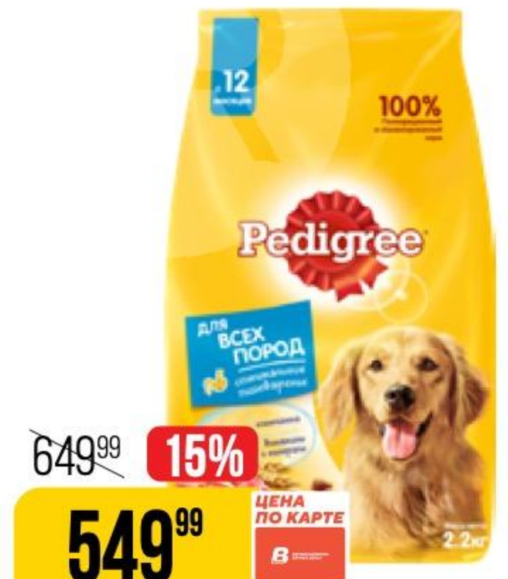
КОРМ ДЛЯ СОБАК PEDIGREE для взрослых всех пород, говядина, 2,2 кг 169936