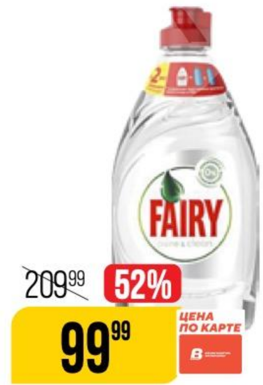
СРЕДСТВО ДЛЯ МЫТЬЯ ПОСУДЫ FAIRY pure&clean, 450 мл 190831