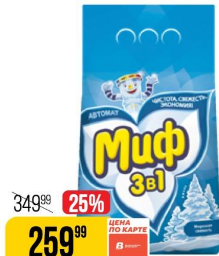
СТИРАЛЬНЫЙ ПОРОШОК МИФ морозная свежесть, автомат, 2 кг 103234