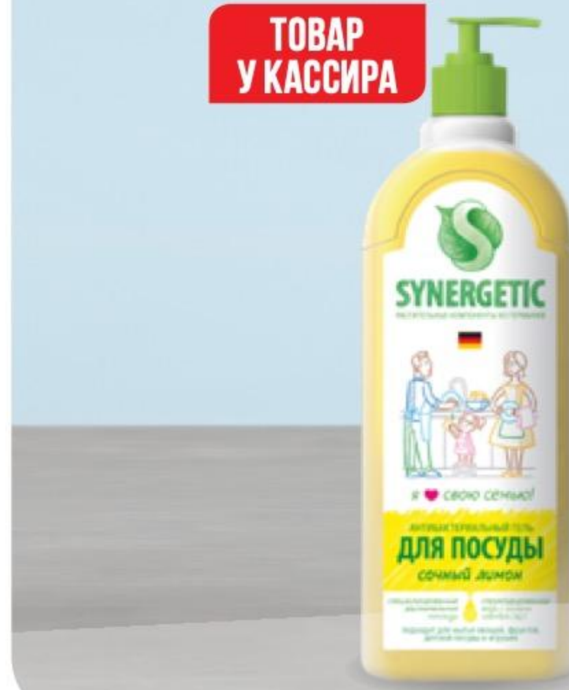
СРЕДСТВО ДЛЯ МЫТЬЯ ПОСУДЫ SYNERGETIC лимон, 1 л 143439