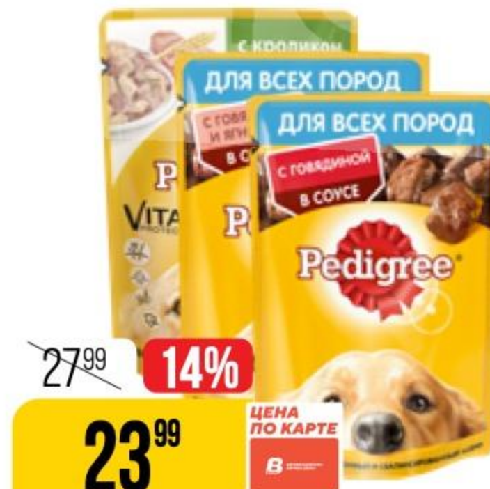
КОРМ ДЛЯ СОБАК PEDIGREE в ассортименте, 80-85 г 181464/118301/146072/146071/146009