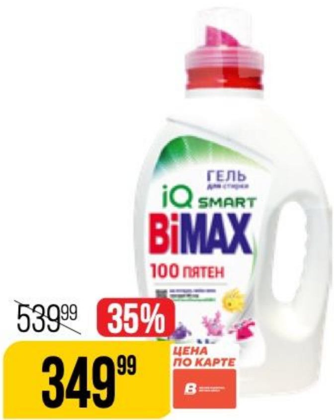
СРЕДСТВО ДЛЯ СТИРКИ BIMAX 100 пятен, гель, 1,3 л 153637