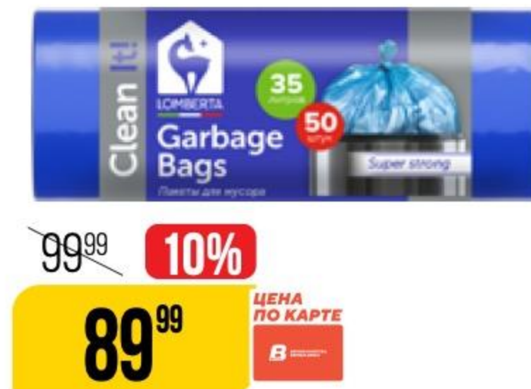
ПАКЕТЫ ДЛЯ МУСОРА голубые, 35 л, Lomberta, 50 шт. 190774