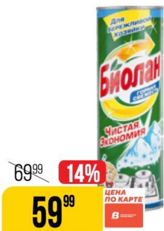
ЧИСТЯЩЕЕ СРЕДСТВО БИОЛАН горная свежесть, порошок, 400 г 153641