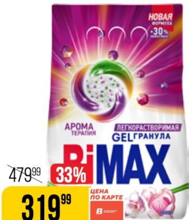
СТИРАЛЬНЫЙ ПОРОШОК BIMAX ароматерапия, автомат, 1,8 кг 185328