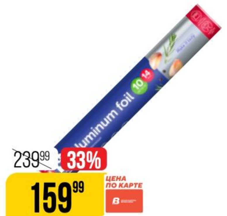
ФОЛЬГА АЛЮМИНИЕВАЯ экстрапрочная, 14 мкр, Lomberta, 10 м 190778