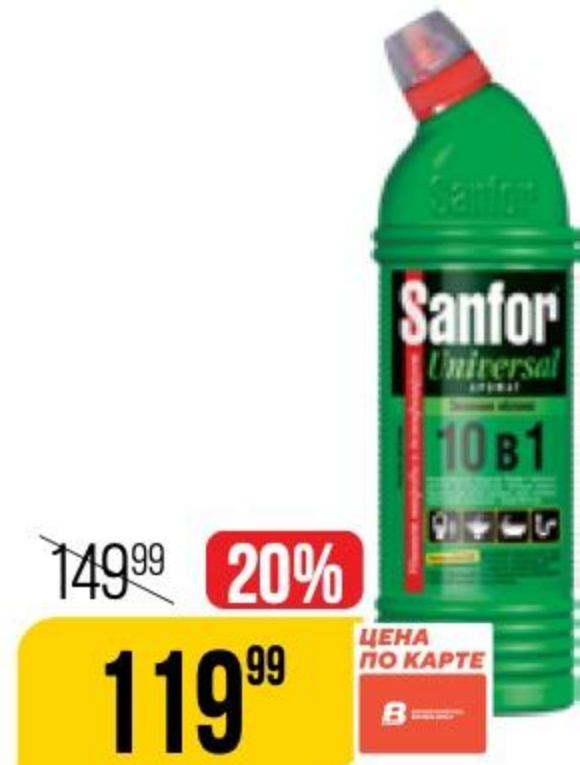
ЧИСТЯЩЕЕ СРЕДСТВО SANFOR universal, 750 мл 110031