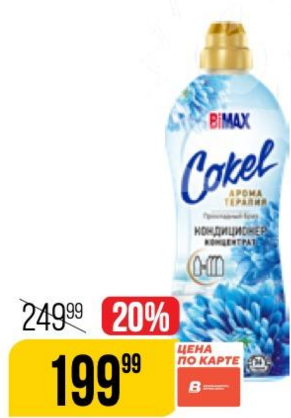
КОНДИЦИОНЕР ДЛЯ БЕЛЬЯ BIMAX cokel, прохладный бриз, 900 г 184684