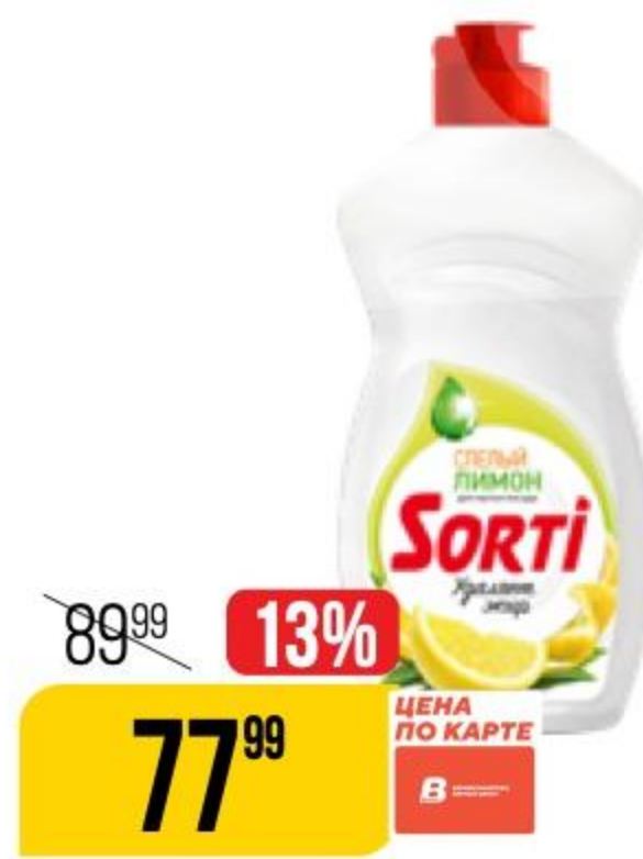
СРЕДСТВО ДЛЯ МЫТЬЯ ПОСУДЫ SORTI лимон, 450 г 132415