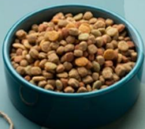
КОРМ ДЛЯ КОШЕК PURINA ONE в ассортименте, 75 г 168156/164321/168154/164319/143950