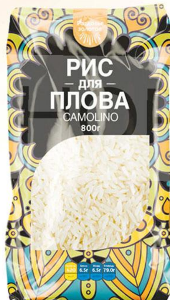
РИС РАЗДОЛЬЕ ЗОЛОТОЕ, ДЛЯ ПЛОВА, 800 Г

142 00 119 90 1 шт. 109 90 от 2 шт. -22%