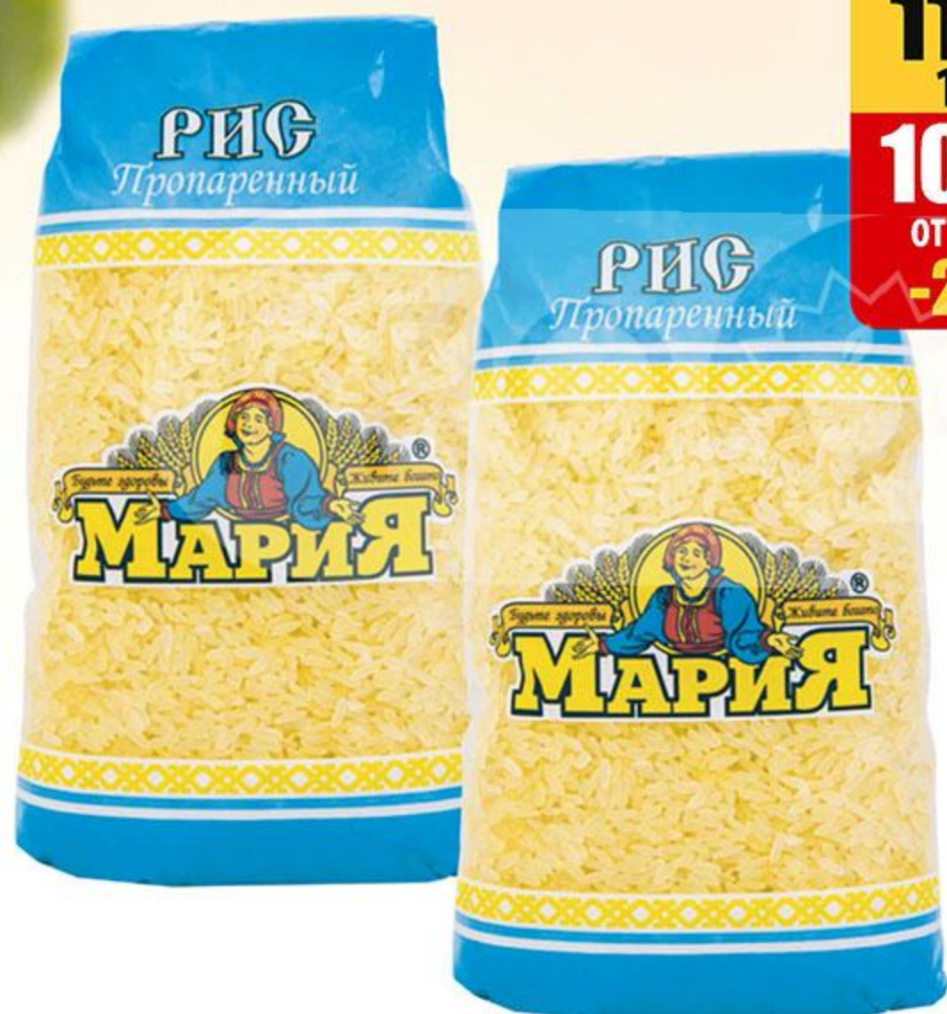
РИС МАРИЯ, ПРОПАРЕННЫЙ, 800 Г

142 00 119 90 1 шт. 109 90 от 2 шт. -22%