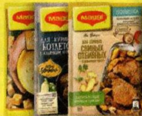
Сухие блюда быстрого приготовления, пряности MAGGI