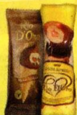
Мороженое порционное RIO D ORO