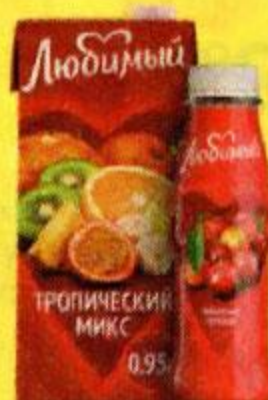
Соки и нектары ЛЮБИМЫЙ