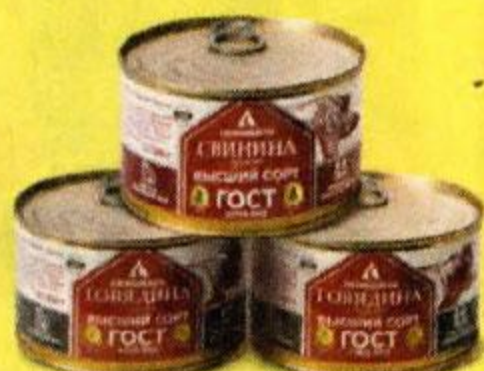
Консервы мясные СЕМИДАЛЬ