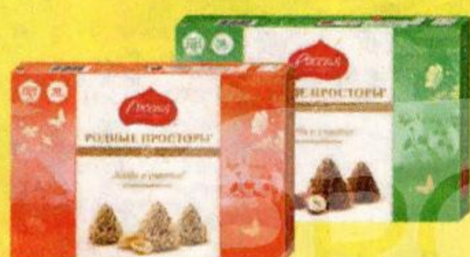
Шоколадные конфеты в коробках РОДНЫЕ ПРОСТОРЫ