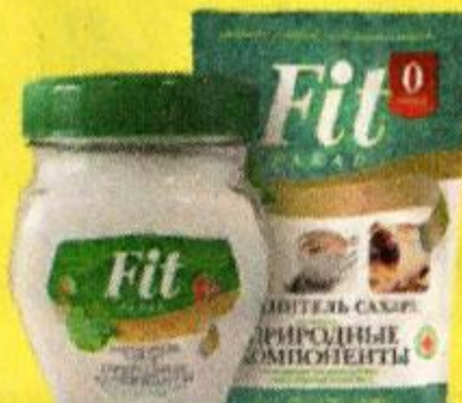
Заменители сахара FITPARAD