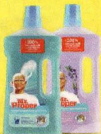
Средства для уборки MR. PROPER