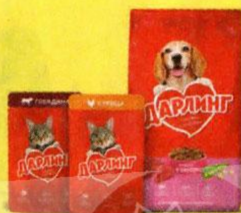
Корма для кошек и собак ДАРИНГ