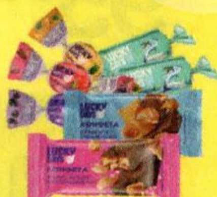
Конфеты весовые LUCKY DAYS