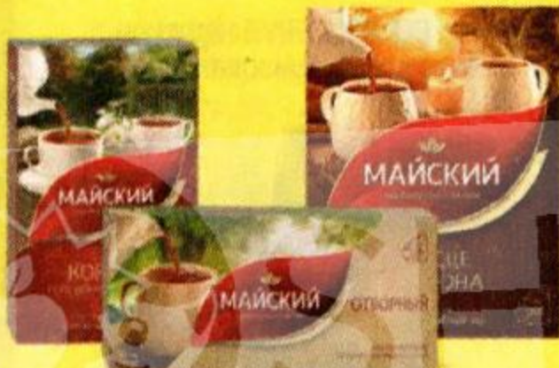
Чай зелёный и чёрный МАЙСКИЙ