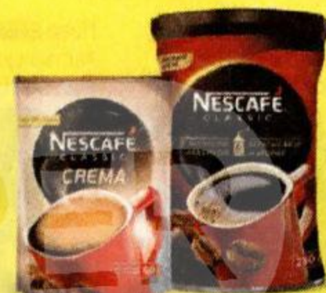
Кофе NESCAFE Classic