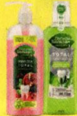
Уход за зубами и полостью рта ЛЕСНОЙ БАЛЬЗАМ