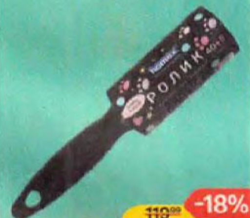
Ролик для одежды HOMEX , 45 листов