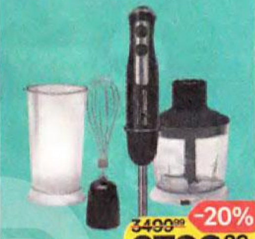
Набор блендерный POLARIS , арт. PHB1397, 1350Вт, 1 шт.