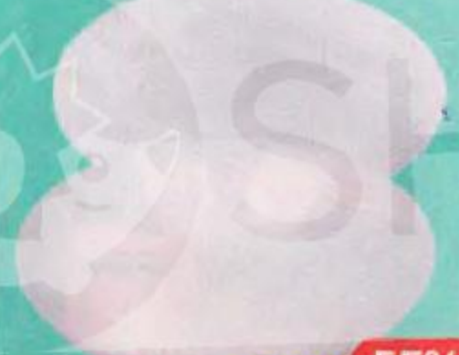
ТАРЕЛКА белая: суповая 20см/ обеденная 25см, 1 шт.