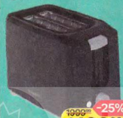
Тостер SCARLETT , SC-TM11020/SC-TM11019, 1 шт.