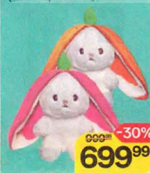
ИГРУШКА Зайчик в морковке, 25 см (Ломинар АГ 000), 1 шт.