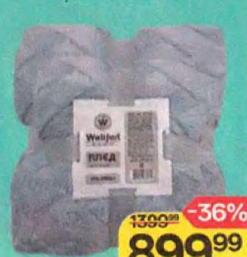
Плед WELLFORT® , Шерпа жаккард, 150x200см, 1 шт.