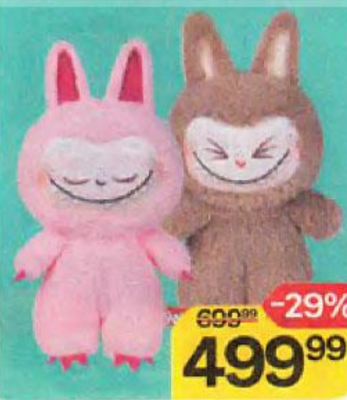
Игрушка мягкая FANCY , Монстрик, 20см, 1 шт.