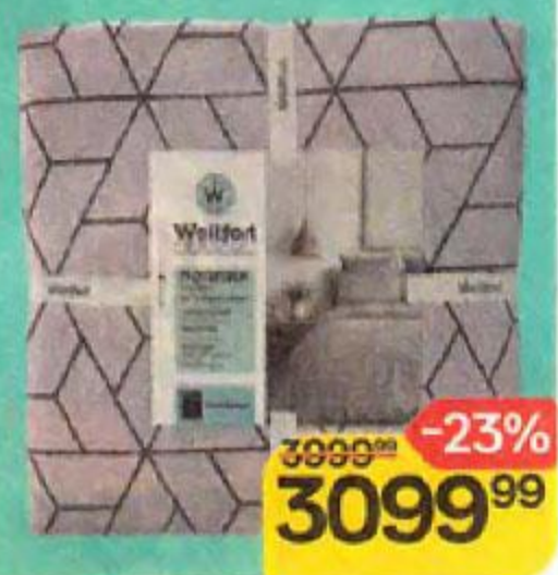
Комплект постельного белья WELLFORT® , Поплин, семейный, 1 уп.