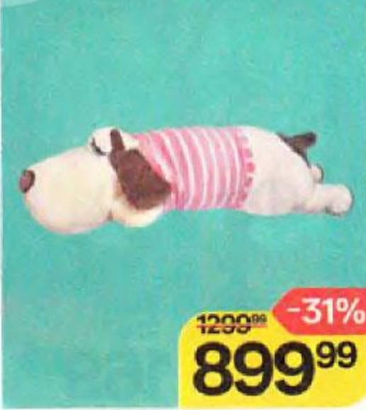
ИГРУШКА Собака-батон, 55см (Ломинар), 1 шт.