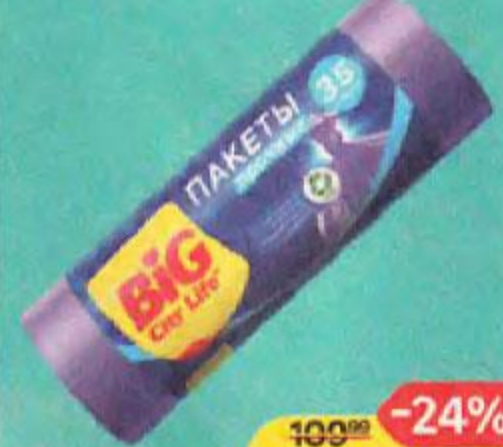
Пакеты для мусора BIG CITY LIFE , 35л, 11мкм, 20шт., 1 упаковка