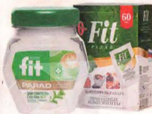
Заменители сахара FITPARAD