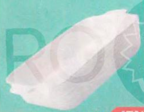
ФОРМА ДЛЯ ЗАПЕКАНИЯ керамическая, 19x11см, 1 шт.