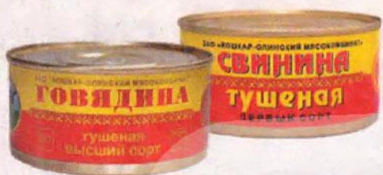
Консервы из мяса ЙОШКАР-ОЛИНСКИЙ МЯСОКОМБИНАТ