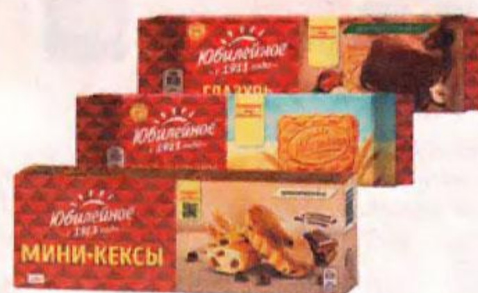
Печенье и мини-кексы ЮБИЛЕЙНОЕ