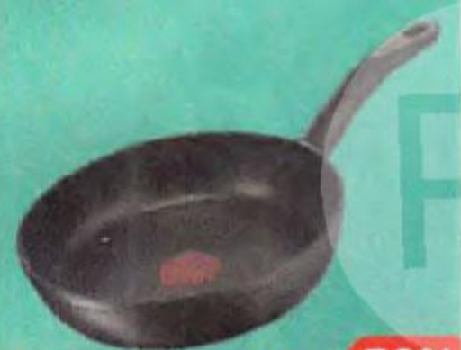
Сковорода TEFAL® Flavor Forge , 28см, индукционная, 1 шт.