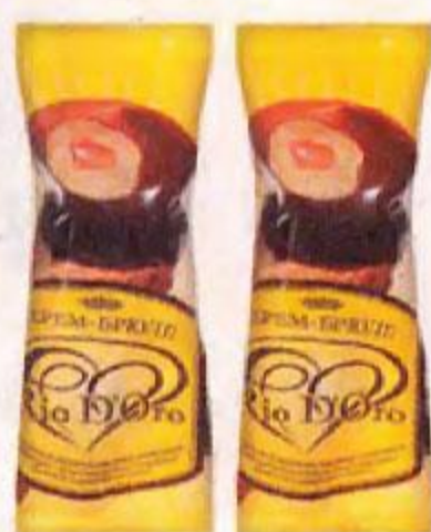
Мороженое RIO D'ORO