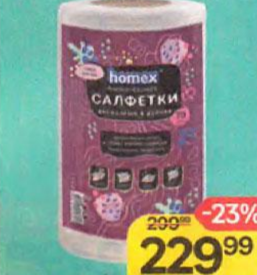
Салфетки в рулоне HOMEX , Очень нужные, 25x25см, 70 шт.