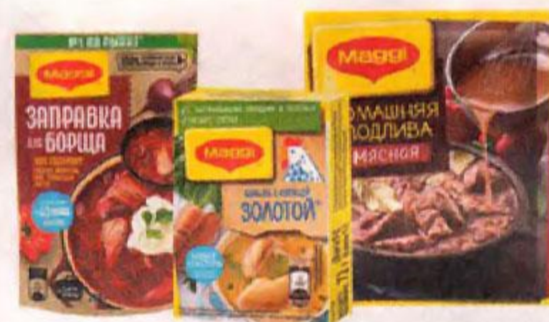
Приправы и смеси MAGGI