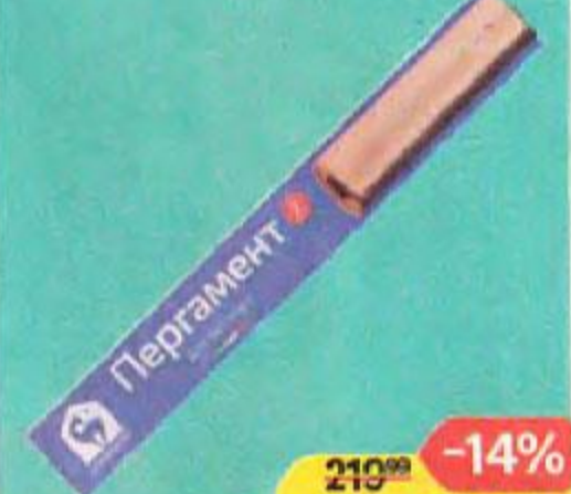
Пергамент для выпечки LOMBERTA , 7м, 1 уп.