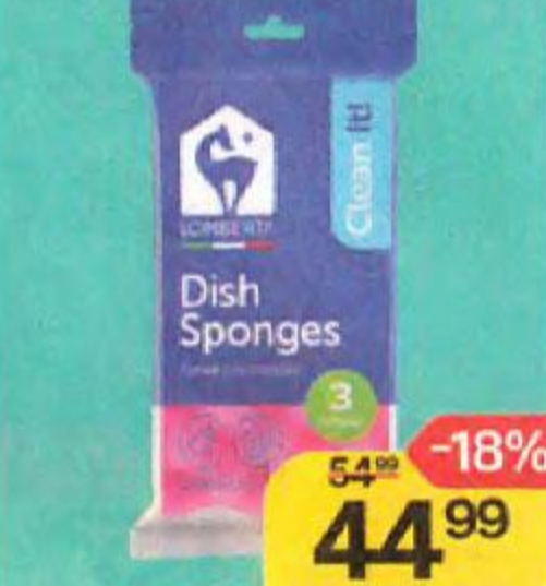
Губки для посуды LOMBERTA кухонные 3шт., 1 уп.