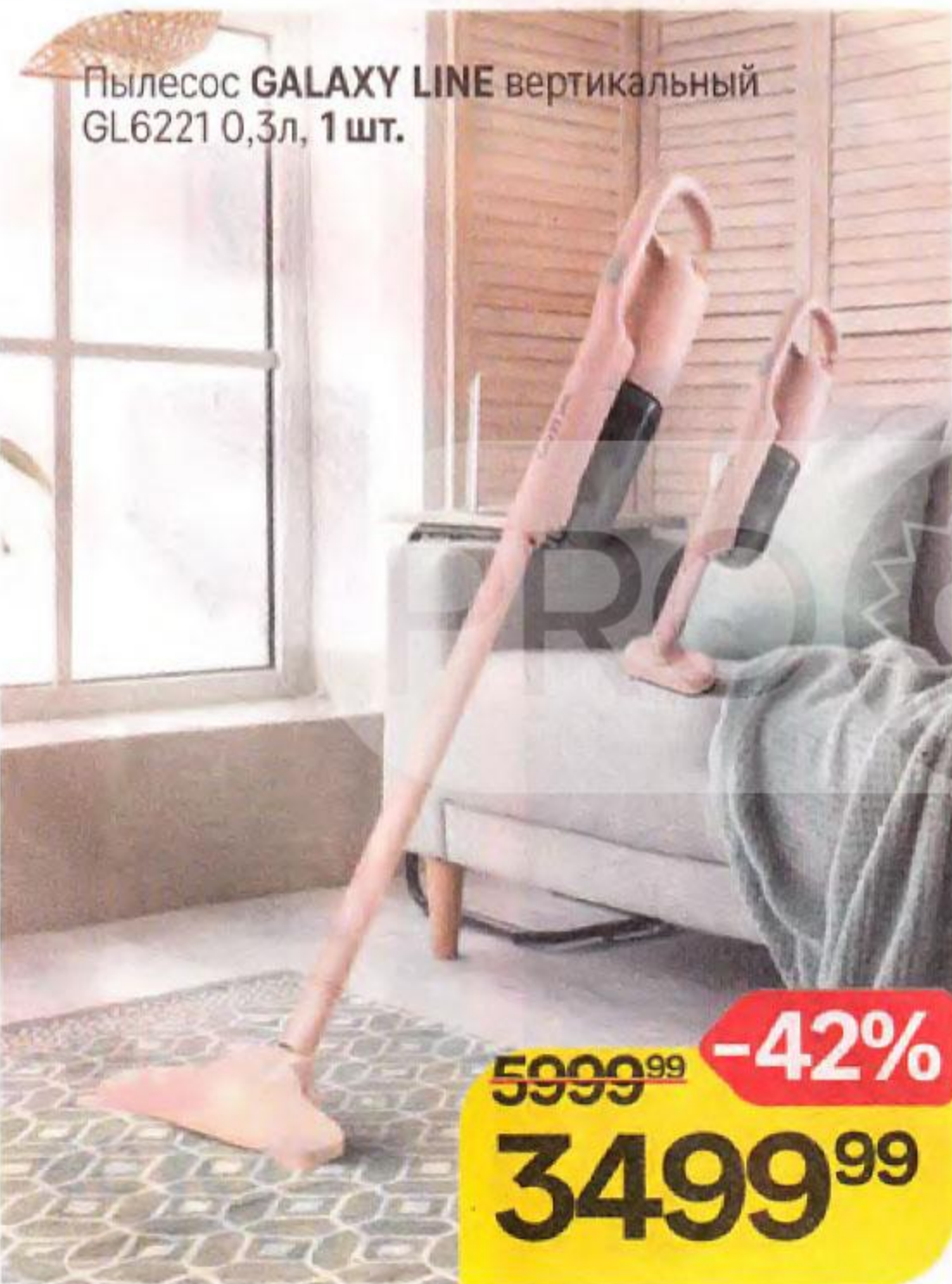
Пылесос GALAXY LINE вертикальный GL6221 0,3л, 1 шт.