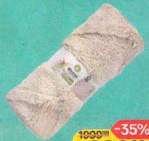
Коврик WELLFORT® , Интерьерный, 80x120см, 1 шт.