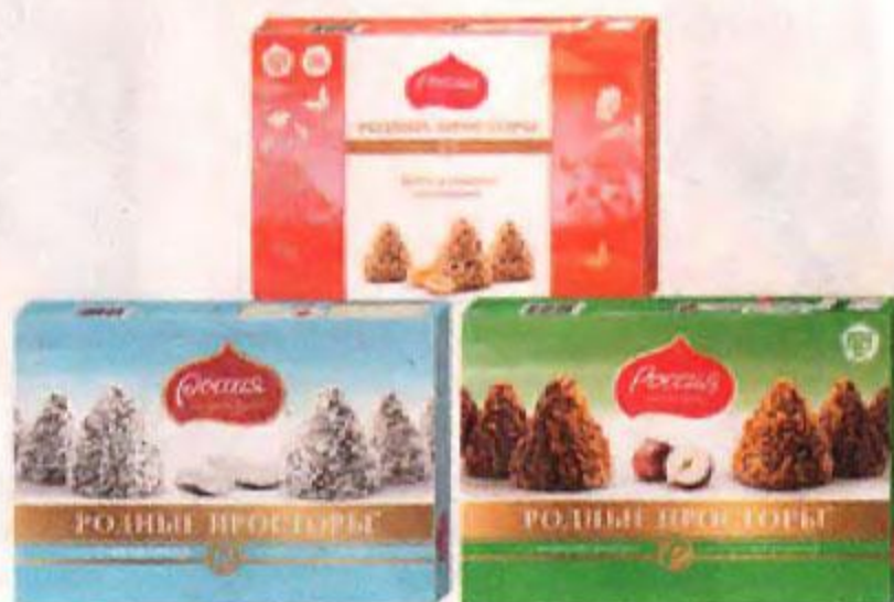
Шоколадные конфеты в коробках РОДНЫЕ ПРОСТОРЫ