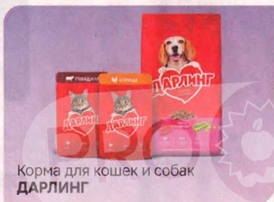
Корма для кошек и собак ДАРЛИНГ