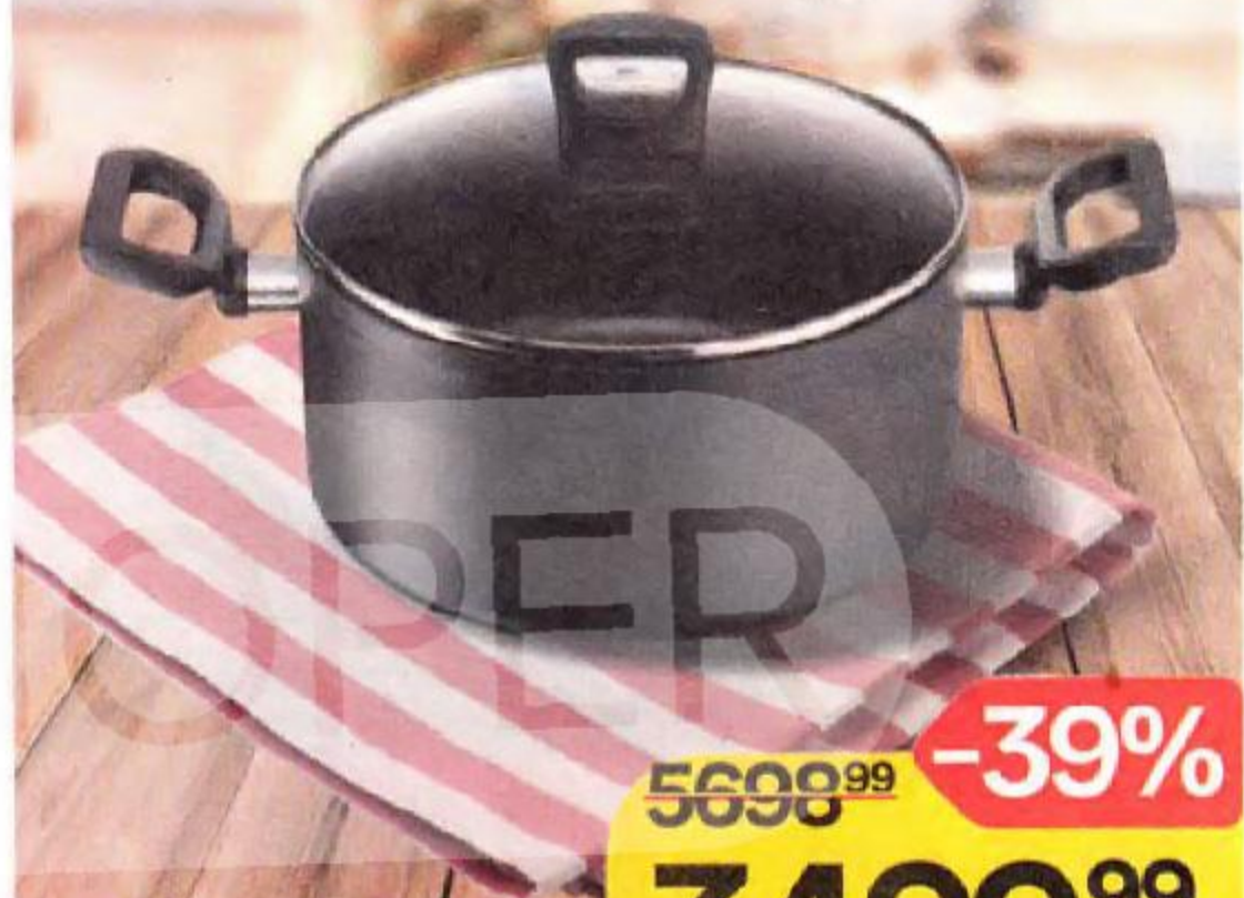
Кастрюля TEFAL® Flavor Force , 24см, индукционная, 1 шт.