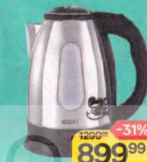
Чайник ECON , металлический, 1,7л, 1500Вт, арт. ECO-1874KE, 1 шт.