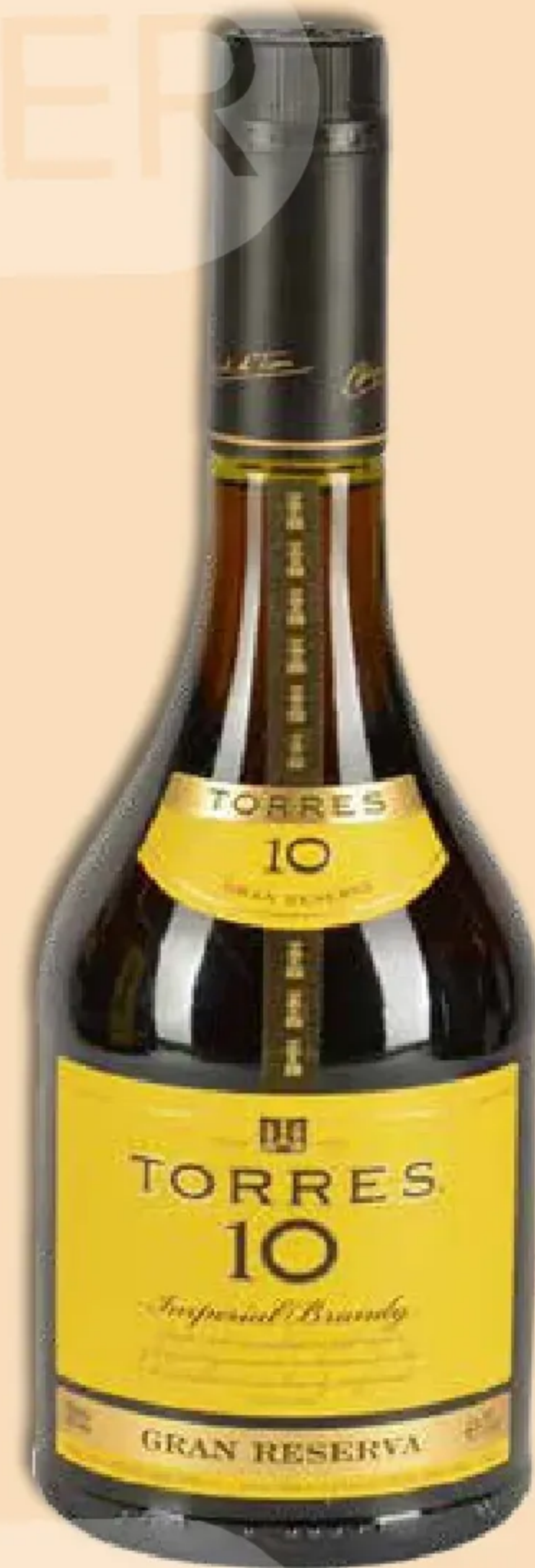
Бренди TORRES 10 Гран Резерва 38%, 0,7 л Испания