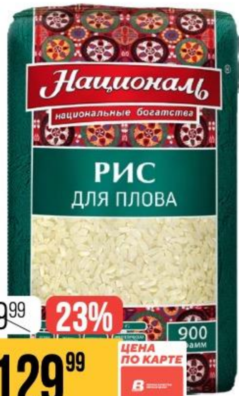
РИС ДЛЯ ПЛОВА Националь, 900 г 152472