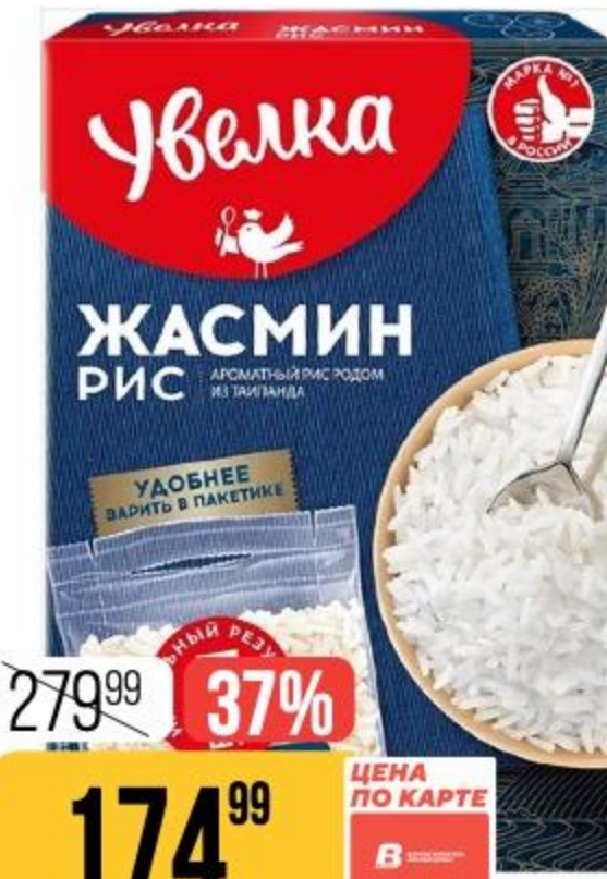
РИС ЖАСМИН Увелка, 400 г 203632