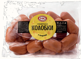
САРДЕЛЬКИ "КОЛОБКИ" С СЫРОМ ВАР. 1 КГ, МК "БАЛТИКА"