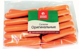
СОСИСКИ "ОРИГИНАЛЬНЫЕ" ВАР. ОХЛ. 1 КГ, ВММД