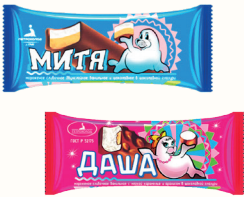
БЗМЖ МОРОЖЕНОЕ "ДАША", "МИТЯ" В ШОКОЛАДНОЙ ГЛАЗУРИ, 70 ГР