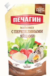
МАЙОНЕЗ "ПЕЧАГИН" С ПЕРЕПЕЛИНЫМИ ЯЙЦАМИ 50%, 750 МЛ