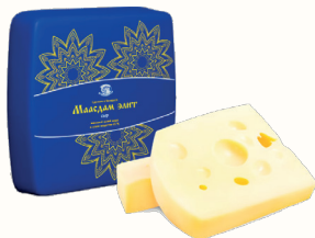
БЗМЖ СЫР "МААСДАМ ЭЛИТ" 45%, 1 КГ