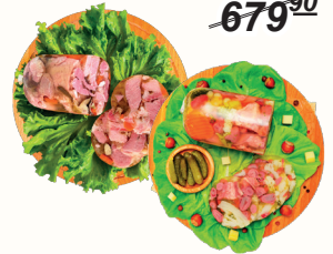
ЗАЛИВНОЕ: АССОРТИ С МАСЛЯТАМИ, АССОРТИ С МАРИНОВАННЫМИ ОГУРЧКАМИ 1 КГ, "СМОЛМЯСО"