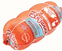
КОЛБАСА "МОЛОКУША" ВАР. 400 ГР, "СТАРОДВОРСКИЕ КОЛБАСЫ"