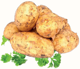
КАРТОФЕЛЬ, 1 КГ