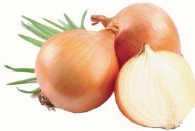
ЛУК РЕПЧАТЫЙ, 1 КГ