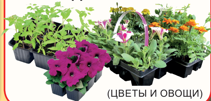
(ЦВЕТЫ И ОВОЩИ)