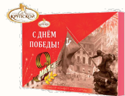
НАБОР КОНФЕТ "КФ им. Н.К. КРУПСКОЙ" 249 ГР