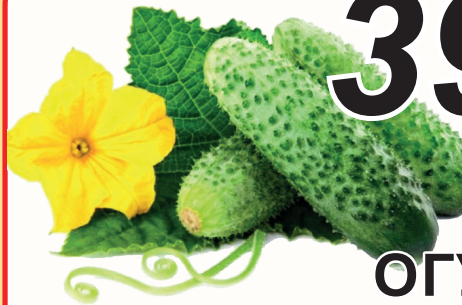
ОГУРЦЫ 1 КГ