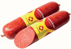
СЕРВЕЛАТ "ФИНСКИЙ" В/К 1 КГ, "ОСТАНКИНО"