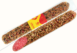
КОЛБАСА "ПРЕСИЖН" С/К В СПЕЦИЯХ 1 КГ, "ОСТАНКИНО"