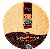
БЗМЖ СЫР "ПАРМЕЗАН" КЛАССИЧЕСКИЙ "ВЕРХНЕДВИНСКИЙ" 45%, 1 КГ