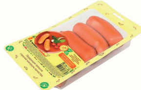
САРДЕЛЬКИ "ЭЛИТНЫЕ" ВАР. 400 ГР, "ИНЕЙ"