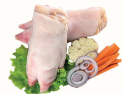
НОГИ СВИНЫЕ ЗАМ., 1 КГ

Ждём Вас по адресам: с 08:00 до 02:00 СПб, м. "Ладожская", пр. Косыгина, 21, с 08:00 до 01:00 м. "Пр. Просвещения", ул. Хошимина, 14