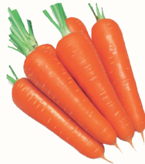
МОРКОВЬ, 1 КГ