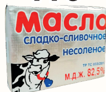
БЗМЖ МАСЛО СЛИВОЧНОЕ НЕСОЛЕННОЕ ТРАДИЦИОННОЕ "СЛИВОЧНАЯ СТРАНА" 82,5%, 180 ГР