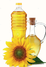
МАСЛО ПОДСОЛНЕЧНОЕ, 800 МЛ