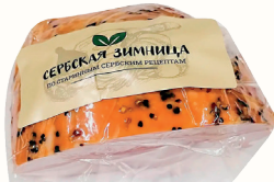
ОКОРОК "СТОЛИЧНЫЙ" К/В 1 КГ, "СЕРБСКАЯ ЗИМНИЦА"