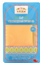
БЗМЖ СЫР "ГОЛЛАНДСКИЙ ПРЕМИУМ" СЛАЙСЫ 45%, 150 ГР