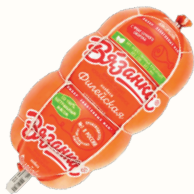
КОЛБАСА "ФИЛЕЙСКАЯ" ВАР. 400 ГР, "СТАРОДВОРСКИЕ КОЛБАСЫ"