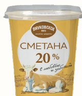
БЗМЖ СМЕТАНА "ВНУКОВСКОЕ" 20%, 310 ГР