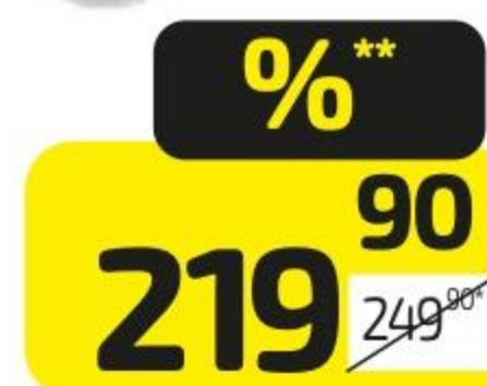
Мясо ТЭЙК ИТ по-французски с картофелем, 240 г