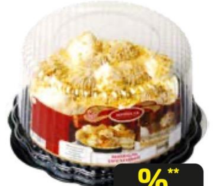
Торт ФИЛИ БЕЙКЕР Народная птичка классическая, 500 г