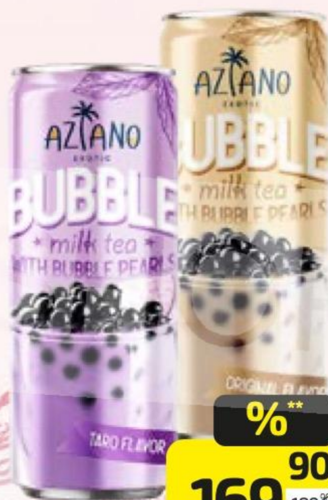
Чай молочный АЗИАНО таро с жевательными шариками, 250 мл