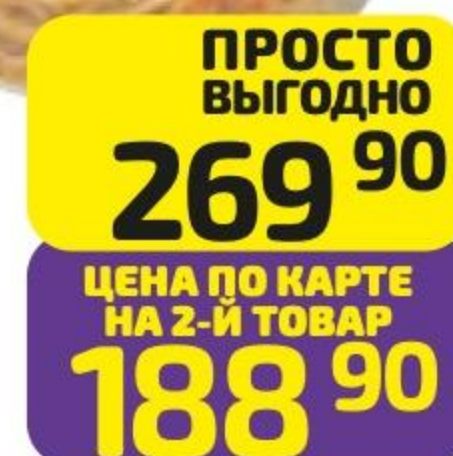
Паста ТЭЙК ИТ с креветками и соусом том ям, 250 г