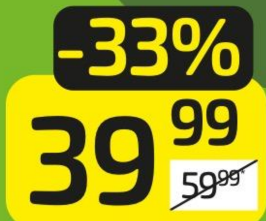
Багет фитнес из пшеничной муки, 1 шт.

Информация о товаре, участвующем в акции, о размере и порядке получения скидки можно узнать в торговых залах магазинов ДИКСИ. Сроки акции с 11—24 мая 2026 года.