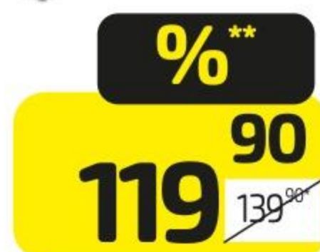
Салат ТЭЙК ИТ оливье, 180 г