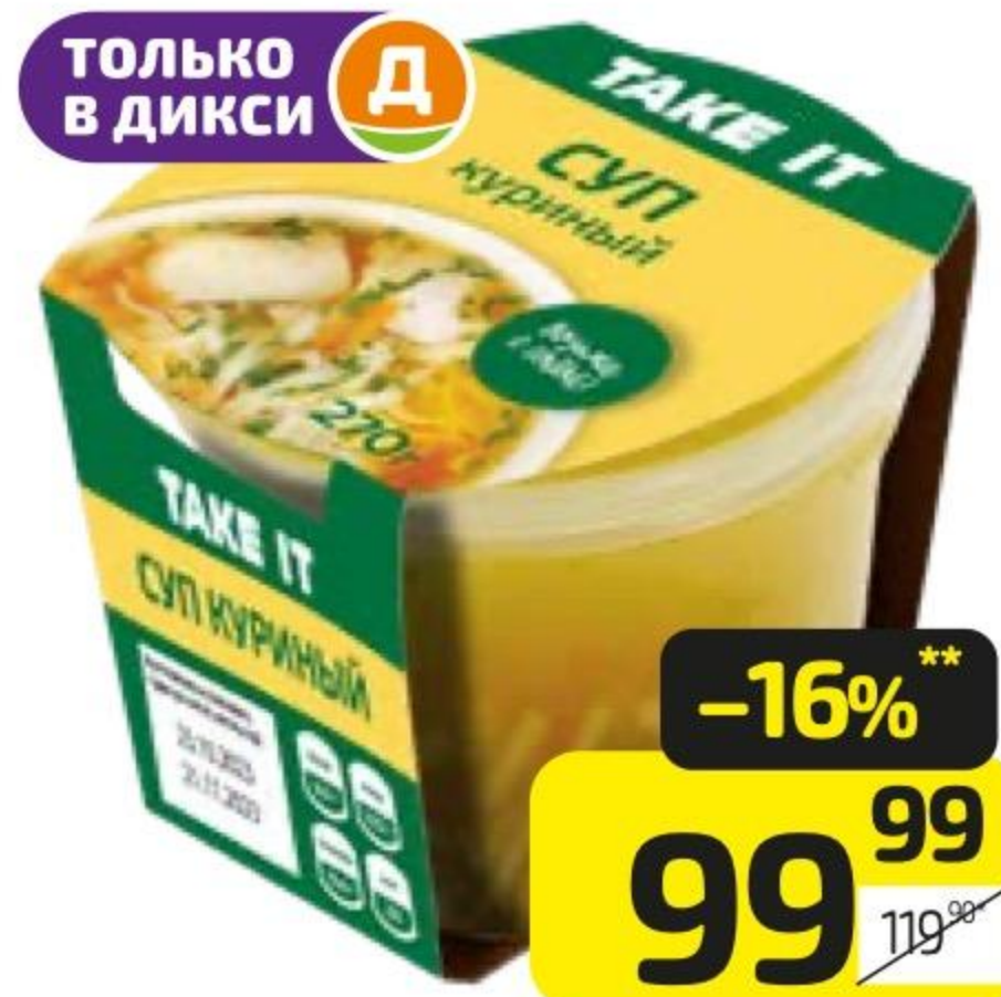
Суп КУРИНЫЙ ТЭЙК ИТ с домашней лапшой, 270 г