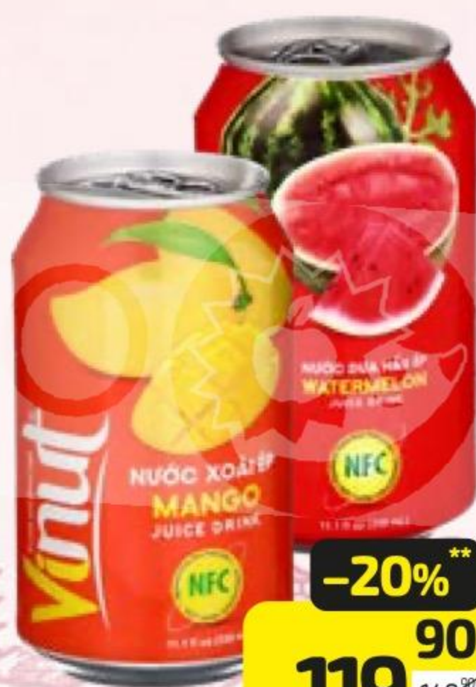
Напиток сокодержущий ВИНУТ , манго негазированный, 330 мл