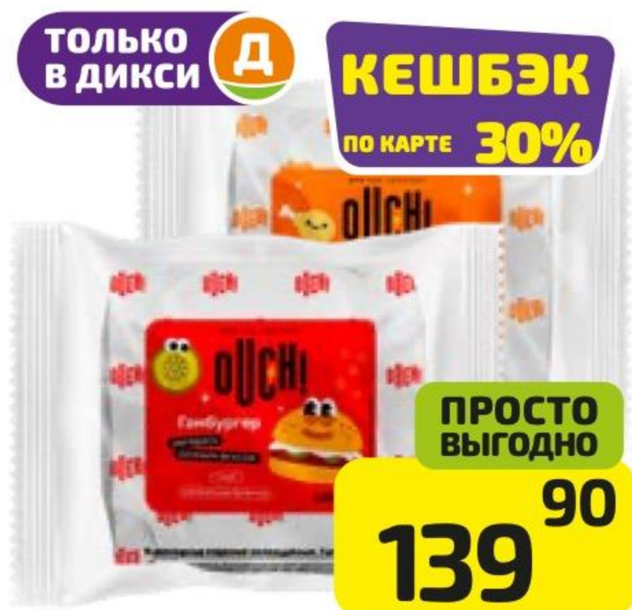
Гамбургер/Чикенбургер АУЧ! , 140/135 г