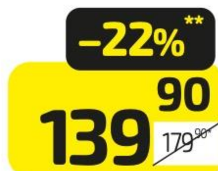
Чиабатта МИРАТОРГ с ветчиной и горчичным соусом, 190 г