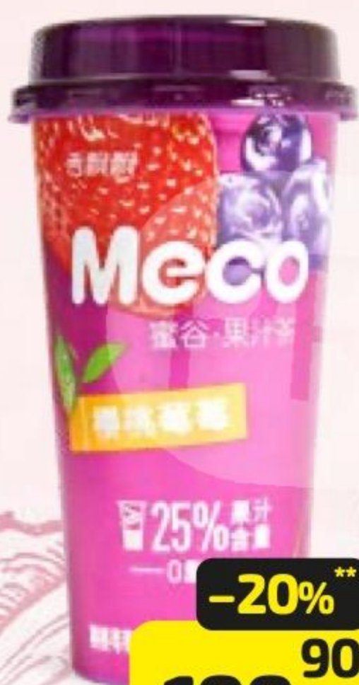
Чай МЕКО фруктовый, вишня-черешня-клубника, 400 мл