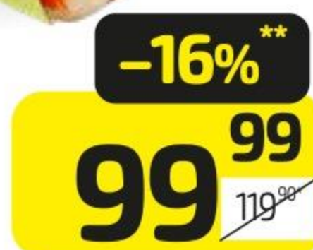
Салат О!ЛАЙФ витаминный, 200 г