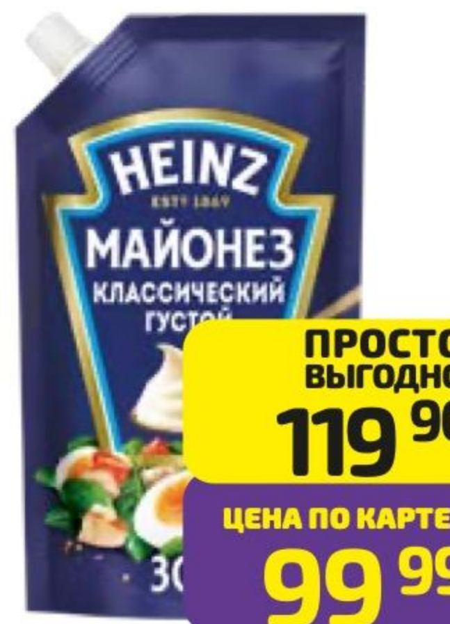
Соус ХАЙНЦ в ассортименте, 200 г

ПРОСТО ВЫГОДНО 119 90 ЦЕНА ПО КАРТЕ 99 99