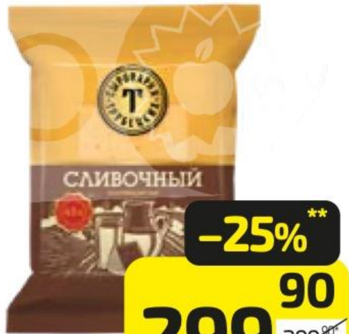
Масло сливочное БРЕСТ-ЛИТОВСК 82,5%, 360 г