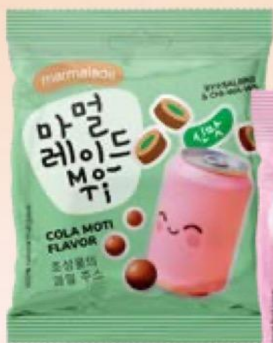
Мармелад ЧИ-ВА-ВА кусочки карандаша, кислый арбуз/кусочки карандаша, кислый, кола, 45 г