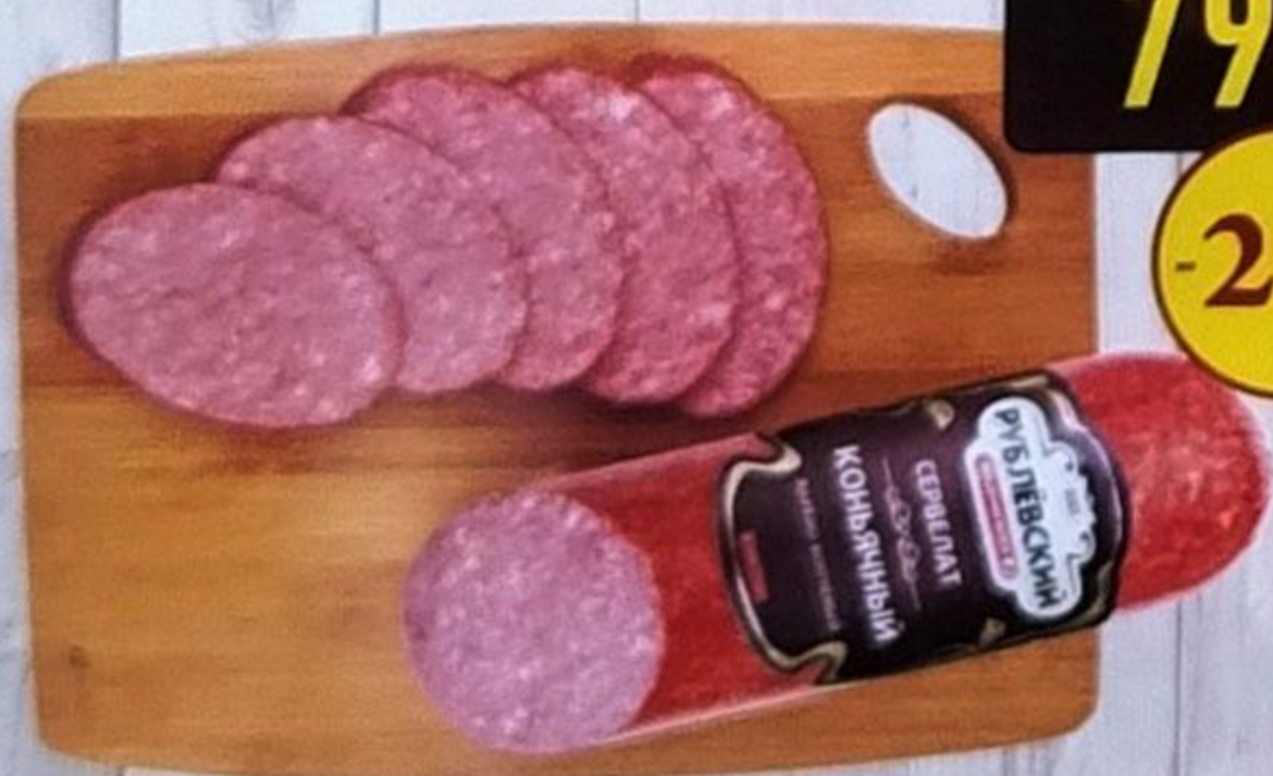
КОЛБАСА «СЕРВЕЛАТ КОНЬЯЧНЫЙ» варёно-копчёная