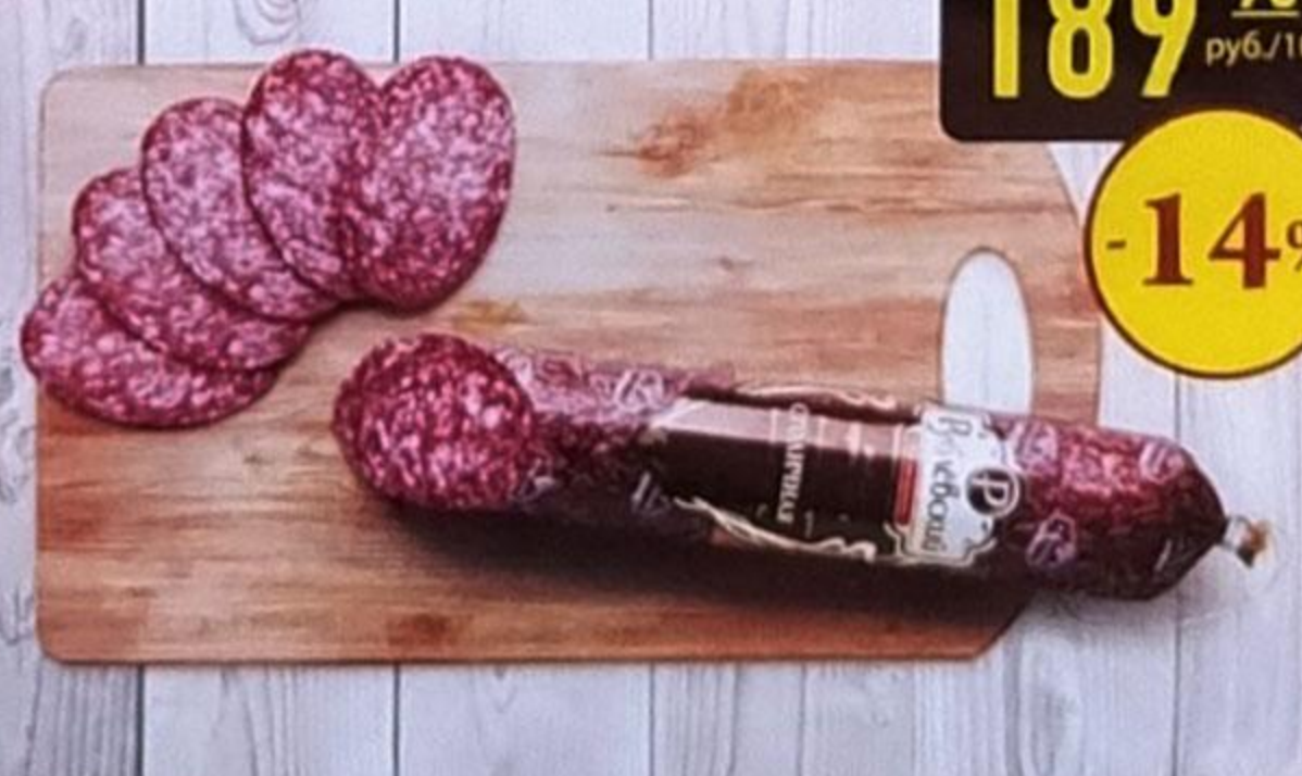
КОЛБАСА «СТОЛИЧНАЯ» сырокопчёная