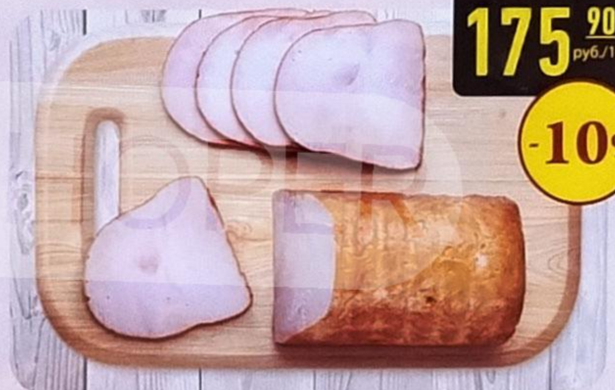
МАРИШАЛЬ «ПОСТНЫЙ» из грудки индейки