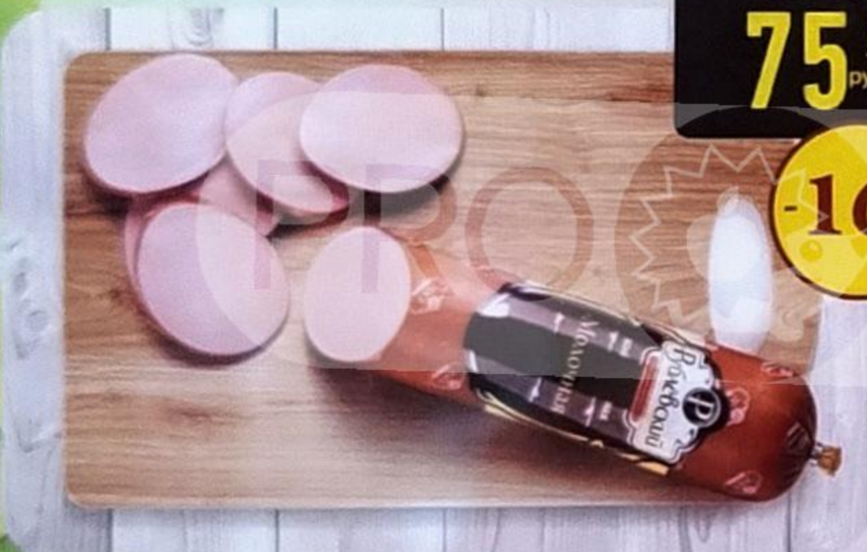
КОЛБАСА «МОЛОЧНАЯ» варёная, в белкозине