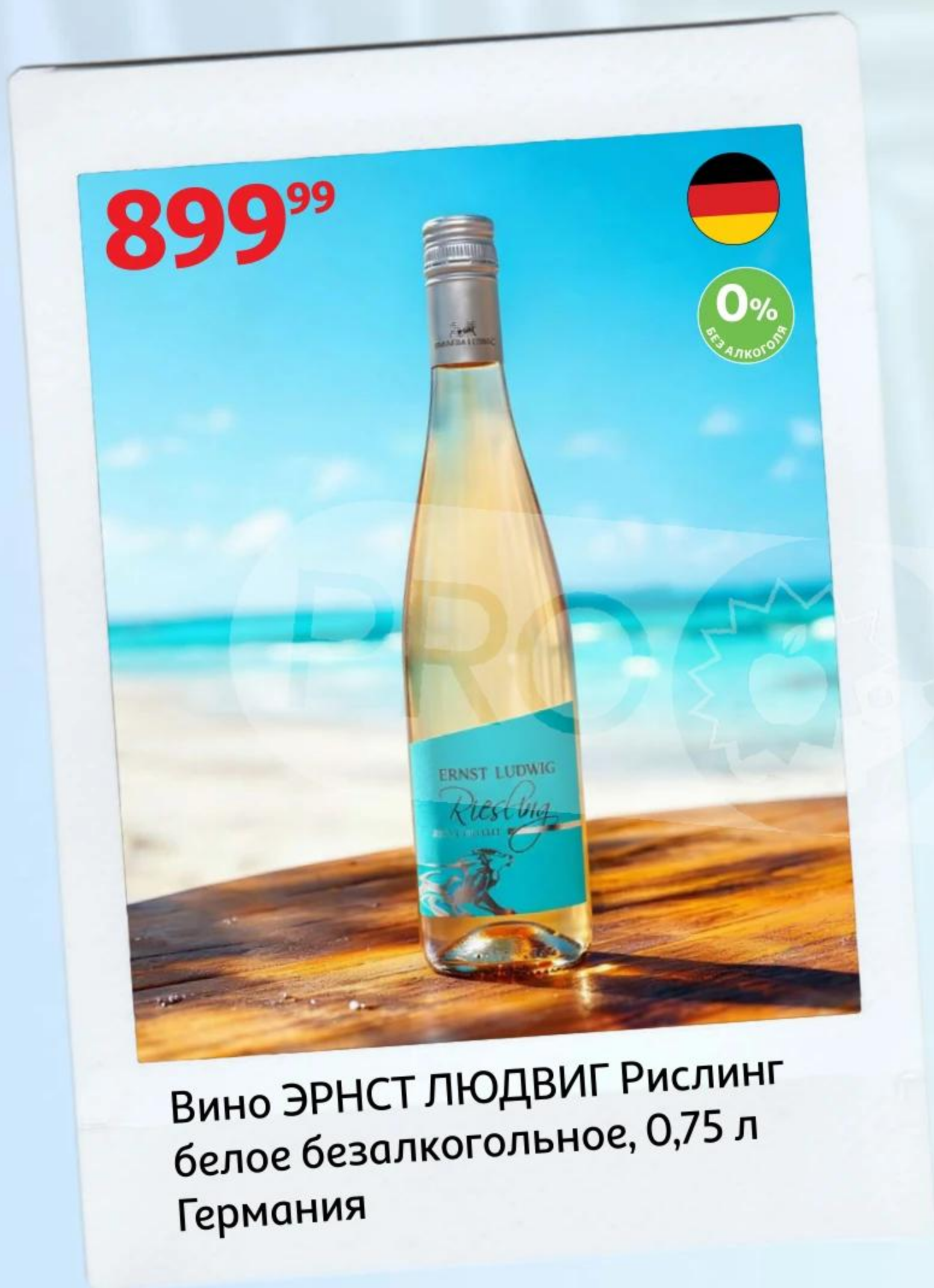
Вино ЭРНСТ ЛЮДВИГ Рислинг белое безалкогольное, 0,75 л Германия