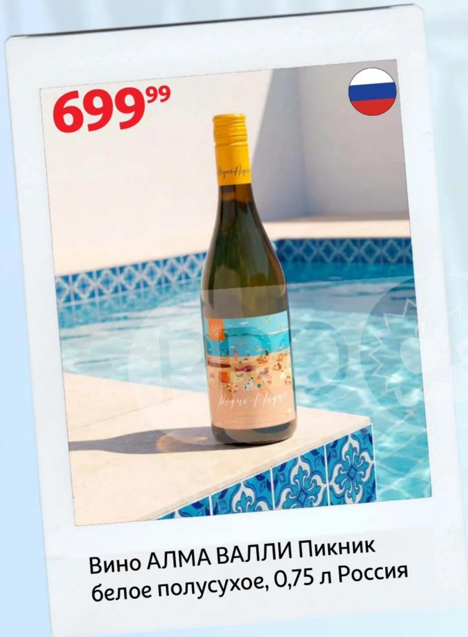
Вино АЛМА ВАЛЛИ Пикник белое полусухое, 0,75 л Россия