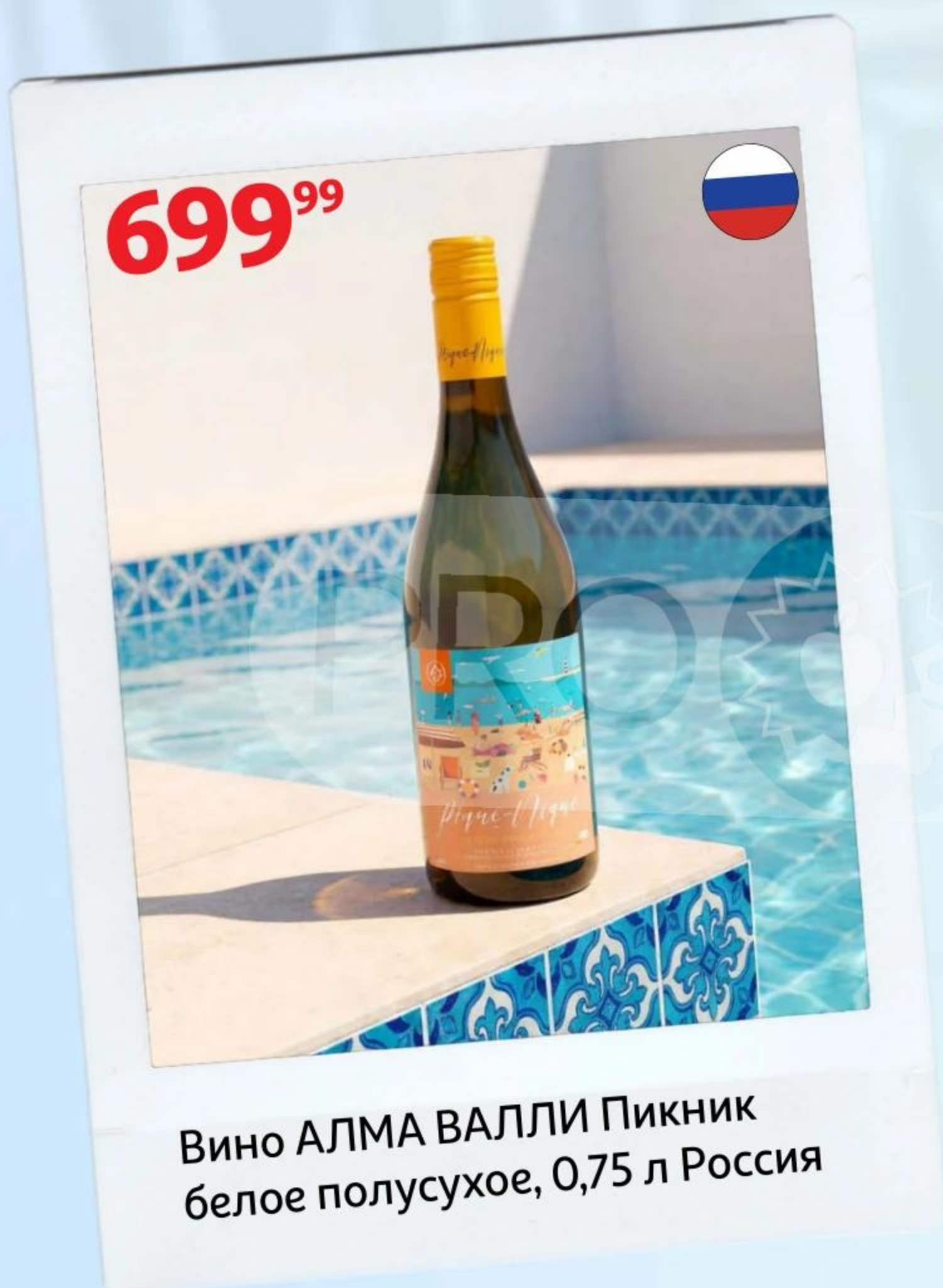
Вино АЛМА ВАЛЛИ Пикник белое полусухое, 0,75 л Россия