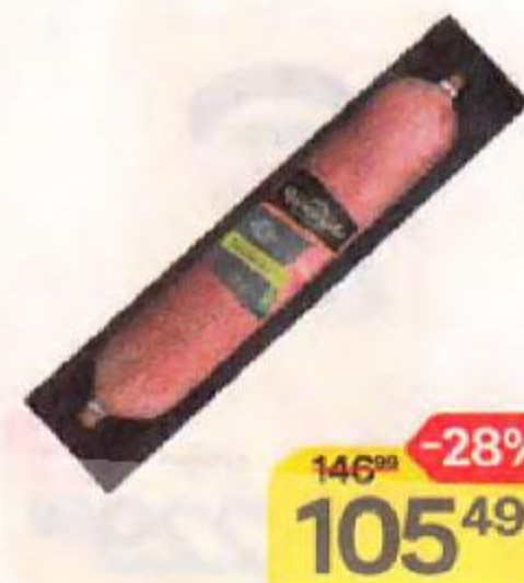
Колбаса ЧЕРКИЗОВО ПРЕМИУМ® , Сальчичон, сырокопченая, 100 г