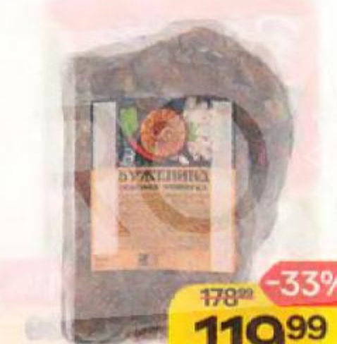
Буженина МЯСНАЯ ИСТОРИЯ , копчено-вареная, запеченная, 100 г