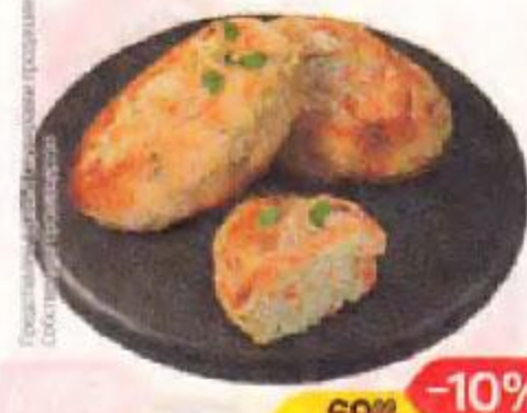
Котлета куриная ЗАГАДКА (СП), 100 г