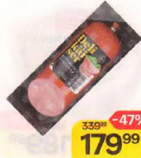
Колбаса DELIKAISER , Ветчинно-рубленая, полукопченая, 400 г