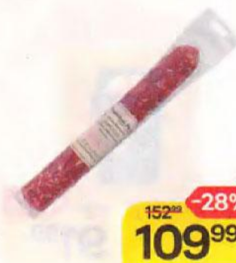
Колбаса ОХОТНЫЙ РЯД , Римская, сырокопченая, 100 г