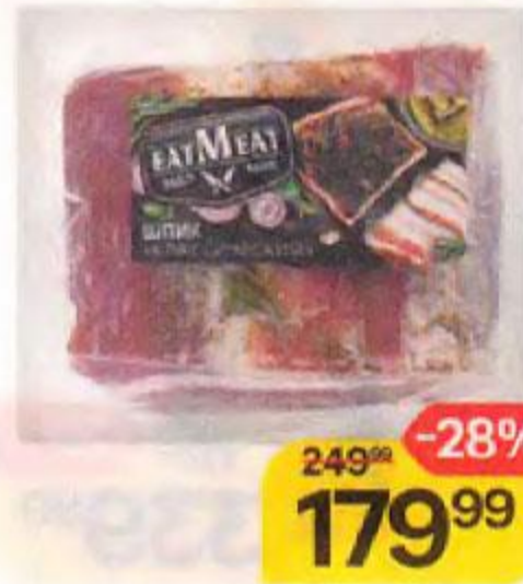
Шпик ЕАТМЕАТ , Классический, 300 г