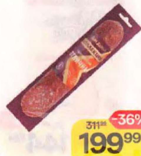
Колбаса ДЫМ ДЫМЫЧ® , Отличная, сырокопченая, полусухая, 250 г