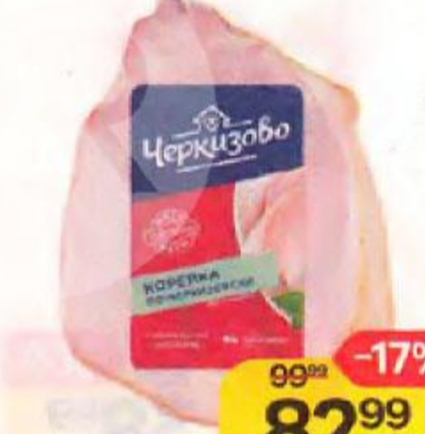
Корейка ЧЕРКИЗОВО® , по-черкизовски, варено-копченая, 100 г