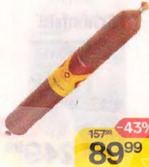
Колбаса ОСТАНКИНО , Пре-сижн, сырокопченая, 100 г