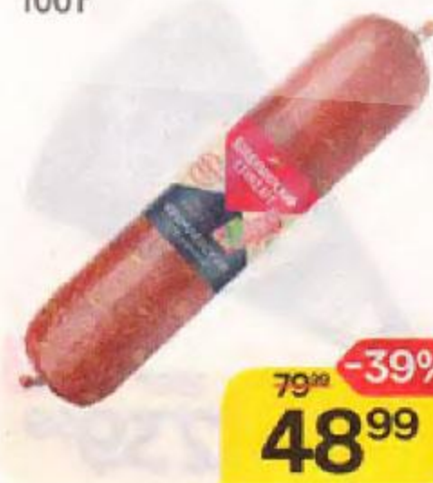
Колбаса ВЛАДИМИРСКИЙ СТАНДАРТ Кремлевская, с грудинкой, полукопченая, 100 г