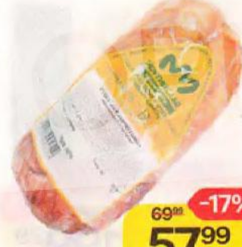
Рулет РЕФТИНСКАЯ , Узорчатый, варено-копченый, 100 г