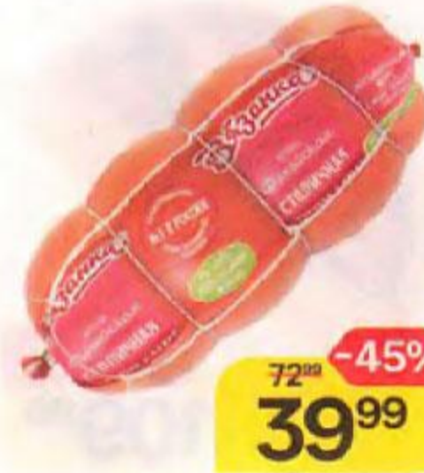
Ветчина ВЯЗАНКА , Филейская, Столичная, вареная, 100 г