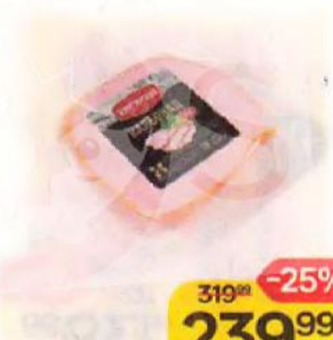
Карбонад КУНГУРСКИЙ МЯСОКОМБИНАТ , копчено-вареный, 300 г