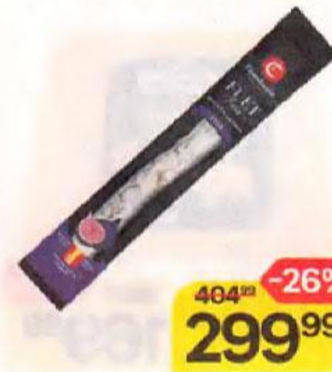
Колбаса CASADEMONT® Фуэт Экстра, с инжиром, сыровяленая, 110 г