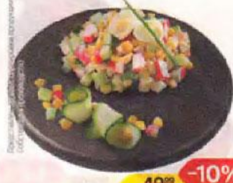
Салат КРАБОВЫЙ с огурцом (СП), 100 г