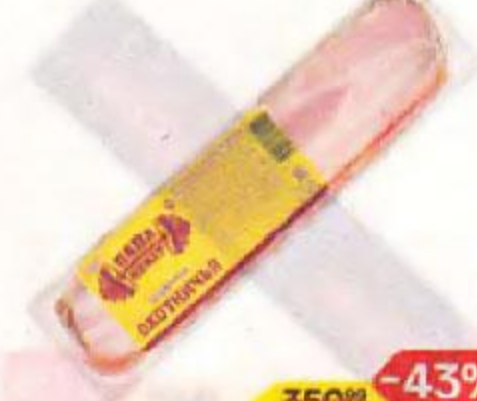
Грудинка ПАПА МОЖЕТ Охотничья, варено-копченая, 300 г