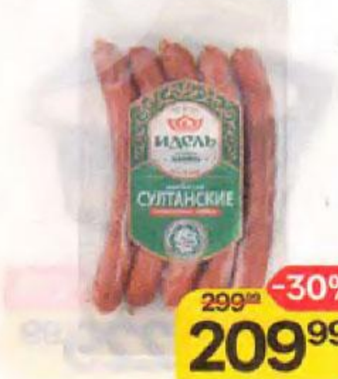
Колбаски ИДЕЛЬ , Султанские, Халяль, полукопченые, 300 г