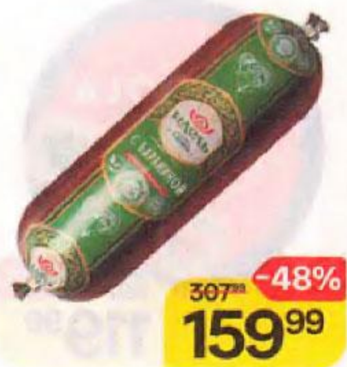
Колбаса ИДЕЛЬ , с бараниной, Халяль, полукопченая, 500 г