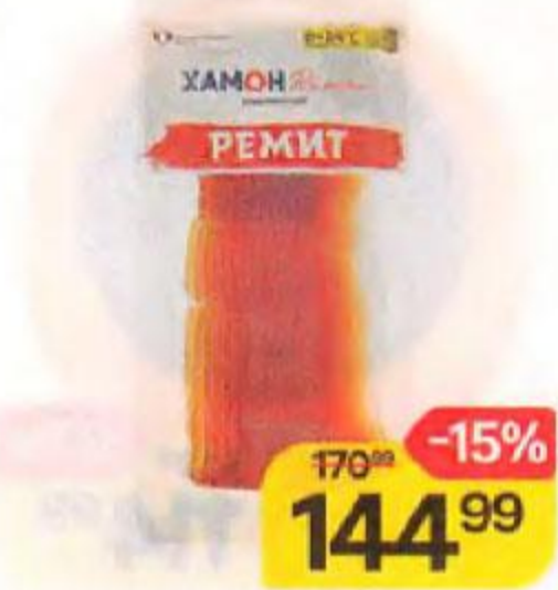
Окорок РЕМИТ , Хамон вяленый, нарезка, 55 г