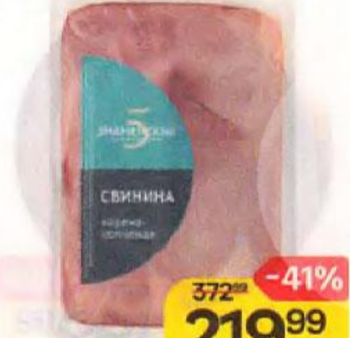
Свинина ЗНАМЕННЫЕ ДЕЛИКАТЕСЫ , лопатка, варено-копченая, 300 г