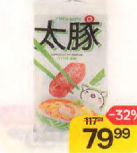
Колбаски ДЫМОВ Футо Бута, со вкусом Том Ям, сырокопченые, 50 г