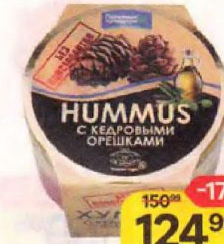
Хумус ПОЛЕЗНЫЕ ПРОДУКТЫ , с кедровыми орешками, 200 г