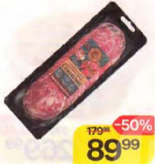
Колбаса МЯСНАЯ ИСТОРИЯ Сальчичон, сырокопченая, нарезка, 60 г