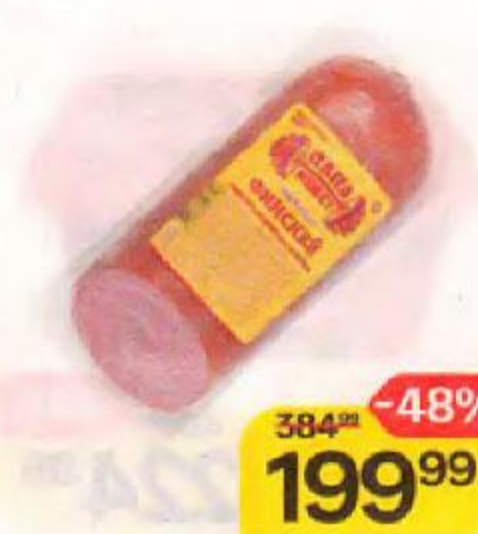
Сервелат ПАПА МОЖЕТ , Финский, варено-копченый, 420 г