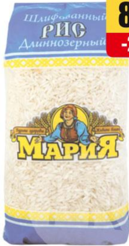
РИС ДЛИННОЗЁРНЫЙ МАРИЯ, 800 Г