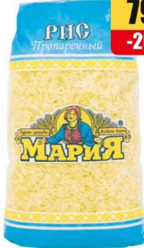
РИС ПРОПАРЕННЫЙ МАРИЯ, 800 Г