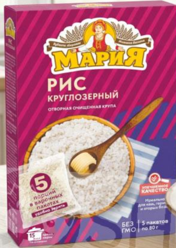
РИС КРУГЛОЗЁРНЫЙ МАРИЯ, В ПАКЕТИКАХ, 400 Г ВТОРОЙ СО СКИДКОЙ -50%